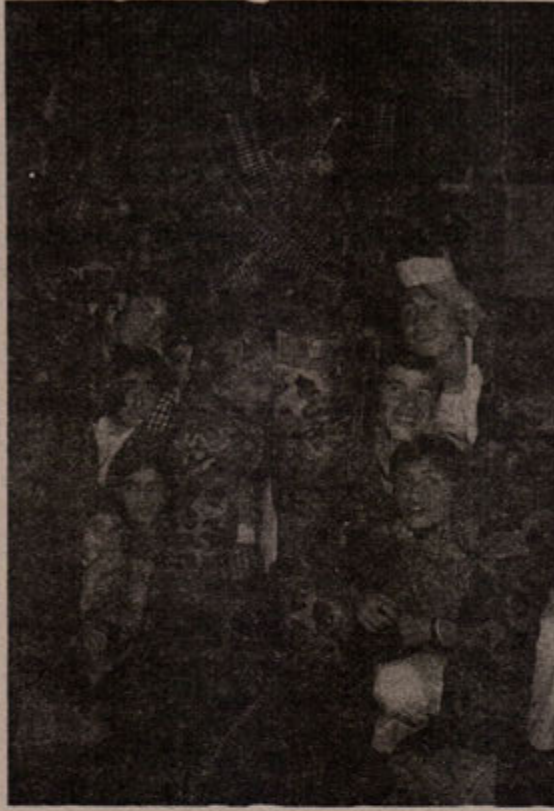
Özel Tim'in M-16'sı bu düzeni korumaya ne kadar yetecek.

oldukça ciddi farklılıklar söz konusudur. Bu ciddi özgül farklılıklar sözkonusu modellerin aynı verimi ülkemizde verebilmesine engel olmaktadır. Söz gelimi İspanya'da Bask Bölgesi ülkedeki 17 özerk bölgeden biri olarak, kültür, gençlik, spor, bilim, sağlık, maliye vb. alanlara da geniş etkilere sahip hükümet ve parlamento ya, özerk polis örgütü, hatta özerk bayraklarına sahip bir sıfatı taşımaktadır. Yine Galler sorunu ise "ulusal özümleme" yoluyla esas olarak halledilmiş, ulusal farklılıklar önemli oranda ortadan kaldırılmıştır. Ayrıca bu ülkelerin ekonomileri Türkiyeden çok daha güçlü bir içeriğe sahip olduğundan aradaki farklılaşmanın boyutları ciddi seviyelerde azaltılmıştır. Ve nihayet bu ülkeler burjuva demokratik devrimlerini tamamlamış, burjuva demokrasisinin tüm kurumları işler hale getirilmiştir. Türkiye ise bahsi geçen öğelerin olumlu etkilerinden hiçbirine sahip değildir. Dolayısıyla bu modellerin Türkiye açısından neler getirip ne-