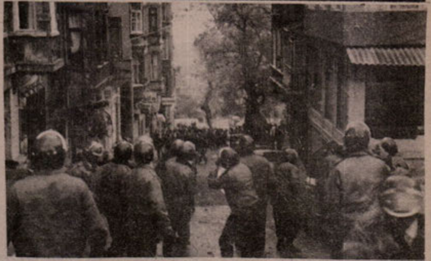
1 Mayıs sabahında Harbiye'de, Dolapdere'de, Kazlıçeşme'de, Güngören'de, Incirli'de devrimci mücadelede....

'89 1 Mayıs'ında '1 Mayıs'ta meydanlardayız' nutukları atan, saat gelip çatığında sendika merkezlerinden adımını dışarı atmayan, işçi sınıfını arkadan hançerleyen Otomobil-İş, Petrol-İş vb. reformist sendikalar bir kez daha ihanetlerini sergilediler; 1 Mayıs'ta işçi sınıfının üretimden gelen gücünü kullanmasına, sokaklarda, meydanlarda devrimci gösterilerde bulunmasına karşı çıkarak, Türk-İş'le aynı tavrı sergilediler. 1 Mayıs'ı "işyerlerinde bildiriler okuyarak, yarım saat üretimi durdurarak" kutlayacağız diyerek işçi sınıfının gücünü kullanmasına ambargo koymaya çalıştılar. Otomobil-İş, Petrol-İş vb. sendika patronlarının 1 Mayıs kutlamasına karşı bu açık tutumu sendika şubelerinin ve devrimci işçilerin tepkileriyle karşılaştı. Burjuvazi ve sendika ağalarının 1 Mayıs'ın kutlanması önünde oluşturulan bu engeli etkisiz kılmak için devrimci işçi-