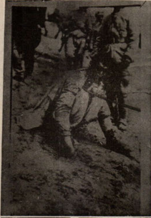
Kemalist zulüm , Dersim'li Kürt köylüleri prangaya vuruyor..

Şeyh Sait isyanının patlak verdiği günlerde İngiliz silah fabrikalarından Şeyh Sait'e çeşitli silah kataloglarının gelmesi emperyalizmin bu konudaki çalışmalarını doğrulamaktadır.(Age. sf. 308)