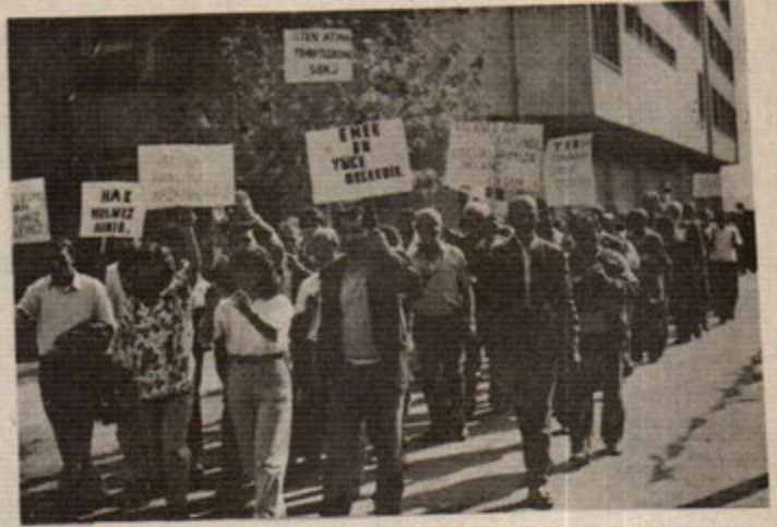
Belediye işçileri omuz omuza, bir ağızdan sloganlarla haykırarak hakları için yürüyorlar.

Belediye yönetiminin ayrıca, işçilerin Ekonomik-Demokratik Hakları için sürdürdüğü mücadelesini bölmek ve etkisizleştirmek amacıyla sürgünlere de başvurduğunu söylüyorlar. Ör-