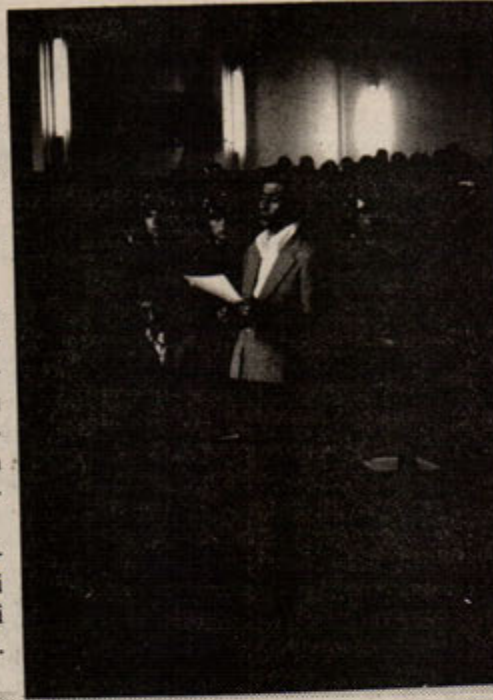
Güney Yargılanırken Haykırıyor: "Düşüncelerim Tek Bir Noktada Toplanmıştır: DEMOKRATİK HALK DEVRİMİ"

Âzem (Y.Güney) böyle bir aileye konuk oluyor. Gözlemliyor ve erimini belirliyor. Genç bir işçiden yola çıkarak kitleyle bağ kuruyor. Onlara gerçek kurtuluşun otomobil lastiklerini kesmekle, cam kırmakla değil de, okumak, bilinçlenmek ve sonuçta sosyal pratiği yaka-