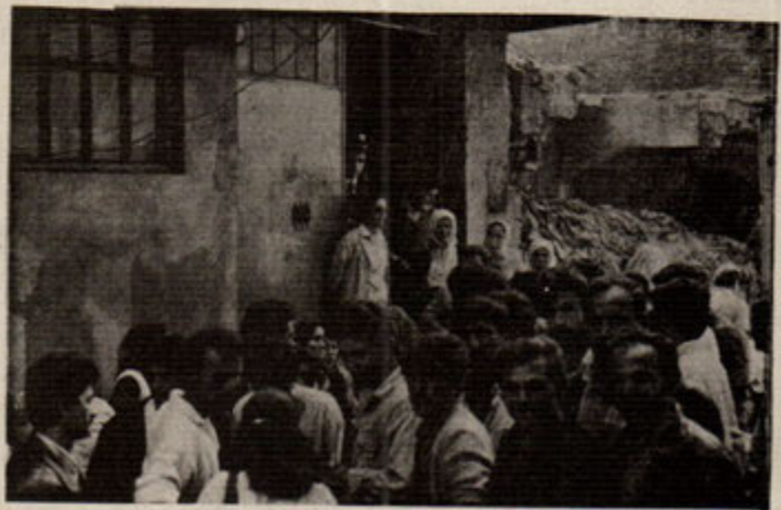
İşverenin çeşitli oyunlarına karşı deri işçileri direnişin silahlarıyla

Eylül 1991'de toplu sözleşmeler olumlu yönde imzalanmıştır. Bu süreçte örgütlülüğe yönelik KEMALLER DERİ'de 33 kişi, YÜKSELLER DERİ'de 7 kişi işten atılmıştır. Buna karşı topluca direnişe geçen işçiler, YÜKSELLER DERİ'de 3 gün sonra işverene geri adım atarak, atılan 7 işçinin tekrar işe alınması sağlanmıştır. Ancak, KEMALLER DERİ'e atılan işçilerle dayanışma içinde olan, geri kalan 43 kişi de işten atılmıştır. Atılma gerekçesi olarak, 17. madde gösterilmiştir. İşverenin, tespit için iş yerine getirdiği Noter, bütün işçilerin adını alarak patronun lehine, 17. maddeden zabıt tutmuştur. Öyle ki bu zabıtta adı geçen işçilerin kimisi o dönem yıllık iznini kullanmak için memleketinde, kimisi de her şeyden habersiz çalışmaktadır. Hatta Tuzla'daki fabrikada bekçilik yapan kişide ayelhine zabıt tutulanlardandır. Noter bu zabıtı