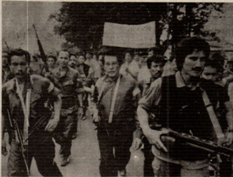
Yeni Halk Ordusu Gerillaları