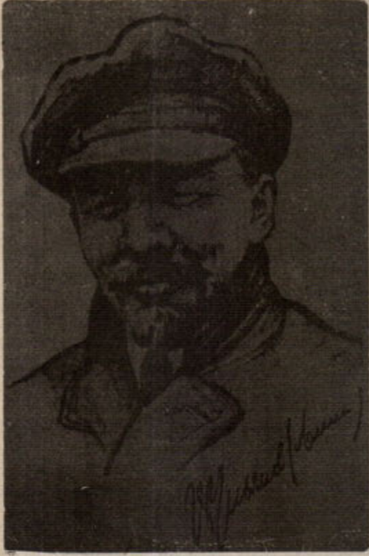
Lenin'in düşünceleri, O'nu iyi kavrayanların yolunu ışıltıyor.

nizmle arasına kalın bir çizgi çekmiş ve halk savaşı teori ve taktiklerinin ülkemiz somut gerçekliğiyle bütünleşmesini sağlamıştır. Parti, ordu, ittifaklar, cephe vb. önemli sorunları kendinden önceki oportünist-revizyonist görüşlere saldırı temelinde açıklığa kavuşturdu. Leninist çalışma yöntemlerini ve kitle çizgisini silahlı mücadelenin devrim ruhu ve zeminini haline getirdi. O'nun çalışma biçimi, kadrolar, örgütlenme ve mücadele sorununa ilişkin görüşlerini okuyanlar bu görüşlerin dokusunun güçlü Leninist bir öğeyle bezendiğini görürler.