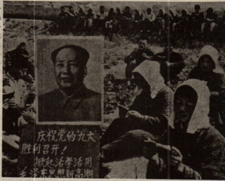
(Kültür Devrimi) MLMZD Dünya proletaryasının kurtuluşuna yol gösteriyor.

burjuva, yani kapitalist toplumsal ve ekonomik sistem çerçevesinin dışına çıkmayan bir devrimdir." Toplumsal niteliği ve ekonomik özü açısından ilk adımda, henüz yeni tipte, karakterde, demokratik karakterde olmasın; henüz proleter sosyalist karakterli olmamasına karşın, proletaryanın ideolojik, politik, örgütsel önderliği altında, proleter-sosyalist dünya devriminin bir parçası ve bağlaşığıdır.