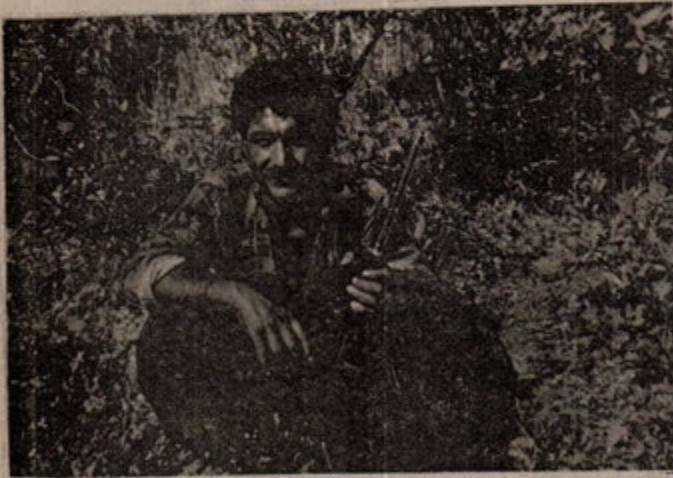
O. İ. KAYPAKKAYA'nın "Bu yola fedaysa canımız, kesindir zaferimiz, susmasın silahlarımız!" şiarıyla toprağa düştü.