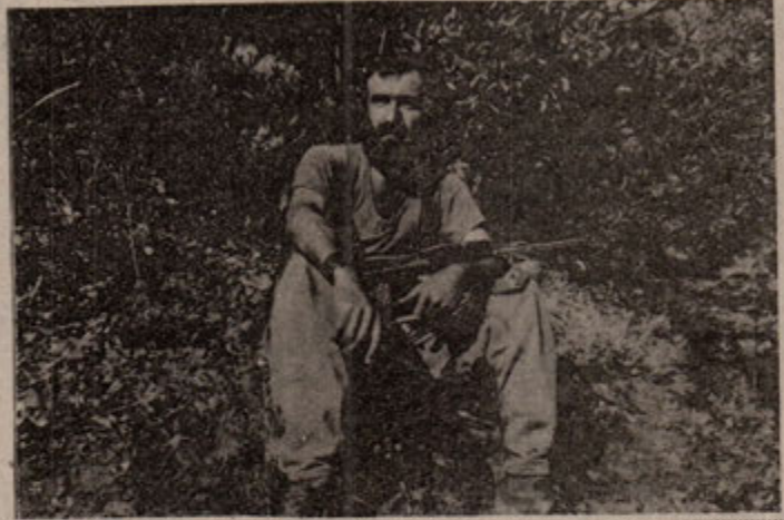
TIKKO Gerillası; sen ölümsüzlüğe ulaşırken, yoldaşların "Gerillalar Ölmez, Yaşamın Halk Savaşı" şiarıyla çatışmaya devam ediyorlardı.

Sivil Timi, köy korucusu ve erleriyle 400'ün üzerinde bir mevcut ve helikopterlerin de havadan desteğiyle TKP/ML önderliğindeki TIKKO gerilla birliğini saran düşman, çatışmada verdiği kayıpları her zaman olduğu gibi yine gizlemeye çalışmıştır. Olayda, 1 Astsubay, 1 köy korucusu, 1 sivil tim ve er olmak üzere düşmana beş kayıp verilmiş, ayrıca üç erde yaralanmıştır. 9 saat süren çatışmadan sonra, helikopterlerinin de yara alması sonucu TC güçleri olay yerini 1 km gerisine çekilmek