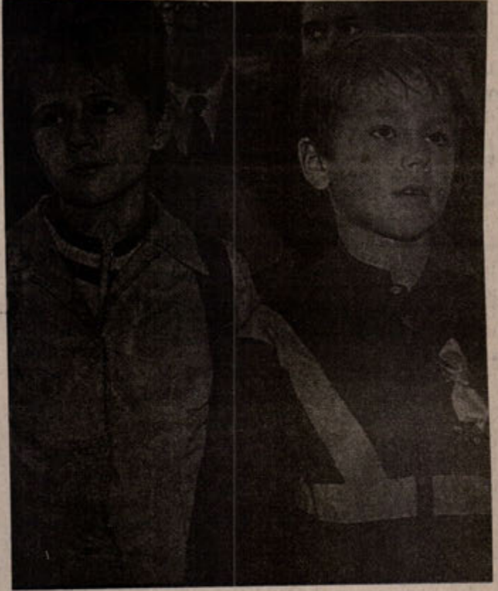
Çernobil'in mi, emperyalizmin mi kurbanları?

Radyasyondan korunma memuru veya sağlık fizikçisinin