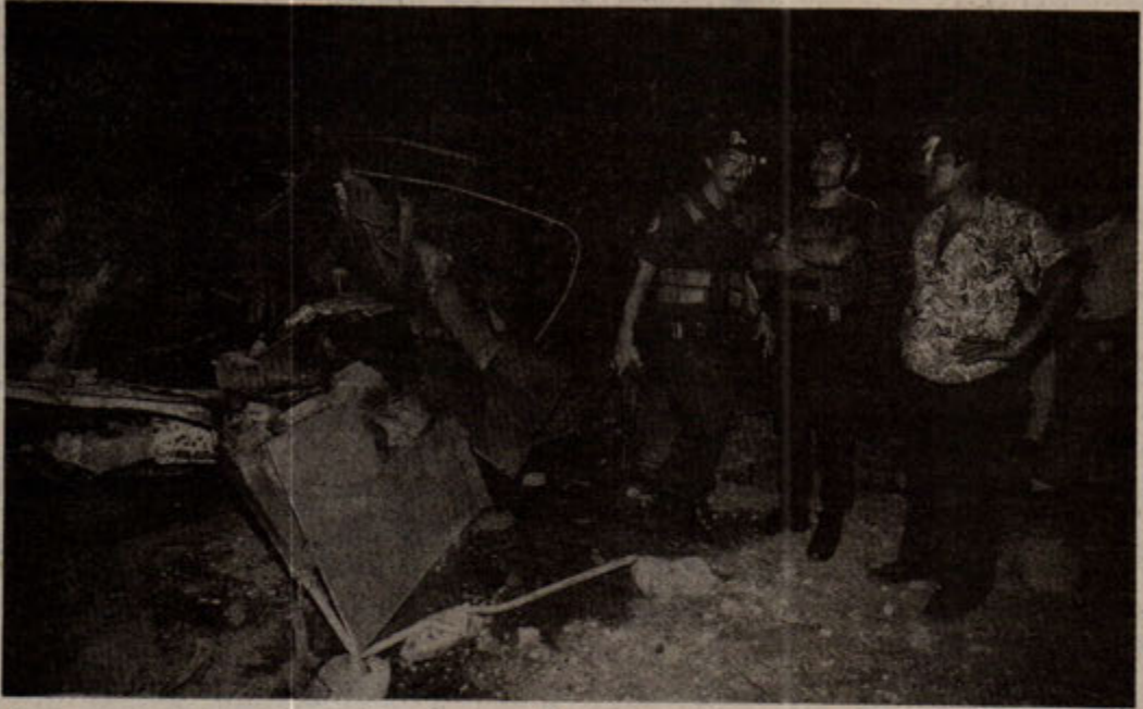
Başkan Fujimori'nin 8 Nisan günü PKP gerillalarını yok edeceğini açıklamasından kısa bir süre sonra, PKP gerillaları bir otobüsü dinamitle doldurarak, bir polis karakolunun önünde uzaktan kumandayla patlattı. Sonuç: 3 polis ölü, 22 yaralı.

nın Haklarını Savunma Hareketi yaptığı açıklamada; "şuanda Canto Granda'daki 1000 tutuklu ağır silahlı taburlar tarafından çevrilmiş ve adli mahkumlar ise aynı 1988 Alan Garcia hükümetinde olduğu gibi siyasi mahkumları rahatça soykırımına uğratmak amacıyla cezaevinden başka bir yere götürülmüştür.