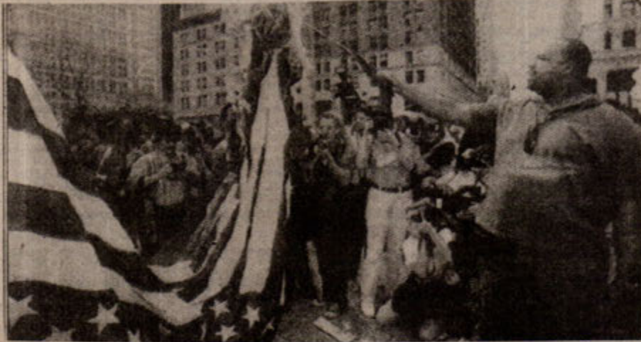
Birleşmiş Milletler Cemiyeti'nin ırkçılığa ne kadar karşı olduğu, patronu ABD'nin mahkemelerinde zencilere karşı alınan kararlar ortaya kondu.

Sonuç olarak; ırkçılık ML/MZD'nin bilimi ışığında proletarya partilerinin önderliğinde tepeden tırnağa yapılan yeni demokratik devrim ve sosyalist devrimle ancak ortadan kaldırılabilir.