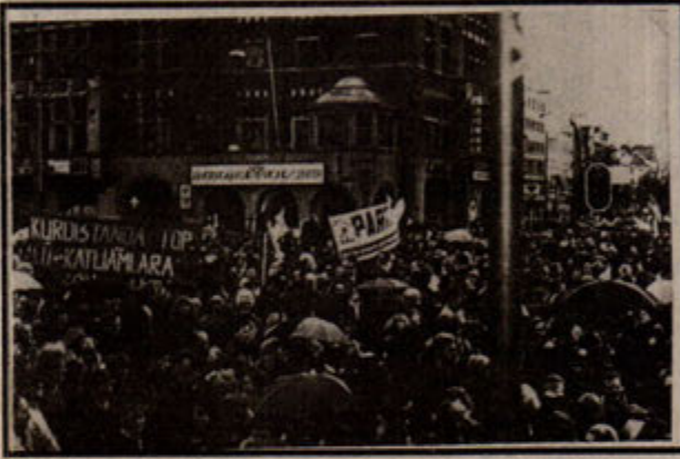
Avrupa'da binlerce insan Newroz katliamını pankartlı sloganlı gösterilerle protesto ettiler.

DYP-SHP birlikteliği ilk günlerdeki "çoşku"dan uzaktır. Yığınlar bu iktidar "alternatifi"nin de kendilerine hiç bir şey veremeyeceğini görmektedirler. Öte yandan, Kürdistan'da da başlatılan "Şefkat" manevraları da sonuç vermemiştir. Kitle katliamları birbirini izlemiştir. Devletin denetimi altındaki "Hizbu-kontra" güçlerinin katlettiği ilericilerin sayısı daha da artmıştır. Kürdistan açık savaş kurallarının ayaklar altına alındığı bir soykırım işgali altındadır. "Devletin gücünü tesis etme"nin bedeli yüzlerce Kürt emekçisinin katline mal olmuştur. Batı'da özellikle İstanbul'da da yeni yapılanmalara girilmiştir. Militarist güçlerin sayısal artırımları yanında, teknik açıdan ABD'ce sağlanmış yeni bir dananım sağlanmıştır. Bütün bunlar, gelecekte daha kapsamlı ve şiddetli saldırıların başlatılacağını göstermektedir. Katiller sürüsü haline getirilmek istenen yeni askerlik tasarısı da bunu tamamlamaya yöneliktir.