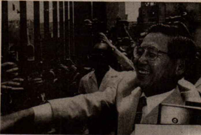
Fujimori'nin işi oldukça zor