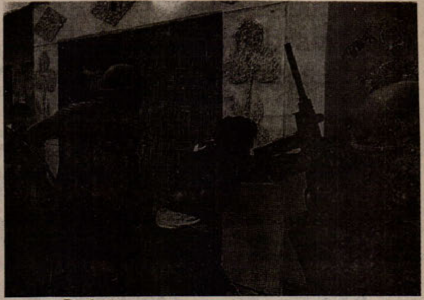
Darbeden sonra halk üzerindeki baskılar artıyor.

Esas olarak PKP'nin iktidara yürüyüşünün önüne set çekmek için yapılan fa-