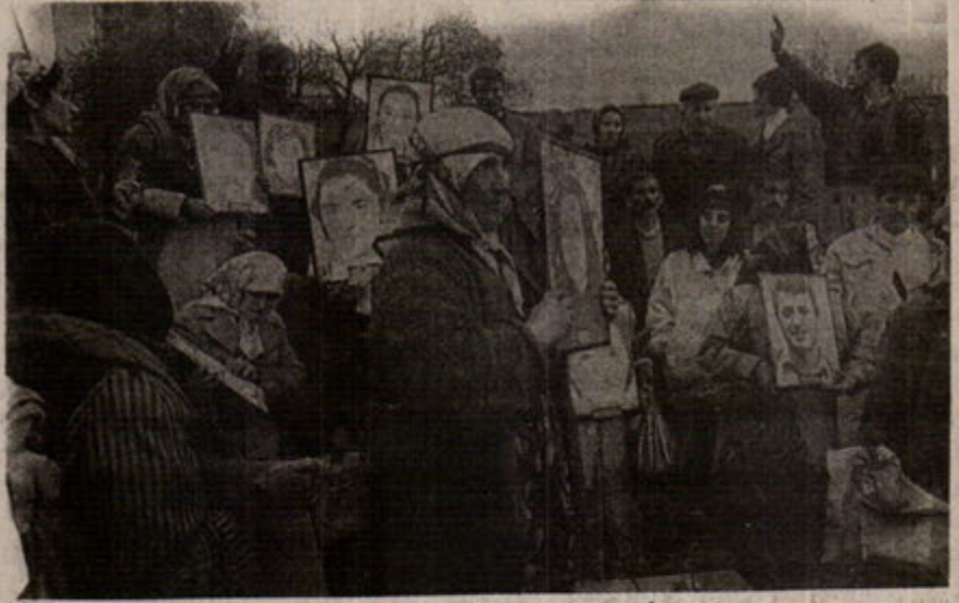
Halk devrimcileri bağrına bastı.

Komünistleri ve devrimcileri haltan tecrit eteme, marjinalize etme politikasının üzerinde ısrarla duruyorlar. "Anti terör yasası"yla bu alanda açtıkları sistemli savaş bugüne değin istikrarı sağlama gayretlerinin en önemli halkası olarak kabul görüyor. Bu yüzden, moral üstünlük elde etmek, psikolojik hakimiyet sağlamak amacıyla yoğun bir yalan, iftira demogoji kampanyası yürütüyorlar. Bütün iletişim organları aracılığıyla temsilcileri ve yandaşlarının ağzından, kaleminden dökülen her cümle bu amaçla kullanılıyor. Düzenin bütün savunucuları, kendileri-