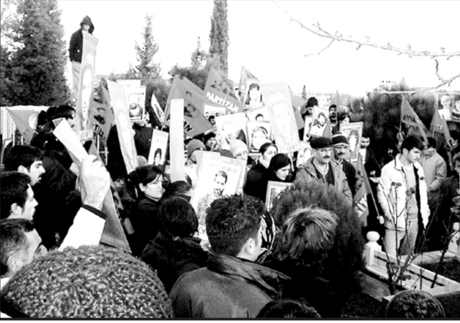
Baştarafı sayfa 32'de