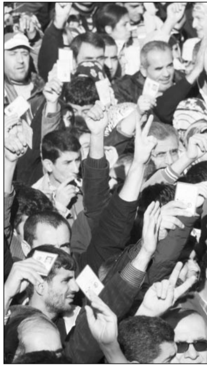
resmi makamların başta DTP'li vekiller olmak üzere PKK üzerinden bütün kinlerini kustugu Kürt halkı da yaşanan

Sınırotesi operasyon kararının alınmasının hemen ardından devletin bütün