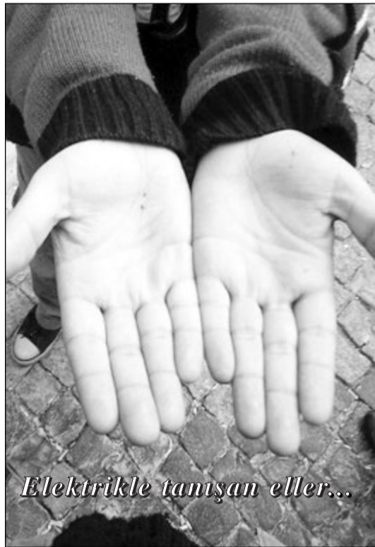
Elektrikle tanışan eller...

Afganistan, Lübnan, Suriye, Somali, Nijerya, Filistin, İran ve Irak... Farklı insanlar, ortak paydalar. Geldikleri yerin acısını çekmekteyse diasporada sığınacakları kamp ve alacakları birkaç kurşun yaşamak için kâfi olacağını düşünüyorlar. Böylesi tehlikeli bir yolculuğa çıkmalarını sağlayan nedenleri kendi deneyimlerimizden az çok çıkarabiliyoruz. Suriye'den gelen bir mülteci " berbat " bir durumda olduklarını söylüyor. " Yaşam güvencem yok " diyor. İzmir'e ilk geldiği günlerde polisin sabaha karşı bir kuşluk vakti yaptığı baskın sonrası yabancılar şubesinde çekitliklerinin ardından, kaldığı otele parasının ve giyeceklerinin çalındığını anlatıyor. Para