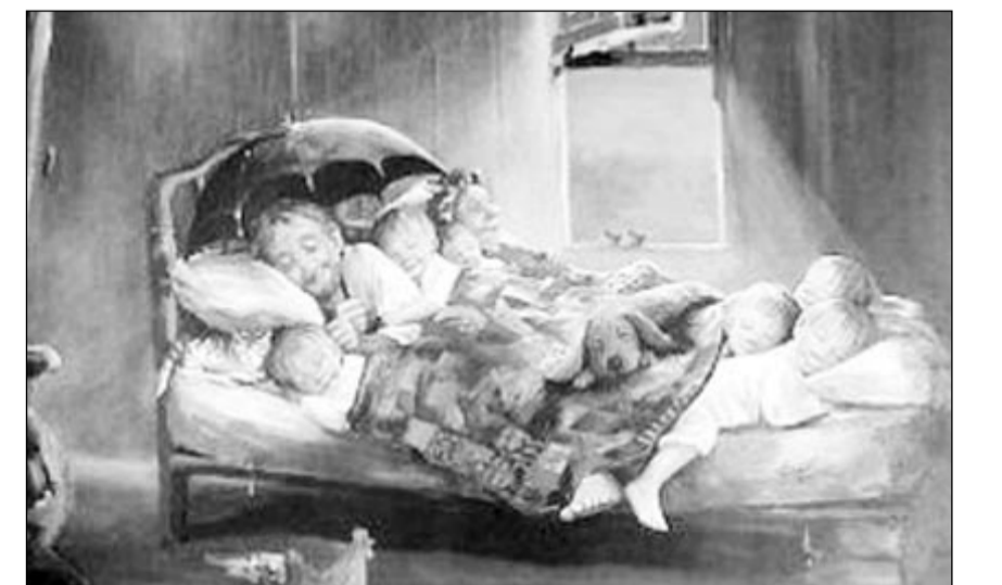
Abidin Dino'nun olarak bilinen yukarıdaki tablo kendisine ait değildir...

Fransa, Cezayir, Amerika gibi değişik ülkelerde sergiler açtı. Fransa Plastik Sanatlar Birliği Onur Başkanlığı, New York Dünya Sanat Sergisi danışmanlığı gibi görevlerde bulundu.