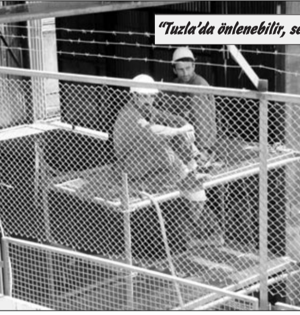
"Tuzla'da önlenebilir, seri ve ölümlü iş kazaları yaşanıyor: Neden?"

celemelere ilişkin ilk verileri kapsıyor.