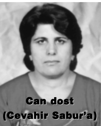
Can dost (Gevahir Sabur'a)

Sen ve ben doğmadan önce özgürlük tohumları Dersim'in topraklarına atılmıştı. Büyüdüğümüzde bir baktık ki Munzur'un Kardelenler ve Nergizler kol kola girerek mesken eylemişlerdi. Sen daha küçükken bile kır çiçekleri Munzur'un her tarafını