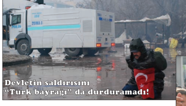
Devletin saldırısını "Türk bayrağı" da durduramadı!

Eski Maliye Bakanı Kemal Unakıtan'ın "Babalar gibi satırım" dediği TEKEL'le Philip Morris-Sabancı, British American Tobacco, Japon Tobacco International (JTI) ve CTNC gibi şirketlerin