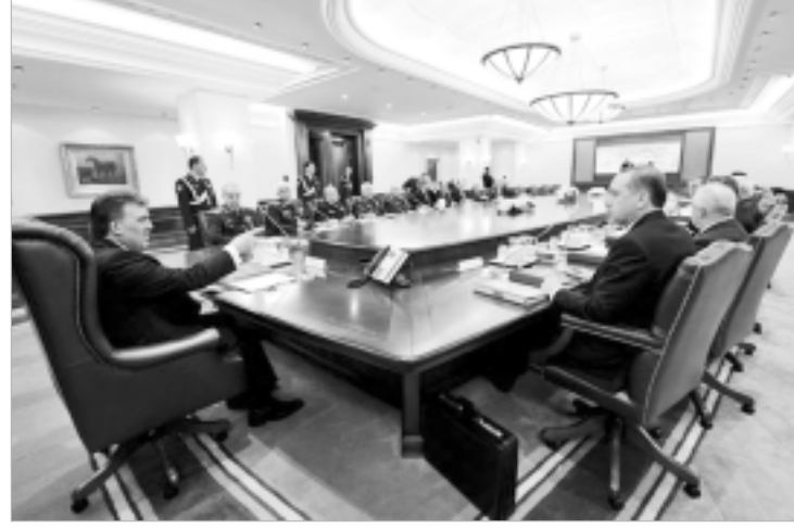
MGK toplantısından yansıyan bilgiler arasında yer alan "Terörle Mücadelenin kararlılıkla sürdürüleceği" açıklamaları, bu yaklaşımı doğrulamaktadır.

Toplantının esas ve en önemli gündemi de budur. Ancak bu yanının manipüle edilerek, gözlerden kaçırılmaya çalışıldığı da bir başka gerçekliktir. Yani uzunca süredir hâkim olan toplumdaki yansıma yaratma çabaları bu gündem özgülünde de devam et-