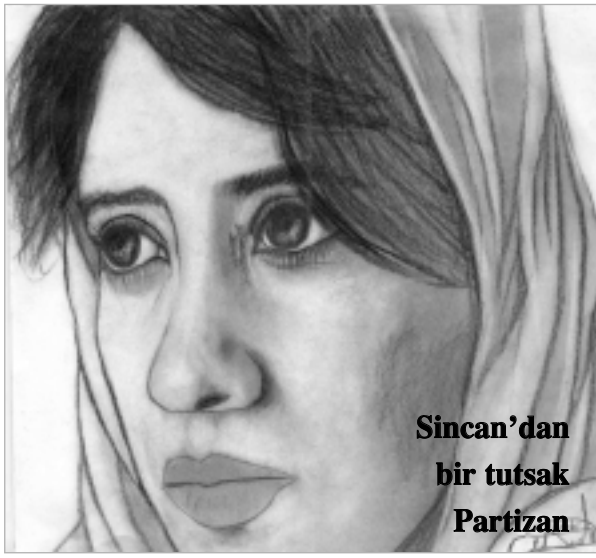
Sincan'dan bir tutsak Partizan

Sanat üretiminin kendine özgü bir üretim niteliği olduğu gibi (bu, örgütlü mücadele içerisinde de böyledir) sınıfsal niteliği de vardır. Bizim kıstas aldığımız, sınıfsal niteliği dir. Sınıf mücadelesi yekpare bir biçimde gelişmez, yaşanmaz. Bunun ideolojik, siyasal, askerî yönleri olduğu gibi sanat, kültür içeren yanları da vardır. Bunlardan anndırılrsa sınıf müca-