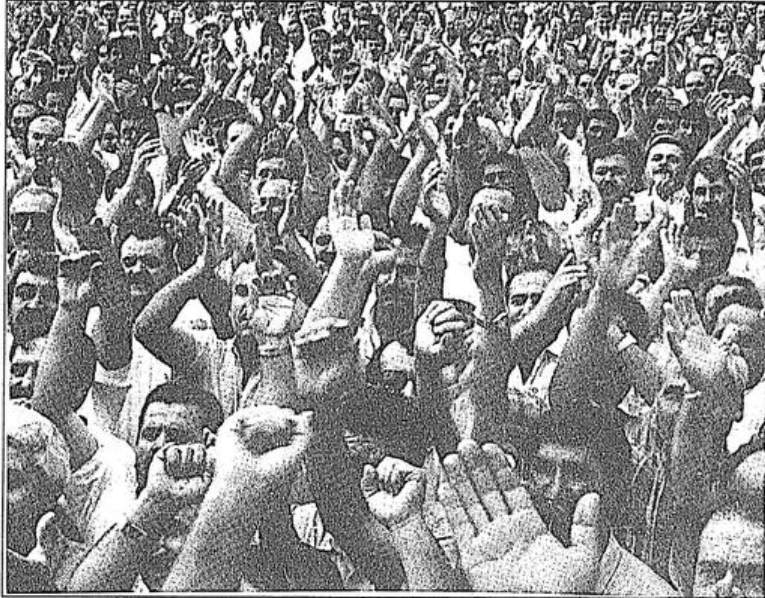
Bu pisliğe "Temiz Eller Operasyonu" değil, bu ellerin kudreti gereklidir.