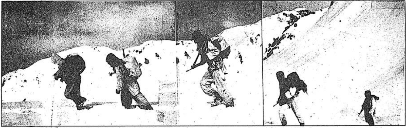
Dünyanın en güzel resmini yaratana kadar yürüyecekler...

yoldaşlar "Önümüzdeki birçok köyde düşman var" dedi. Güneş atımıyla birlikte yeniden başladı kavga. Bu kez karşı koyamadık, düşman rastgele tarıyordu dağları. Uçaklar ve helikopterlerin vizitisi kulak çınlatıyordu. Rüzgar izimizi kapatmıştı. Öğleden sonra düşman, boşa çıkan ope-