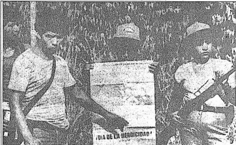
Faşist Peru rejimi PKP'yi durduramıyor.