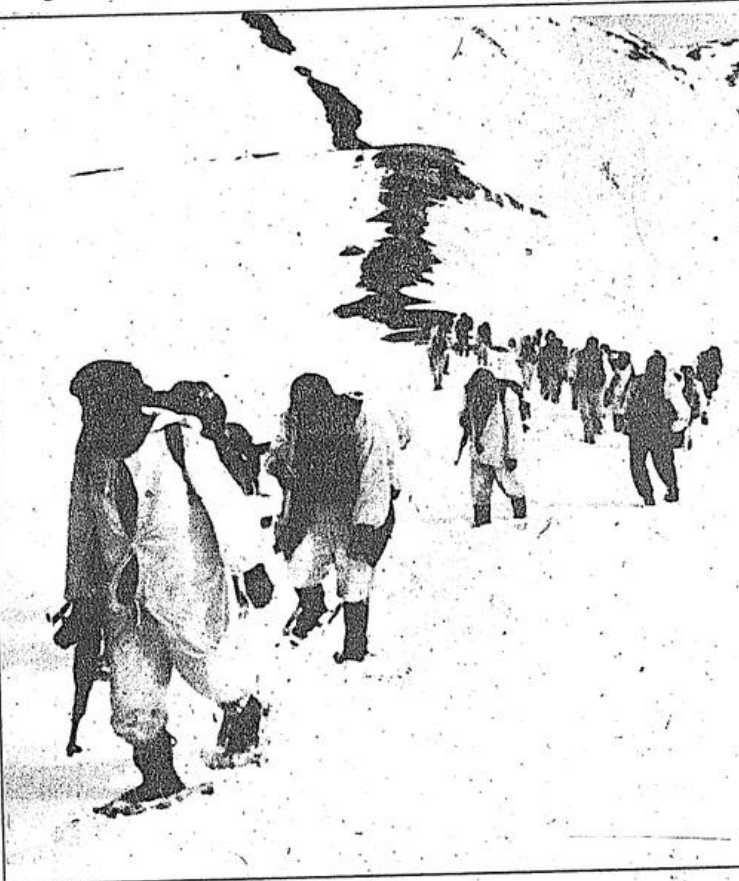
Yürek ateş, kavgaya ateş, neyler ki kış?

Ve alınan karar kavgamızı dağlarda sürdürerek dağıtma, diğer muntıkadakilere ulaştırma. Göç dizildi dağlara, son hazırlıklar yapıldı. Birçok yoldaşın durumu iyi değildi. Birlik kalabalıktı ve ağ-