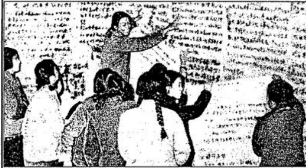
Dazubao'lar ve siyasette aktif kadınlar kültür devriminin iki simgesiydi (Dazubao: Çin Kültür Devrimi sırasında halkın kullandığı duvar gazetesi)

İK, Seçme Yazılar I, Sayfa: 15-16 Umut Yayınları