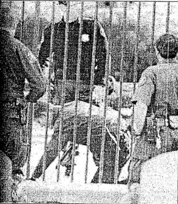
Beyaz Saray tarandıktan sonra olaya CIA müdahale etti

ğı açıklandı. Beyaz Saray Genel Sekreteri Le-on Panetta ise, gece düzenlediği basın toplantısında, "Saldırıda hiçkimse yaralanmamıştır. Clinton iyidir ve programında hiçbir değişiklik yapılmayacaktır." dedi. Panetta'nın Clinton'un programında değişiklik yapılmayacağını vurgulu olarak ifade etmesi dikkat çekti. Yaklaşık 6 hafta önce, alkolik bir pilot Cessna tipi bir uçakla Beyaz Saray'ın bahçesinde çakılmıştı. Olayların rastlantı olmadığı ve ABD'nin özellikle Ortadoğu'ya yönelik dış politikalarına bağlı olarak geliştiği tahmin ediliyor.