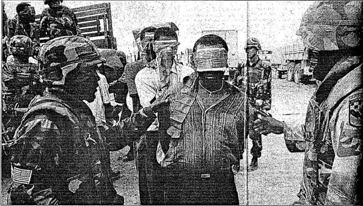
ABD askerleri, Haiti'ye ayak basar basmaz ilk iş olarak halkın muhalefetini bastırmaya çalıştılar. İnsanlar özel göz bağcıklarıyla CIA merkezlerine götürülerek sorgulanıyor.