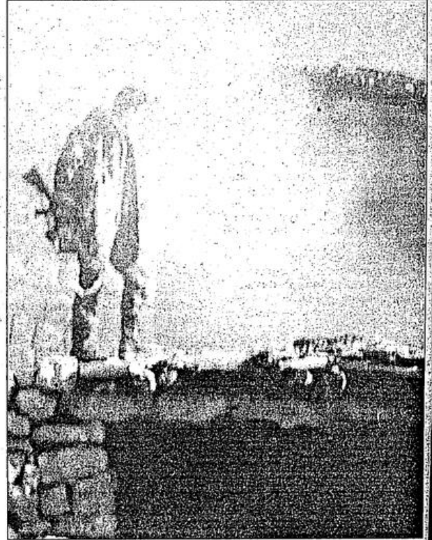
Faşist Türk ordusunun bir askeri, Dersim'de "vatani görevini" yaparken

"4 Ekim günü askerler bütün köylerin etrafını sarmış ve birçok köyü basmıştı. Bu baskılar devam ederken, 5 Ekim akşamüzeri askerler ormanları yakarak köye indiler. Bizim evin önüne gelince sana 10 dakika müddet evi boşalt yakacağız dediler. Ben niye yakıyorsunuz dedim. Ben evimi boşaltmıyorum dedim. Askerler de 'yukardan emir geldi dağ köyleri yananak' dediler ve mezrada bulunan 6 evden 3'ünü yaktılar. Halkı dışarıya çıkardılar tarlada topladılar ve eşyalarını dahi almaları-