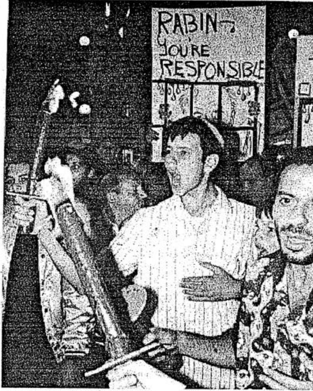
Tel Aviv'de otobüsün bombalanması üzerine gösteri yapan Siyonistler, bombalama olayından Rabin'i sorumlu tutular

Clinton'un Suriye ziyareti öncesi HAMAS'ın böyle bir eylem gerçekleştirmesi tesadüf değil. Bu eylemden sonra İsrail ve Ürdün'ün yaptıkları anlaşmaları açıkça ilan etmeleri de tesadüf değil. Ortadoğu'da emperyalistler arası hesaplaşmaların daha da kızışması beklenen bir olgu olarak dikkat çekiyor.