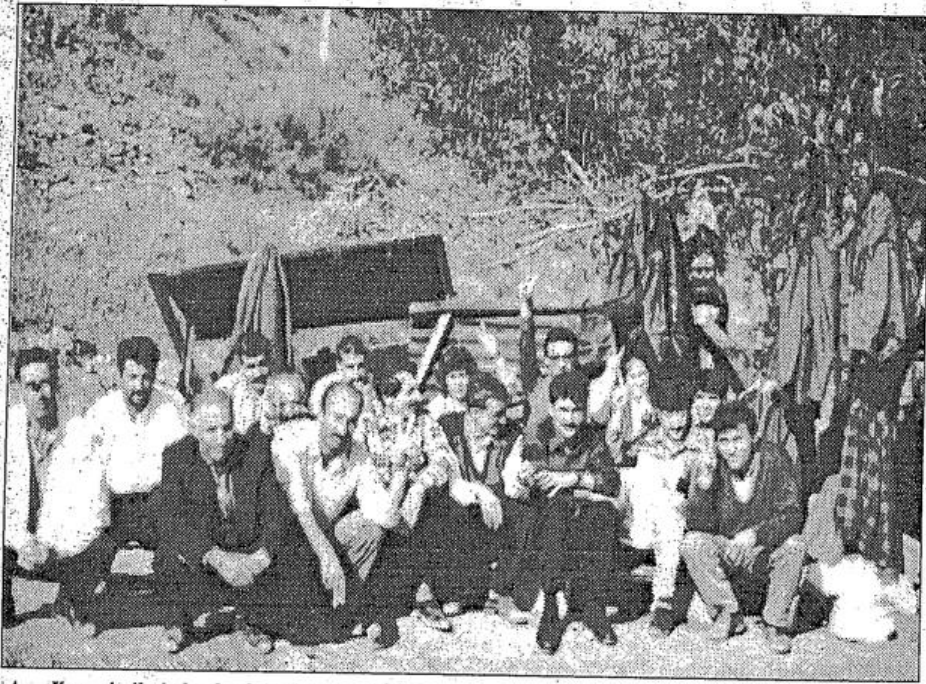
Aras Kargo işçileri almakta kararlı görünüyor

İstanbul/Özgür Gelecek İşçi sınıfımızın geçen yüzyılın ikinci yarısından beri yoğun bir şekilde sürdürdüğü hak arama mücadelesi sayılı eylemlerle aktif bir şekilde devam ediyor. Son süreçte 12 Eylül'e işbaşına gelen cunta yönetimi faşizan uygulamaları sınıf savaşımını engellemeye çalışmıştır, bunu başaramadığı da söylenemez ne var ki son yıllarda Türkiye'de yükselen devrim mücadelesi köylülüğün ve işçi sınıfının tekrar uyanış ve ayağa kalkışına sahne oluyor. Doğuda köyler kaynıyor, sanayi şehirlerinde işçilerin sendikalaşma mücadeleleri yükseliyor. Ve bunlardan biri olan Aras Kargo işçileri ise kararlılığı ve sınıf bilincini giderek yükselttikleri sınıf mücadelesini ilettiliyor. Aras Kargo işçisi siyasi baskı ne kadar yoğun olursa olsun sömürüye baş eğmeyeceğini göstermekte kararlı.