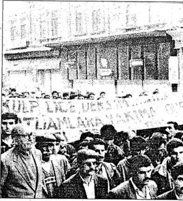
Sirkeci Postanesi'nin önünde toplanan bin beş yüz kişi "Dersim Faşizme Mezar Olacak!" sloganını attı

Ote yandan 29 ekim günü, saat 16:00'da Sirkeci Postanesi'nin önünde çeşitli ilericiler kurumu ve kuruluşlarından bir basın açıklaması yapıldı. Yaklaşık bin beş yüz kişilerin katıldığı basın açıklamasında HADEP İstanbul İl Örgütü, Tunceli Kültür Ve Dayanışma Derneği, Pir Sultan Abdal Kültür Ve Tanıtım Derneği, Pir Sultan Canlar Derneği