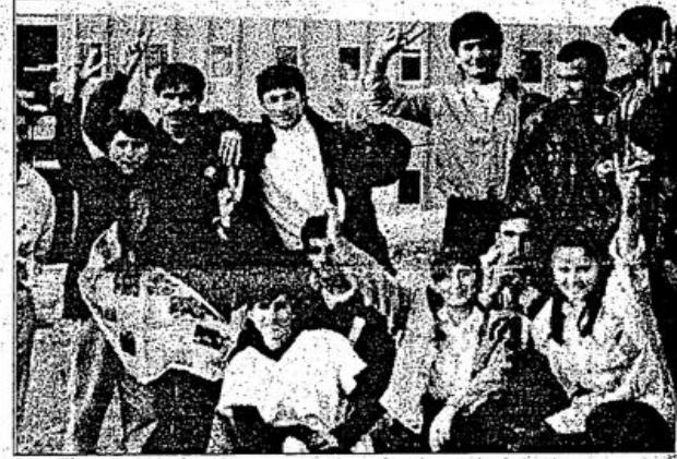
CEMTAŞ işçileri "Ya kazanacağız, ya kazanacağız" diyor

Yaklaşık bir haftadır jandarma ablukası altında direnişleri devam eden işçiler eylemin ilk günü eylem komitesini oluşturduklar. Direnişin ilk gününde akşam üzeri fabrikanın