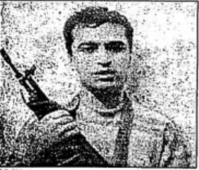
Otobüsü uçuran Hamas militanı

HAMAS, 10 gün önce bir İsrail askerini kaçırmış, daha sonra asker cesedi bulunmuştu. Bu sırada Ürdün ve İsrail el altından anlaşmalar yapıyorlardı. Fakat anlaşmanın kutlaması