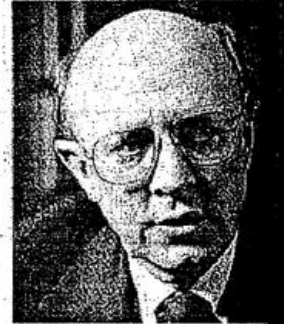
CIA şefi James Woolsey, Woolsey, amaçlarının insan haklarını korumak olduğunu savunuyor.

Oysa, CIA'nın Haiti'deki geçmişi de, faaliyette bulunduğu tüm yerlerdeki geçmişi kadar kirli. Haiti'de 1986'da Jean Claude Duvalier (nam-ı diğer "Baby Doc") diktatörlüğünün çöküşünden sonra, CIA, Haiti istihbarat servisi SIN'ı kurdu. Bu servis, görünüşte uyuşturucu ticareti ile mücadele için kurulmuştu. Ama nedense uyuşturucu tüccarlarıyla en sıkı işbirliği