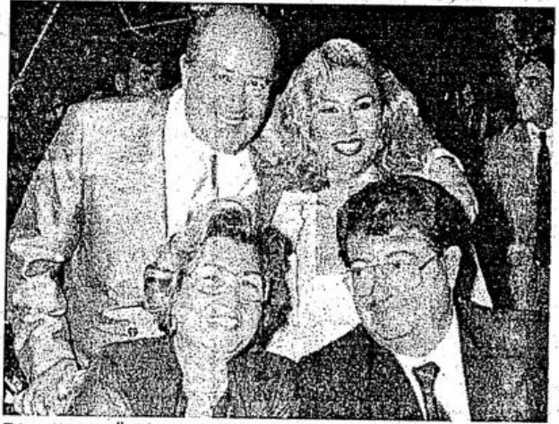
Edes ailesi ile Özal ailesinin mutluluk tablosu sanki, halkın gözüne baka baka ne yapalım bu işler böyle oluyor der gibiler.

Yine geçmişte olduğu gibi suçluların cezasını suçlular verecek, tabii bu ceza nasıl bir ceza olur artık siz