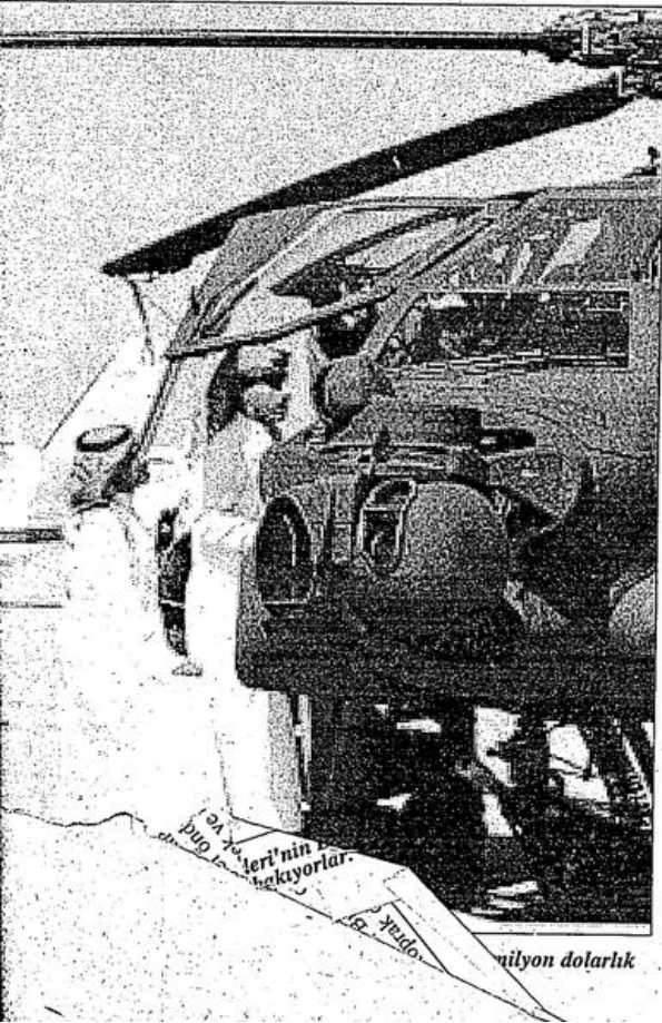
100 milyon dolarlık