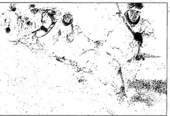
Haksız bir savaşın içerisinde sürüklenen ve ne için savaşta bilmeyen TC askerleri, halk savaşçılarına karşı çaresiz ve yenilmeye mahkum.

Şu günlerde halen süren operasyon adına ne derlerse desin, ne kadar sayıda asker, özel tim korucu katarlara katınsın, omla etkinliği ve hükmü bir yere kaadır. Ve bu hüküm-fermanlar gerilla karşısında hükümsüzdür Zira halk ordusu neferleri, direnişçi halkın "ferman-padişahın dağlar bizindir" sözünü düstü edinmişlerdir. Ve yaşama geçirdikleri de budur. Gerilla savaşını bitmesi için halkın bitmesi gerekir bu da mümkün değildir. Faşist komprador patron-ağa devleti de bunu yaşayarak görecektir.