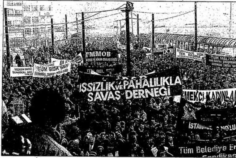
Devletin tüm tehditlerine ve kötü hava koşullarına rağmen, 20 Aralık günü, tüm Türkiye'de meydanlar emekçilerle dolup taşı.

□ Yüzbinlerce kamu çalışanı grevli, toplu sözleşmeli sendikal hakları, savaşırsız, sömürsüz, özgür, demokratik Türkiye için ve 1995 bütçesini, ücretlerin dondurulmasını protesto için 20 Aralık'ta hizmet üretimini durdurdular.