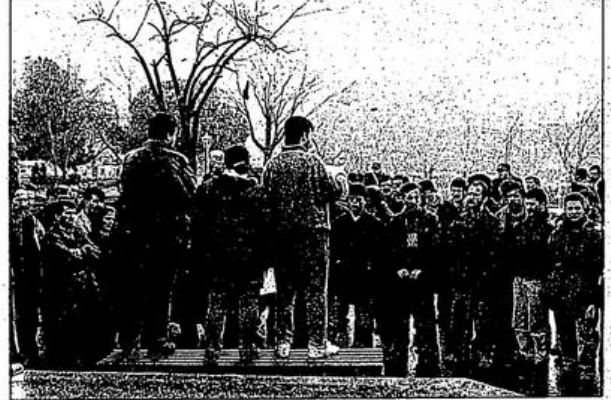
Tarihe adını Maraş Katliamı diye geçiren, yüzlerce insanın ölümüyle sonuçlanan katliam, 15. yılında çeşitli etkinliklerle protesto edildi.

EKB adına yapılan basın açıklamasında da, faşist diktatörlüğün dün Maraş, Sivas, Çorum, Elazığ, Malatya'da MIT- CIA- Kontrgerilla tarafından gerçekleştirildiği provokasyon ve katliamları bugün yine gündeme getirdiği, emekçilerin yoğun olduğu yerlerde sivil faşistleri örgütlediği belirtilerek, "Devletin