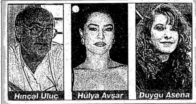
Kadın sorununu cinsellik boyutuna indirgeyip, çarpıtmalarla kendi reklamlarını yapıyorlar.

Feminizm kadınların insanlığın varoluşundan bu yana, bütün toplumsal süreçlerde erkekler tarafından ezildiğini ve horlandığını söyler. Ve buna karşı mücadelede aktif görevin kadınlara düştüğünü savunurken kadının varolan bu durumundan kurtuluşunun ancak ve ancak erkeklerle karşı verilecek radikal kadın hakları savunuculuğuyla elde edileceğini belirtirler. Feminizm, kendi arasında farklılıklar gösterir. Sosyalist feministler, eşitlikçi feministler ve radikal feministler. Bu üç ayrışım öz itibarıyla ayrılık ifade etse de yöntemde bazı farklılık taşır.