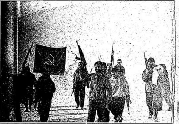
Gücünü halktan alan halk savaşçıları haklı olmanın getirdiği güçle dimdik ayakta...geliyor...güçleniyor.

Egemen sınıfların usak basın kuruluşlarının da şaşakladığı "bü-