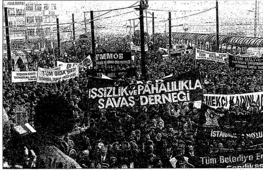
Eğemenler her türlü tehditine rağmen, yüzbinlerce memur iş bıraktı, onbinlercesi de alana çıkarak tehditlere meydan okudu.

Hakim sınıfların tehdidi sökmeydi. 100 binleri aşan katılım karşısında hakim sınıflar geri adım atmak zorunda kaldılar. Tabii, tüktürdüklerini yalamadıklarını kanıtlayabilmek için memurlar hakkındaki idari soruşturma başlattı. Ayrıca Malatya Valisi'yi kenarını "Bedük Cumhuriyeti"ne çıkartan, tüm geriçi kurumlaşmayı yaratan, devrimci-demokratik tüm oluşum ve etkinliklerin düşmanı, şimdinin Kayseri Valisi Saffet Arıkan Bedük, "azizliğini" burada da göstererek