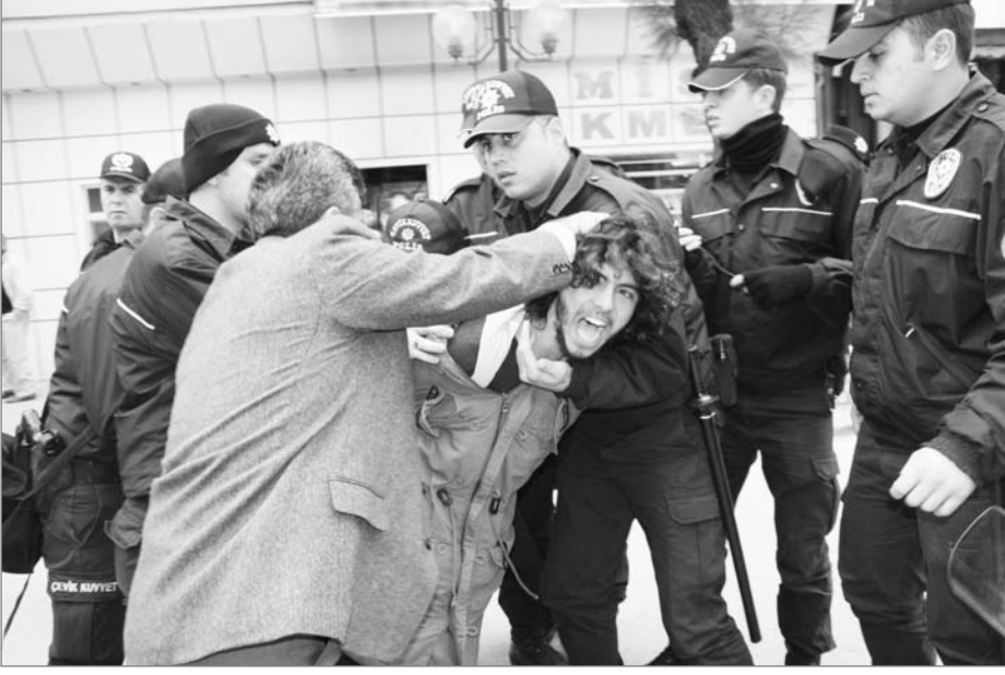
"Daimi ordu ve polis, devlet erkinin esas silahlarıdır..." (Lenin, Devlet ve Devrim, İnter Yayınları, Sf: 18)

Lenin, Devlet ve Devrim adlı kitabında devletin silahlı gücünü böyle tanımlıyordu. O günden bugüne neredeyse bir asır geçmesine karşın, devlet ve silahlı gücüne dair onlarca teori üretilmesine rağmen, Lenin yolunun tanımlaması güncelliğini koruyor. Gezi İsyanı'nda devletin polis gücüyle estirdiği terör ve Erdoğan'ın "polisimizi daha da güçlendireceğiz" söylemi ekstra kanıt sunmaya gerek bırakmıyor.