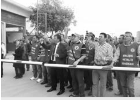
Kartal: Gebze'de ve Düzce'de faaliyette bulunan M&T Rek-

lam'da sendikalı oldukları için işten atılan işçiler 27 Mayıs günü Gebze'deki fabrika önünde eylemlediler. Direnişin 14. gününde işçilerle birlikte açıklama gerçekleştiren Birleşik Metal-İş Sendikası'nın eylemine aralarında Devrimci Demokratik Sendikal Birlik'in de (DDSB) olduğu çok sayıda kurum destek verdi. İş çıkışı saatinde gerçek-