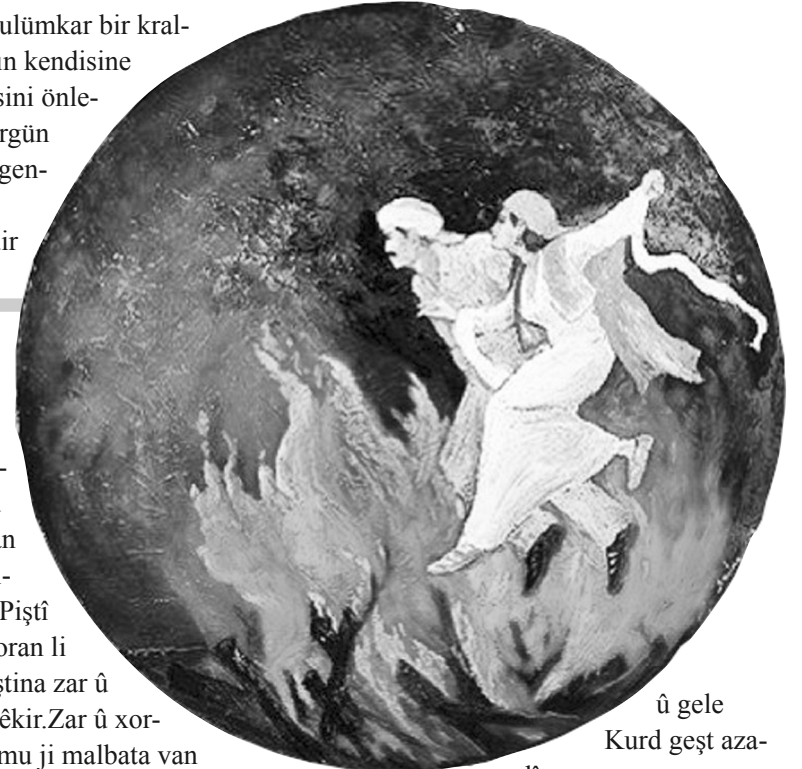
û gele Kurd geşt aza- dîya xwe.

.Böylelikle yılanlar kendisine zarar vermemektedir. Aynı zamanda bu zalim kral ilkbaharın gelmesini de engellemektedir. Zalim Dehak'ın bu zulümüne karşı bir şeyler yapmak isteyen Armayel ve Garmayel adlı iki kişi bir yolunu bularak sarayın aşçısı olarak sarayda çalışmaya başladılar. Ve Kralın yılanlarını beslemek için beyinleri alınarak öldürülen çocuklardan sadece birini öldürüp, diğerinin gizlice saraydan kaçmasına yardımcı olurlar. Böylece ellerindeki bir insan beyni ile kestikleri bir koyunun beynini karıştırarak yılanlara vererek her gün bir çocuğun kurtulmasını sağlamış olurlar. İşte bu kaçan kişilerin Kürtlerin ataları olduğuna inanılır. Zalimin elinden bu şekilde kurtulan çocuklar, gizlice Demirci Kawa önderliğinde eğitilerek bir ordu haline gelir ve 20 Mart günü saraya baskın düzenler. Bu baskından Demirci Kawa komutasındaki birlik zaferle çıkar. Zalimin zalimliği biter. Ve özlenen bahar da gelmiş olur. Demirci Kawa Kürt coğrafyasının Spartaküs'üdür bir anlamda.