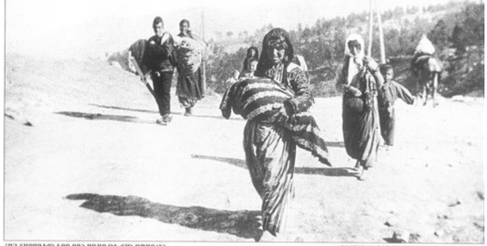
ՀԱՅ ՏՐՊԻՆՆԵՐԸ ԹԵՂԵՂՆԵՐԻՆ ԳՆԱԿՈՒՄԻՆ, ՏԵՐՔԵՐԸ, 1915Թ. АРМЯНСКԻԵ ԵՂԻՄԱՆՆԻԿԻ ԻՆ ԴՄՄԻ ԴԵՊՈՐՏԱՆԻՆ, ԺԿԱՐԱԼՅՍ, 1915Թ.

Ermeni Soykırımı ile ilgili tarihsel ayrıntılara bakmak meseleyi belli başlı noktaları ile netleştirecektir. 1908'lere gelindiğinde Osmanlı İmparatorluğu içerisinde süren ekonomik ve yapısal çelişkiler hiyerarşik yapılanma