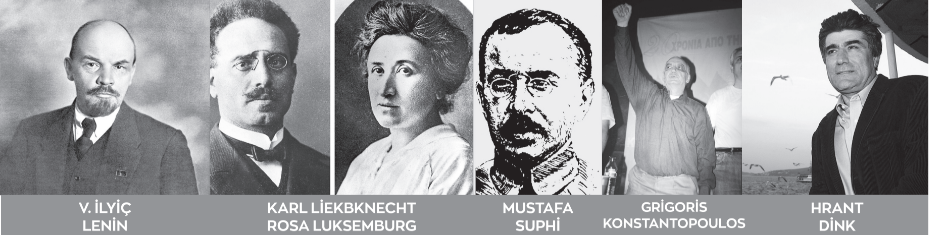
V. İLYİÇ LENİN