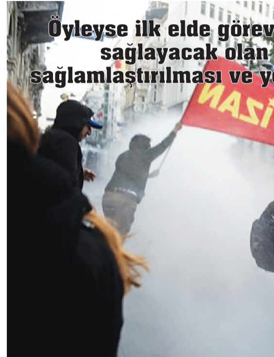
Öyleyse ilk elde görev sağlayacak olanı sağlamlaştırılması ve y

Ülkemiz özgülünde ise Gezi/Haziran İsyanı ve devamındaki gelişmelerin işaret ettiği politik koşullar yeterince görülebilmiş, buna dönük hazırlık yapılamamıştır. Kürt ulusal mücadelesinin ülke politik koşullarına özel etkisi altında devletin geliştirdiği kapsamlı saldırı politikası görece uzun bir zaman bilince çıkarılamamıştır. Etkisi ve kalıcılığı boyutuyla taktik politikaları aşan bir biçimde devrimci-demokratik güçlerin legal demokratik alana hapsedikleri ve bu mücadele biçimlerini esas aldıkları bir gerçektir. Süreçte parlamento ve seçimler özel bir yer tutsa da asıl kırılmanın devrim iddiasında, politik iktidar bilincinde ve buna bağlı olarak özel bir önem kazanan örgüt ve örgütlenme biçimlerinde yaşandığını söylemek gerekir. Hangi biçimiyle olursa olsun iç savaş gündemine almayan, avantajlı koşullarda buna hazırlanmayan, buna uygun olarak örgütlenmeyen her yapı kaçınılmaz olarak ideolojik savrulmalara ya da fiziki tasfiyeye maruz kalmış durumdadır.