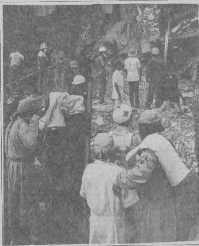
Halkların başındaki esas felaket deprem değil emperyalist sömürü sistemidir.

Clinton ise son şansını denemek-te. Bugünlerde yoğun olarak bin-lerce ABD askerini daha Somali'ye göndererek Bush'tan sonra "2. Körfez Fatihisi" sıfatını almaya çalış-ıyor. Böylece daha rahat talan ya-parak dışarda ABD'nin diğer em-peryalist rakiplerine karşı kozlar el-de etmeyi ve içeride kendisinin oy potansiyelini sağlamlaştırmayı dü-şünüyor.