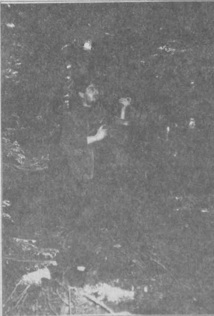
"...bir gerilla için eylem anındaki dikkatsizlik ve kafa karışıklığı ölüm demektir"

Bir ay sonra kaybolan klavuz yine aynı bölgede milis vasıtasıyla birliğine kavuşmuştur.