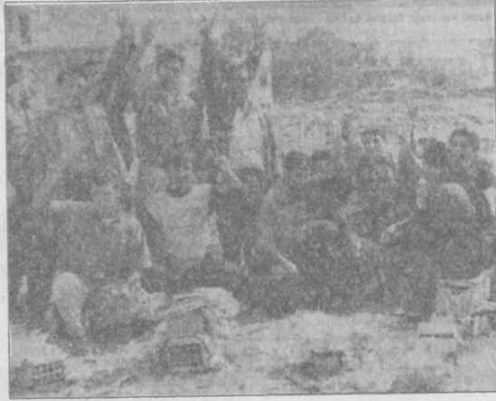
İşçiler, teslimiyetin mücadelesini yıkıntıya uğratacağını kavrayarak hareket ediyorlar.

Yaptıkları toplantılarda arkadaşlarına sendikadan ne olduğunu anla-