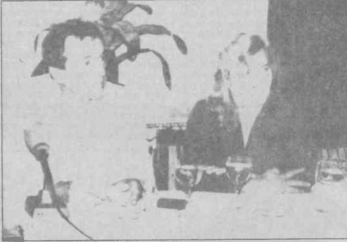
Costa Gavras: "Özgürlükleri için savaşım veren kişilere her zaman sempatiim olmuştur."