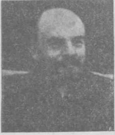
V. İ. LENİN