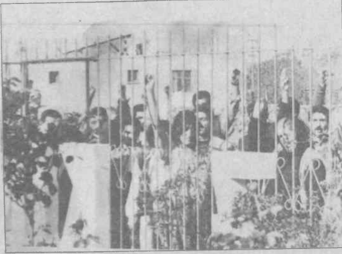
4 Karanfil'in katilleri, er ya da geç halkın adaletine hesap vereceklerdir.