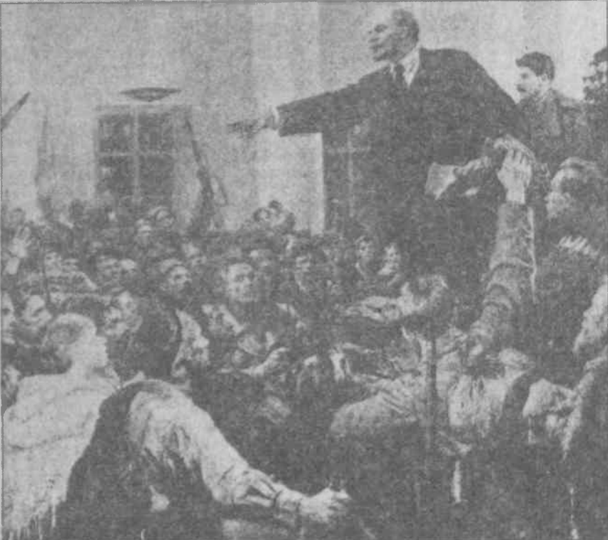
Lenin: Rusya penceresinden Enternasyonal proletaryanın iktidar yolunu açtı.

Afrika'da ve Balkanlarda yenilgilere sebep olduğu için Yüksek Faşist Konsey'ce 24 Temmuz 1943'te görevden alındı.