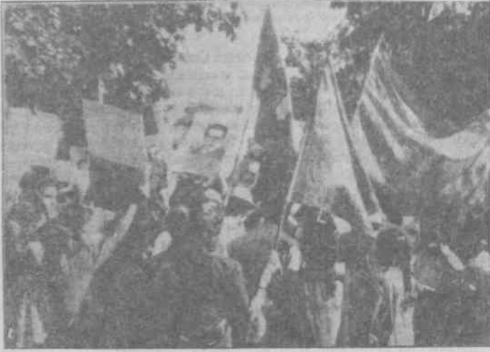
24 Eylül, Yeni Delhi'de Gonzalo'yu sahiplenen Nepalli kadınlar Peru büyükelçiliğinin önünde faşist Peru rejimini protesto ederken.

Meksika'nın başkenti Mexico City'de, 9 Eylül günü, Dr. Abimael Guzman'la ilgili bir radyo programı yapıldı. 13 Eylül'de ise geniş katılımlı bir kitle gösterisi düzenlendi. Almanya'nın Berlin, Köln ve Hamburg kentlerinde Abimael Guzman ve Peru'daki siyasi tutsaklarla dayanışma gösterileri ve toplantıları düzenlendi. Guzman'la