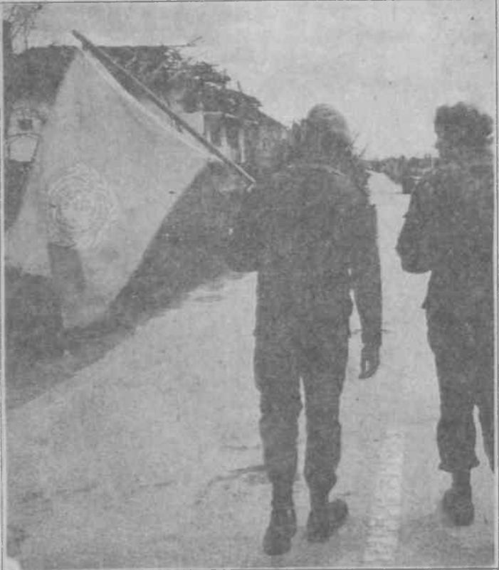
BM'nin "Barış Melekleri" fuhuşun, karaborsanın sorgunun ve usakların bayrağını taşıyor.

IRA, İngiltere hükümetine götürdüğü öneri paketinde İrlanda halkının kendi kaderini tayin hakkını istiyor. Halkın kendi kaderini tayin hakkı istenmez, alınır. Çünkü bu hak, çağımızın özelliği gereği bir proleter devrimi yapma hakkı demektir. IRA ulusal temelde yükselmekte, halk arasındaki Katolik-Protestan çelişkilerine yanlış yaklaşmakta ve emperyalist İngiltere hükümetiyle uzlaşmaya çalışmaktadır. Patlayan bombalar ise silahlı pazarlığın göstergesidir.