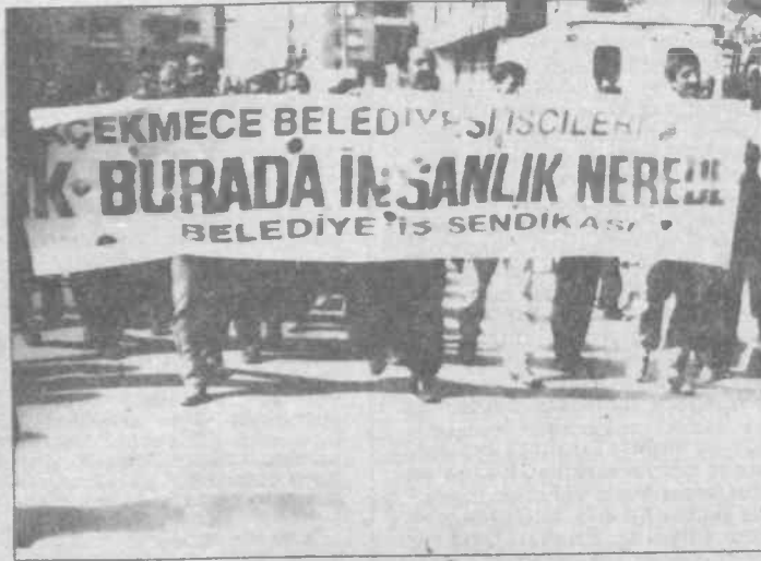
Yalana, dolana ve tüm sahtekarlıklara rağmen Küçükçekmece işçileri coşuklu yürüyüşüne devam ediyor.

Eylemin hazırlıkları yapılırken 30 Eylül tarihli Bugün gazetesinde şöyle bir haber çıktı. "Patron çöpler saltanatına son". Böyle bir