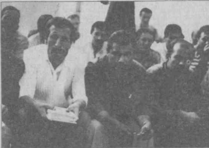
Porland direnişçileri işe geri alınmaya kadar mücadeleyi sürdüreceklerini söylüyorlar.

Sağlığı süratle bozulan işçilerin pek çoğu bu koşulları değiştirmek istemiyor. Karşı çıkarsam işten atılırm diye korkuyordu. Ancak iki işçinin atılmasıyla kabaran öf-keleri ile başlayan direniş onlara güçlerini gösterdi.