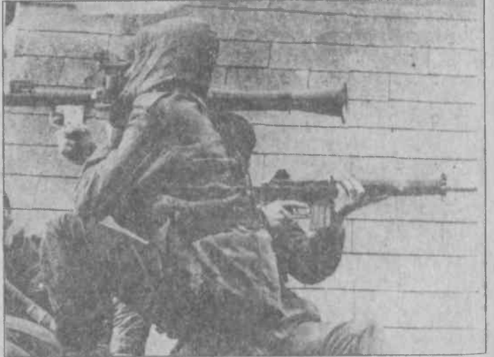
IRA'nın silahları pazarlık için konuşuyor.

Haber Merkezi- Kuzey İrlanda'nın bağımsızlığı için mücadele eden İrlanda Cumhuriyet Ordusu'nun (IRA) yasal kolu olarak tanınan Sinn Fein'in lideri Gerry Adams, "Cumhuriyetçiler olarak çözüme ulaşmak konusunda istekli ve hazırız. İngiliz hükümetinden istediğimiz, kendilerinin de bu şans iyi değerlendirip olumlu bir girişimde bulunmalarıdır. Aksini yaparlarsa bu sonu olmayan çatışmaların sorumluluğunu üstlenmiş olurlar" dedi. Adams'ın, milliyetçi çizgideki Sosyal Demokrat İşçi Partisi (SDLP) lideri John Hume ile 5 aydır devam eden gizli görüşmeler yaptığı ve ikisinin beraberce bir öneriler paketi hazırladıkları ortaya çıktı. İngiliz ve İrlanda hükümetlerine sunulan söz konusu paket IRA'nın ateşkes koşullarını içeriyordu.