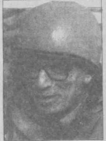
Butros Gali kimliğine uygun kıyafetle sahnedir.

bir değişiklik yok. Kendisi, 1 yıl önce Somali'de aşıktan 300.000 kişinin öldüğünü ve bugün tek bir kişinin bile aç olmadığını sık sık ve büyük bir utanmazlıkla vurguluyor. Gali iki nedenden ötürü yalancıdır: Birincisi, Somali halkını aşıktan ölüme mahkum eden bizzat Ga-li'nin emperyalist efendileridir. İkincisi Somali halkının büyük ço-ğunluğu hâlâ açtır. Belki aşıktan ölenlerin azaldığı doğrudur ama halkın hedef gözetilmeksizin roket-lerle toplu olarak imha edildiği de doğrudur. Gali, Aidid yanlılarıyla görüşüp onu safdışı etmekten yana ve bu işi ülkede bulunan 4.500 ABD askerini Kongre çekmeden önce bitirmek istiyor.