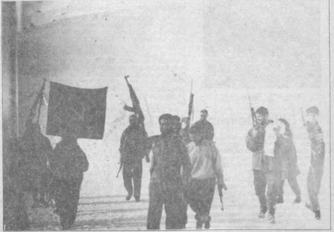
"Ölünecekse bir TIKKO'cu gibi ölmeliydi. Korkaklık ve cesaretsizlik ölüme çare değildi."

Bu arada silah sesleri çalındı kulaklarıma. Emin olmak için yanbaşımdaya yürüyen komutanı sordum, o da aynı şeyi duyduğunu söyledi. Olabilecekler bir film şeridi gibi sıralandı kafamda ve klavuzun düşman pususuna düştüğüne kanaat getirdim. Hepimizde de hakim olan buydu şimdi. Köye girmenin ne derece doğru olup olmadığı konusunda fikir yürütüyordum. Ancak kesin karar veremiyordum. Birden komutanın kesin ve kararlı bir şekildi; "köye gireceğiz" dediğini duydum. Kararsızlığımı üstümden atamamıştım. Ancak komutanın köye ne şekilde, hangi taktikle gireceğimizi hakkındaki net ve kararlı açıklaması beni bocalamaktan kurtardı. Konumlanmamız hakkındaki karara göre komutan yardımcılığı ve artçılık görevimin yanı sıra klavuzluğu da benim yapmam gerekiyordu. Bu duruma göre en önde ben gidecektim. Arkamdan komutan beni korumak için gelecekti ve diğer iki yoldaşa her hangi bir durum