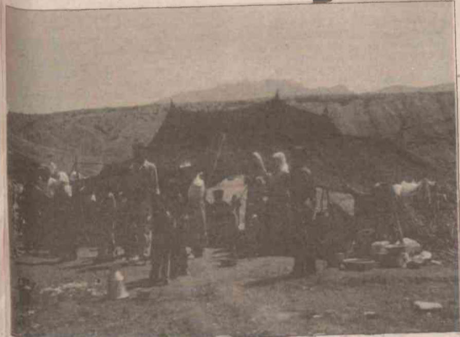
Fazlın, güçlerle ve katliamlarla alana hakim olmaya çalışsa da kaybedecektir.