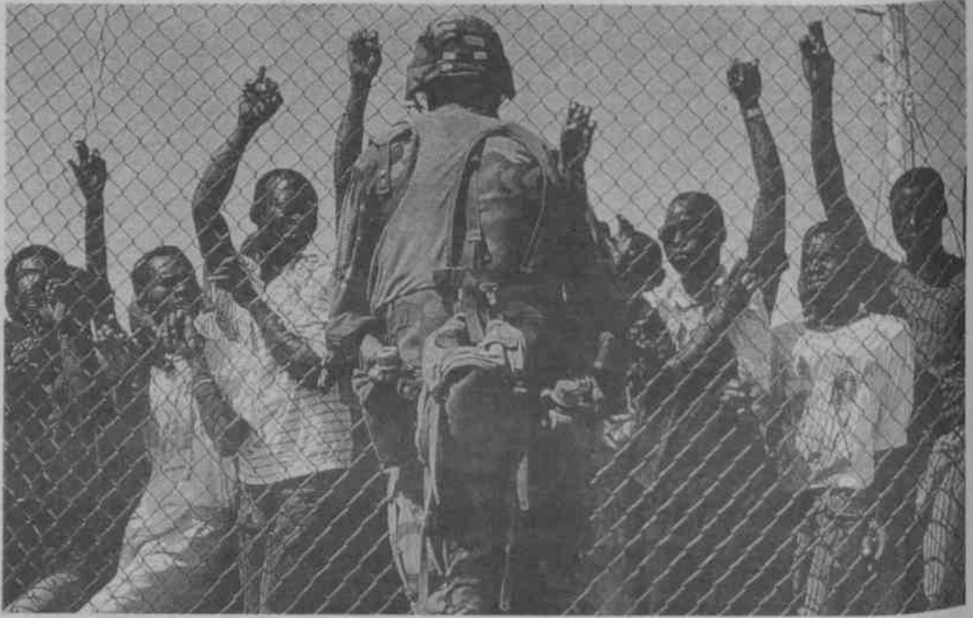
ABD, Haiti'ye "müdahale" ederek "demokrasiyi" getirdi. Böylece Haiti halkı, kendi ülkesinde esir konumuna düşürüldü.

Haiti'de bir halk muhalefeti vardı. Bu muhalefet ABD'ye ve onun uzantısı olan darbeciler karşı gelişmekteydi. Ancak gelişen bu muhalefet, Aristide'nin gerçek niteliğini göremediği için ve Aristide iktidardan darbeyle indirildiği için onu tutulmaya çalışıyor ve ne/meluda