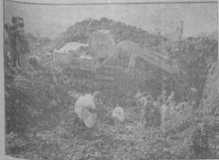
Ümraniye Hekimbaşı çöp faciası unutturulamayacak

28 Nisan 1993 çarşamba günü, yıllardır alınmayan önlemler, insanların ölümüne davetiye çıkarmış ve