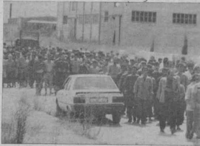
Deri işçisi, diğer sınıf kardeşleri gibi hakkını hep koparak aldı, bundan sonra da mücadele ederek almaya devam edecek

Direnişteki işçileri protesto eyleminden sonra ziyaret ettik. 13 Karaca Deri işçisi, arkalarındaki kitle desteğiyle, mutlular. Çünkü yalnız değiller. İşçilere neden sendikalı olduklarını sorduk. İşçilerin ortak düşüncesi şu: "Bizler 600-700 bin liraya haftalık çalışıyoruz. 1 seneye 6-7 ay burada çalışan arkadaşlarımız var. Bugüne kadar, patron bir kalıp sabun, bir kat elbise vermiş değil. Bir ay için 10 günlük ücreti veriyor. Sosyal haklarımız yok. Özgür ki sendikalı olan arkadaşlarımız,