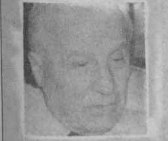
Kenan Evren (12 Eylül cuntasının lideri)