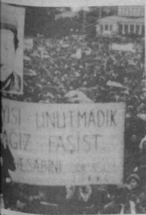
diktatörlükten hesap soracaklarını haykırıyor