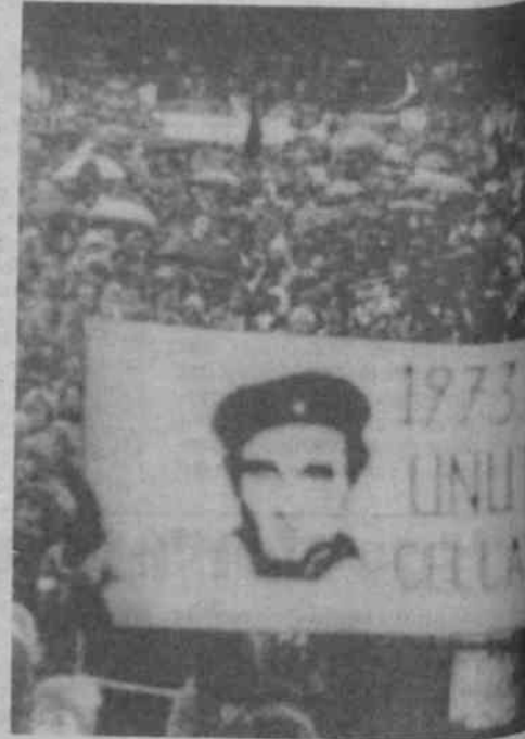
80 öncesi, komünist önderlerini unutmayan solcu

Partimiz TKP(ML) yenilginin muhasebesini doğru yaptı. Politikaya uyum sağlamayan önderlik ve örgütlenmeyi değiştirip doğru politikaya uygun örgütlenmeye girişti. Politik olarak esasta doğru tahliller tespitler yaptı. Bu konuda olduğu gibi, partiyi harekete geçirme kitleleri kucaklama ve harekete geçirme konusunda esasta doğru derslere sahip olmakla birlikte, pratik uygulamada hala önemli eksik ve hatalarımızın olduğunu biliyoruz.