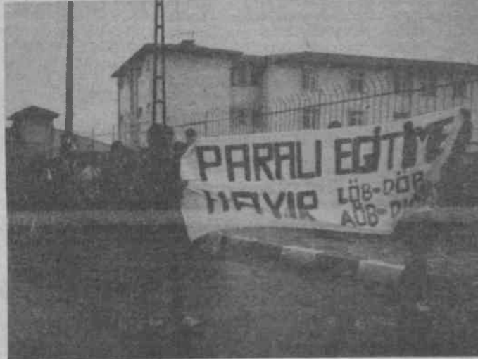
Dayatılana itiraz etmek ve hakkımızı aramak özgür geleceğimizin teminatıdır

Devlet bylesine pervasızlaşmaktadır ki artık sık sık istenen su yada bendenen paranın yanı sıra birde düzenli aidaata zorunlu tutmakta, her ay 50.000 yada 100.000 TL aidat istemektedir. Patronlar- ağalar doğru dürüst vergi vermezken devlet hizmet vereceğim adı altında işçiden emekçiden kaldıramayacağı oranda vergi kesmekte, ama doğru dürüst hiçbir hizmet vermemektedir. (Zaman zaman işçilerin, işçik, yada vb hizmetler için ayrıca benim cepim-