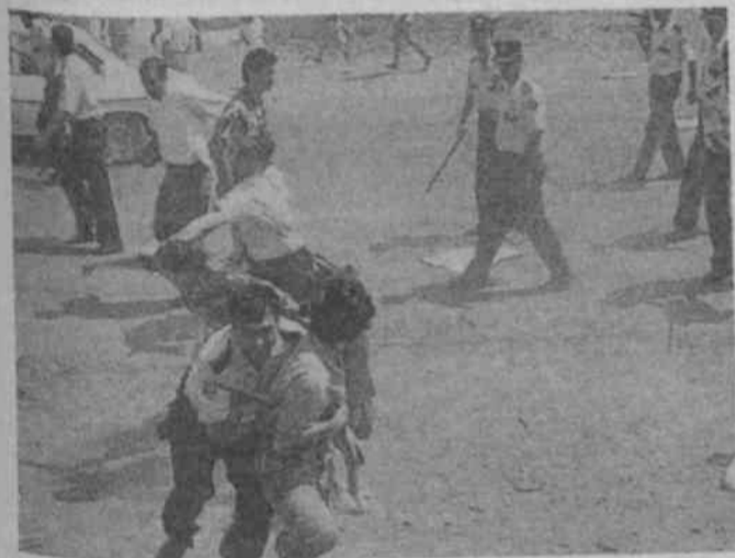
Üniversite öğretim görevlileri, demokratik- akademik haklarını arayan öğrencileri polise ihbar edip az döğdörtmediler

İzmir/ Özgür Gelecek- Bulgaristan'dan geldikten sonra İzmir Gaziemir tarafından ortaklaşa arsa alıp ev yapan göçmenlerin meskenleri. Tahtalı Barajı 3. koruma bölgesine girme ve İmar izni olmadığı gerekçesi ile yıkıldı. Yıkıma bin civarında asker, polis, zabıta katıldı. Yıkıma direnen halktan 10'u tutuklandı. Bir çok insan gözaltından korktuğu için hastanelere gidemedi. Eşyalarının dışarıya çıkarılmasına izin verilmemesi söyleyen halk bir çok eşyanın çalındığı kalının ise kırıldığını söyledi. Evlerinin uydurken projelerine arsa çıkarmak için yıkıldığını söyleyen halk DYP-MHP gibi partilerin tepkilerini engellemek çabalarına girdiklerini belirttiler. Bu durumu fuar açılışında Çiller nezdinde protesto etmeye çalışanlardan 50'si gözaltına alındı. Bu olay bir kez daha gösterdi ki ezen her yerde ezilen her yerde ezilendir.