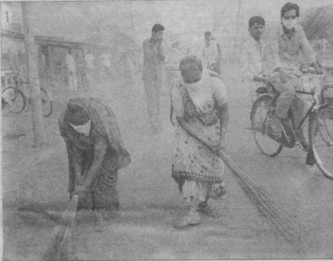
Hindistan'da Surat kentinde iki kadın, sokakları süpürerek vebayla savaşıyorlar. 3 bin 200 ton çöpün bulunduğu kent, süpürülerek kaç günde temizlenebilir acaba?

Ote yandan İngiltere, ülkedeki belli başlı havaalanlarında sağlık üniteleri oluşturdu. İngiliz hükümeti, Hindistan'dan gelen uçakları kontrol altına alacaklarını açıklar-