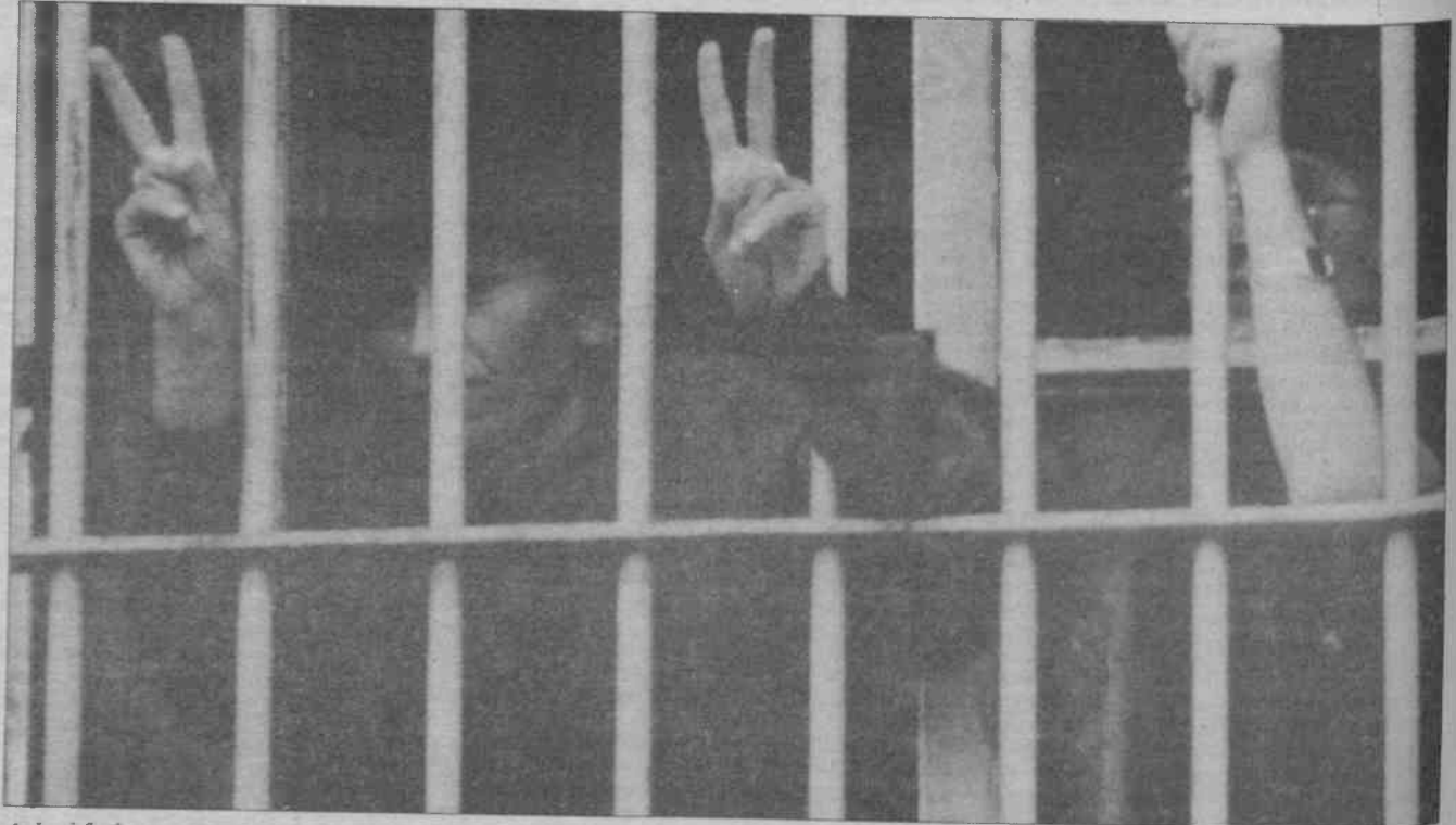
Askeri faşist cuntanın emekçileri yıldırmak için binlercesini doldurduğu zindanlar birer direniş kalesine dönüştürüldü.

ların olduğu bir gerçektir. Bunun sorumlusuda komünistler değil, eski toplum burjuvafeodal yöneticileridir. Uluslar arasındaki bu farkları gidermek sosyalizm süreci içinde uzun zaman alacağına, Marks- Engels gibi Lenin ve Stalin söylemişlerdir. Bütün bunlar ortadayken, bunları kavrama, araştırma yeri ne, ML ve sosyalizm dönemine saldırmak, sosyalistlik, devrimcilik değil, aşağılık bir tutumdur.