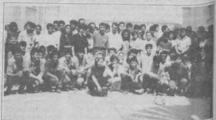
Özel Tekstil işçileri işten atılmaları protesto ettiler

15 yıllık tarihi olan ve 350'ye yakın işçinin çalıştığı Özel Tekstil'de eylem yapan işçilerin kararlılığı üzerine patronun kendi yakın çevrelerine bağlı emniyetten tanıdığı görevde dahi olmayan ve sorumlulukları o bölgenin dışında olan polis çağırarak işçiler üzerinde psikolojik baskı uygulayarak çevik kuvvet çağırma tehditinde bulunduğu belirtilen işçilerin başlıca sorunları; maaşlarına yapılan zamların keyfi olması usta-ışverenle işçiyi vereceği zammı kişiliğine, tipine ve hatalarına göre belirlemesi, ücretlerinde kesinti yapılması, ücretlerin sık sık kızıllı ve maaşlarının emniyetten talep edilmesidir. İşçilerin emniyetten talep edilmesinin yanı sıra, işçilerin işten atılmaları ve çalışma ey-