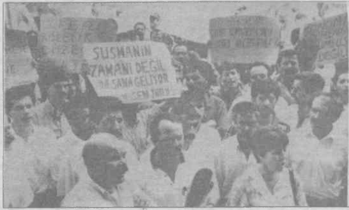
Memur, 217 bin liralık zammı güllünc buldu

Eylem sırasında yapılan basın açıklamasında hükümetin politikaları eleştirilerek "Ekonomik kriz hızla rejim krizinin toplumsal temelleri olmuştur. Bu kriz karşısında ekonomik, politik tüm