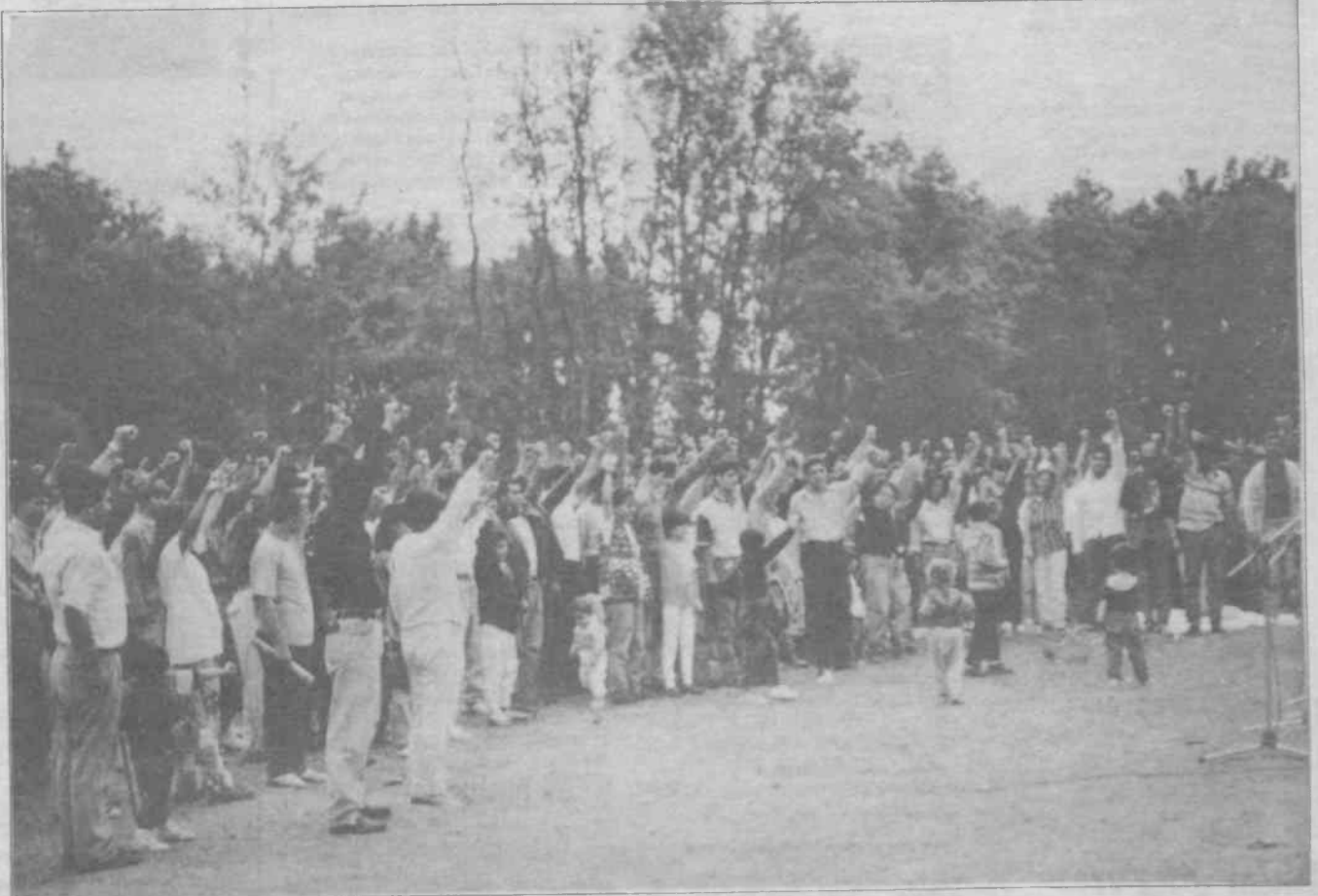
Partizan emekçileri ile dayanışma gezisinde, yağmur, kitlenin coşmasını engelleyemedi

Daha sonra çok kısa bir hazırlıktan sonra ilk defa etkinliğe katılan Partizan Çocuk Korosu sahneye geldi. Söyledikleri birbirinden güzel parçalarla izleyicilerin büyük sempatisini uyandırdılar. Geleceğin kültür savaşçıları olacağı umudunu verdiler. Daha sonra yüreklerde PARTIZAN TANYA'yı çağırıştıran bir genç kız, Nazım Hikmet'in uzun, coşkulu ve oldukça anlamlı Tanya şiirini okudu. Her okuduğunda insanda tekrar tekrar dinleme duygusu yaratan, tepeden tırnağa tüm hücrelerini, yüreğini, beynini etkileyen Tanya şiiri dünya durdukça güzelliğini sürdürecektir. Zamanın sınırlı olması nedeniyle yarım saatlik yemek molasından sonra tek-