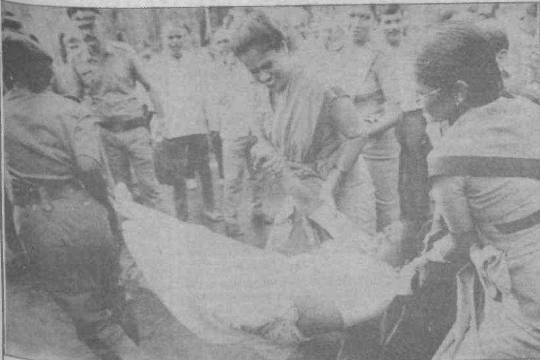
Emekçi kadınlar ile emekçi sınıfa düşman olan kadınların resmidir.

"Hindistan'ın Bombay kentinde önceki gün Komünist Parti yanlıları tarafından büyük bir gösteri düzenlendi. Hükümetin aldığı ekonomik liberalleşme kararları ve GATT anlaşmasını protesto etmek amacıyla sokaklara dökülen göstericiler trafiğin uzun süre tıkanmasına neden oldular. Bu arada kadın polislerde gösteriye katılan hemcinslerini yaka paça karakola götürdüler" (Milliyet 26. Ağustos 1994).