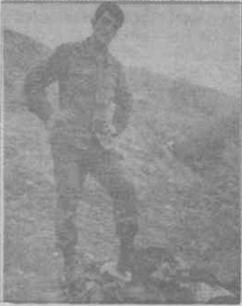
TC ordusunun insanı hayvanlaştırdığının resmidir

7 Ağustos tarihinde Özgür Ülke gazetesinin "İnsanlık Utansın" başlığıyla yayınlanan utanç fotoğraflarıyla ilgili olarak kamuoyuna şu açıklamayı yaptılar: "Canıyane bir yaklaşımla, ancak bir ruh hastasının mutluluğu ile, postalları altına yatırdığı insan, ne acılarıyla, ne ümitlerle büyüttüğümüz evlatlarımızdır. Hiçbir Türk anasının böyle bir insanı evlat olarak kabullenmeyeceği bu genç askeri, bir an evladınız olarak düşünün. Çocuklarımızı, insanları öldürmek, genç kız ve kadınlarımızı