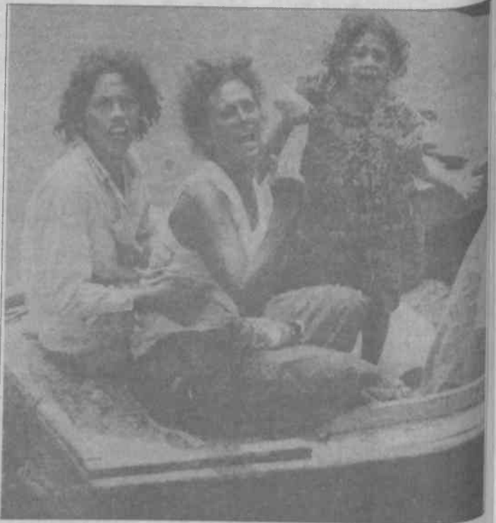
Kübalı mülteciler ABD ile Küba egemenleri arasında koz olarak kullanılıyorlar Bir haftada ortalama 17 bin mülteci ABD'ye kaçıyor.