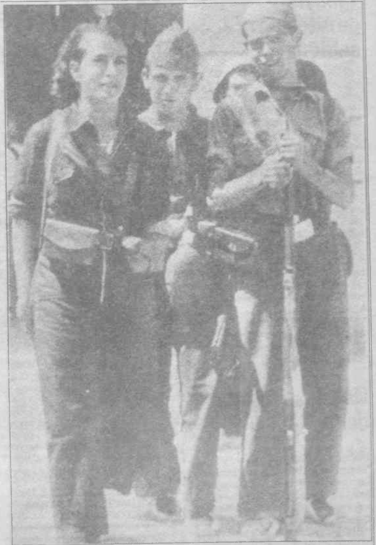
Franco'nun falanjişlerin katliamına karşı savaşmak için İspanyol halkı cumhuriyet hükümetinden silah istemişti. Ama hükümet uzlaşma yollarını aradığı için bu talebe olumlu yanıt vermemiş, bunun üzerine kırsal alan işçiler silahlara el koyarak karşı devrimi engellemeye çalıştılar. Bu direnmede kadınlarda erkekler kadar aktif bir biçimde milislerde görev almışlardır.

Sosyalizmi oradanda giderek komünizmi hedeflemeyen bir hareketin her siyasal anlayışın tıkanma ve yozlaşmayla karşılaşması kaçınılmazdır. Bu durum kadın sorunu içinde geçerlidir.