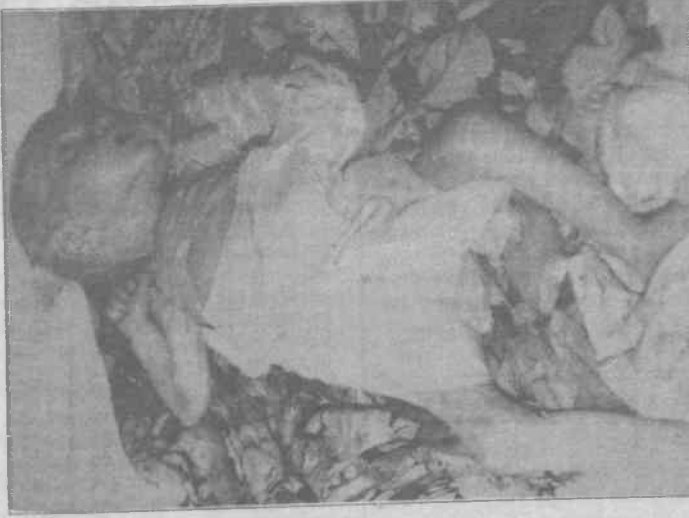
Bu bebekleri öldüren katilin adresi belli

RP'li Gaziosmanpaşa Belediye Başkanı Recep Koral kanalizasyon şebekesinin sonuna gelindiğini, şebekenin ucuna basit bir arıtma sistemi yapacağını belirten kanalizasyonun Alibeyköy Barajı'na akıtılacağını doğruladı. Koral Alibeyköy Barajı'nın zaten devre dışı kalacağını planlandığını belirtti. Fakat şebekenin ucuna hâlâ arıtma sistemi konulmuş değil. İSKİ yet-