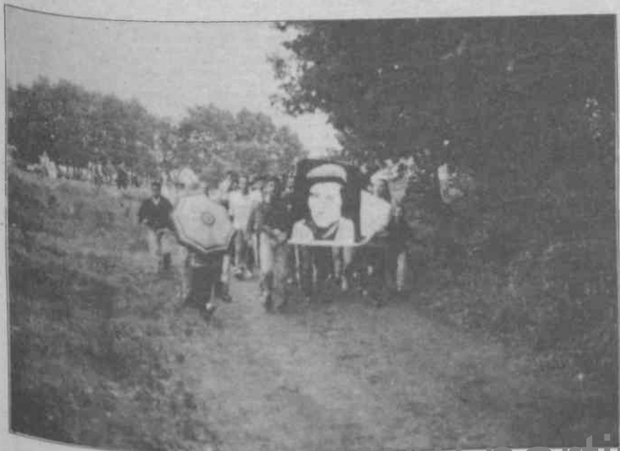
Büyük Önder İbrahim Kaypakkaya'nın coşkulu ve taştan gençlerin gelmesiyle kule daha bir coştu

Amatör sanatçılarımız sazı sözü eşliğinde coşkuyla çekilen halaylarla gezi sona erdi. Çevrenin temizliğinden sonra arabalara binildiğinde, yüreklerimizde PARTIZAN coşkusu, kulağlarımızda "YAŞASIN PARTİZAN TIMİZ TKP(ML)" sloganları yankılanmaktaydı.