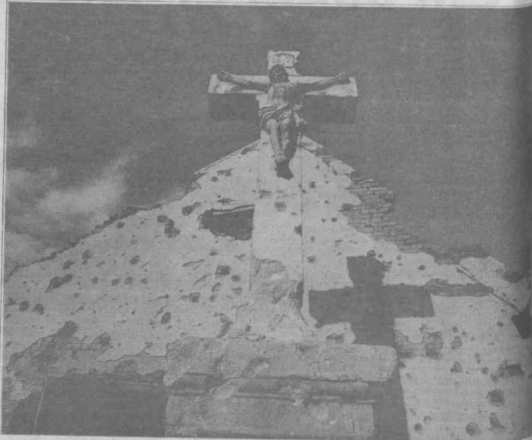
Vukovar Katolik Kilisesi. 700 yıllık bir eser. Kasım '91'de bu hale getirildi

Tahminlere göre, Hırvatistan'da bulunan 243 Ortodoks ve 510 Roman Katolik kilisesi ve manastırı hasar görmüş veya imha olmuş du-