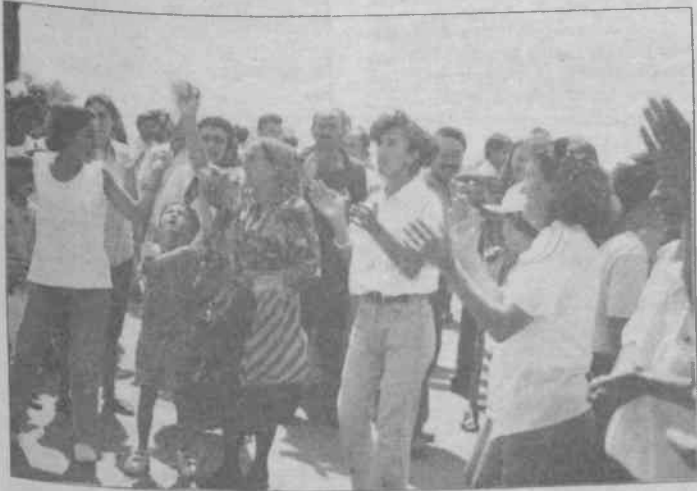
Emekçi kadınlar "koleradan ölmek istemiyoruz" diyorlar

İstanbul/ Özgür Gelecek- Emekçi kadınlar 26 ağustos günü susuzluk ve kirli suyu protesto ettiler. İSKİ önünde toplanan yaklaşık 350 civarında kadın ellerinde boş bidonlar, dövizler ve pankartlarla "Kirli sudan ölmek istemiyoruz!" dediler. "İnsanca yaşamak için örgütlü mücadeleye", "Emekçilerin musluğundan ölüm, zenginlerinkinden yaşam akıyor", "Savaşın faturasını ödemek istemiyoruz", "Her semte eşit su, her semte temiz su", "Musluklardan bok akıyor" yazılı dövizler taşıyan emekçi kadınlar İSKİ önünde bir basın açıklaması yaptılar. Basın açıklamasında ölümlerin artık sadece ulusal ve sınıfsal mücadelenin kanla bastırılmasıyla gelmediği vurgulandı. Can çekişen bu sistemin öl-