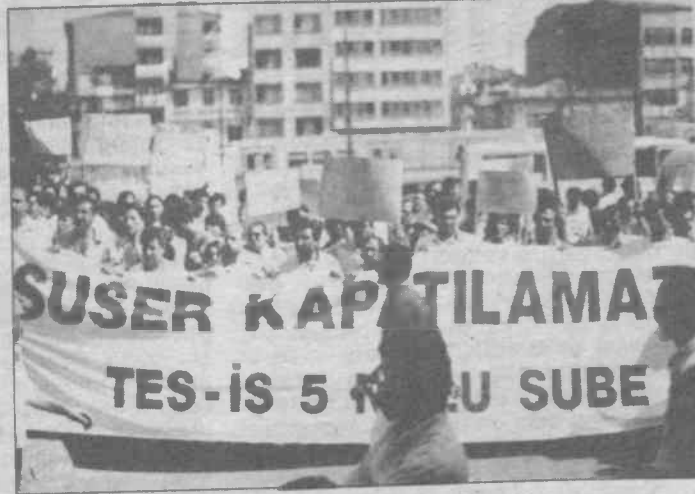
İşçi "Kapatılmaz" dedi. Sendika uzlaşma yolunda. Direnkte ısrar edilirse bu yenilgi zafere dönüşecek

Ayrıca bu politik karar doğrultusunda binlerce işçiyi sokağa atarak yerine kendi yandaşlarını almayı planlayan diğer düzen partileri gibi adil düzen temsilcilerinin de oy tabanı yaratma ve politik amaçlarına binlerce işçiyi açlığa mahkum ederek ulaşma girişimleri devam ederken yine bir basın açıklaması yapan işçiler işlerini bırakmamakta kararlılar şu anda işyerinde iş bırakma şeklinde sürdürülen eylemin bundan sonraki geliş-