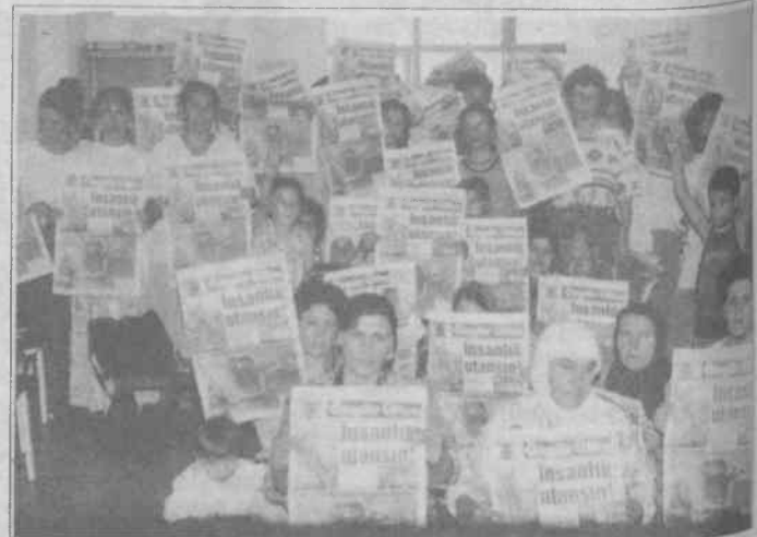
HADEP Kadınlar Komisyonu'ndaki kadınlar 7 Ağustos 1994 tarihili Özgür Ülke gazetesini gösterirken

"Bu fotoğrafları gördüğümde çocuğumun askere gitmesini nefretle karşıladım. Kardeşim 4 yıl önce gerillada şehit düştü, oğlum ise askere gitti. Şimdi herkes bana 'Senin oğlun askere gitti' dediğinde utanç duyuyorum. Bir taraftan akrabalarımın çoğu gerillayken oğlumun askere gitmesi beni çok üzdü. Benim bir oğlum daha var, o da askere giderse kendimi öldürürüm. Askere giden bir kız sevmişti, ona söz vermişim. Askerden dönünce, iş bulup onunla evleneceğim. Bu yüzden