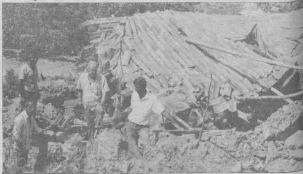
İzmir'in Balçova semtinde evleri başlarına yıkılan insanlar yıkımın şokunu yaşıyorlar

Gecekondu sakinleri bugün kalıp kahvaltılarını yaparlarken, saat 9:00 civarlarında karşılarında Balçova Belediye Başkanı, yanında zabıta, çevik kuvveti ve 10-15 kişilik yıkım işçilerini gördüler. Evlerin de bulunanların konuşmalarına bile izin verilmeyip, polislerle zabıta eve girip eşyaları dışarı atıktan sonra, 30 civarındaki evi birer birer yıkmaya başladılar. Evlerde kadın ve küçük çocukların dışında kimsesizdi. Çünkü erkekler sabahın erken saatlerinde işe gitmişlerdi. Yıkımdan önce kendilerine hiçbir uyarının gelmediğini belirtiyorlar. Evlerinin çoğu bağ ve bahçelerle çevrili. Kimi evler 25 yıllık, 25 yıldır evlerinin vergilerini ödediklerini, 15-20 yıl önceki inşaatın olduğunu iddia ediyorlar. Bugüne kadar yı-