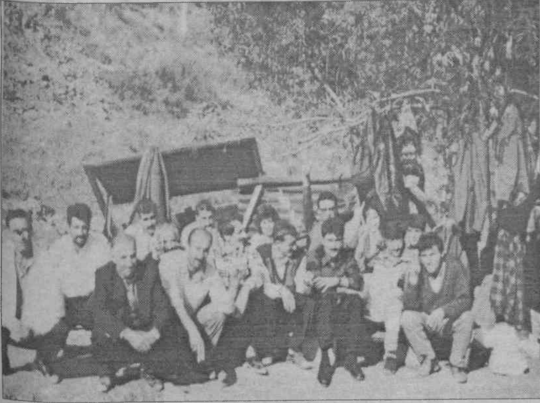
Aras Kargo işçileri almakta kararlı görünüyor

Istanbul/Özgür Gelecek -İşçi sınıfımızın geçen yüzyılın ikinci yarısından beri yoğun bir şekilde sürdürdüğü hak arama mücadelesi sayılı eylemlerle aktif bir şekilde devam ediyor. Son süreçte 12 Eylül'e işbaşına gelen cuntta yönetimi faşizan uygulamalarla sınıf savaşımını engellemeye çalışmıştır, bunu başaramadığı da söylenemez ne var ki son yıllarda Türkiye'de yükselen devrim mücadelesi köylülüğün ve işçi sınıfının tekrar uyanış ve ayağa kalkışına sahne oluyor. Doğuda köyler kaynıyor, sanayi şehirlerinde işçilerin sendikalaşma mücadeleleri yükseliyor. Ve bunlardan biri olan Aras Kargo işçileri ise kararlılığı ve sınıf bilincini giderek yükselterek sınıf mücadelesini ilerletiyor. Aras Kargo işçisi siyasi baskı ne kadar yoğun olursa olsun sömürüye baş eğmeyeceğini göstermekte kararlı.