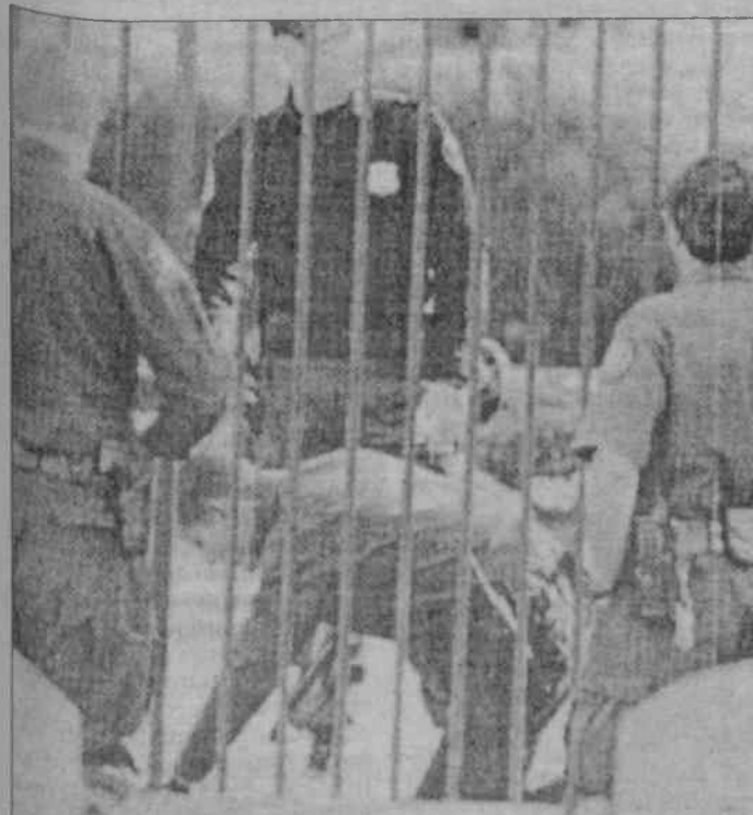
Beyaz Saray tarandıktan sonra olaya CIA müdahale etti