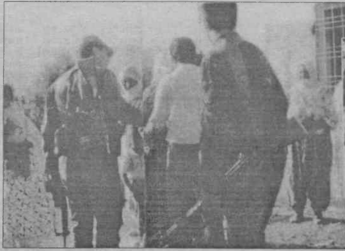
TC askerlerinin Kürt köylüsüne yoğun baskıları devam ediyor

Söz konusu projenin bölgede tarım ekonomisinin geliştirilmesini amaçladığını belirten Çiller, "Bölgede, yaşanabilir ekonomik tarım işletmeleri ölçülerine ulaşmayan işletmelerin, kredi desteği ile dahi varlıklarını sürdürmeleri imkansız gözükmektedir. Tarımsal gelişme-