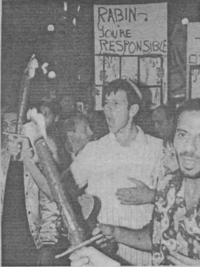
Tel Aviv'de otobüsün bombalanması üzerine gösteri yapan Siyonistler, bombalama olayından Rabin'i sorumlu tutular

Clinton'un Suriye ziyareti öncesi HAMAS'ın böyle bir eylem gerçekleştirmesi tesadüf değil. Bu eylemden sonra İsrail ve Ürdün'ün yaptıkları anlaşmaları açıkça ilan etmeleri de tesadüf değil. Ortadoğu'da emperyalistler arası hesaplaşmaların daha da kızışması beklenen bir olgu olarak dikkat çekiyor.