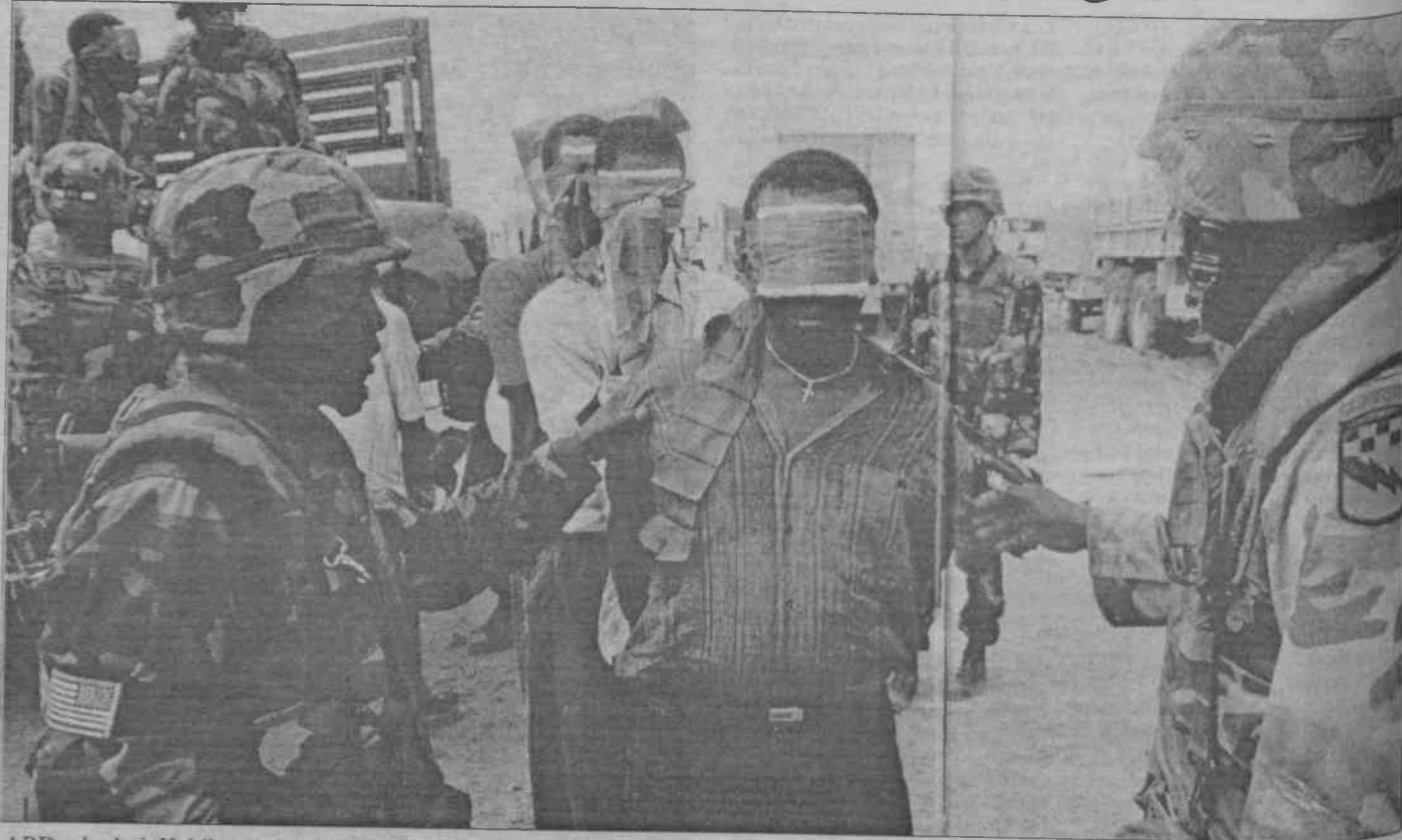
ABD askerleri, Haiti'ye ayak basar basmaz ilk iş olarak halkın muhalefetini bastırmaya çalıştılar. İnsanlar özel göz bağcıklarıyla CIA merkezlerine götürülerek sorgulanıyor.