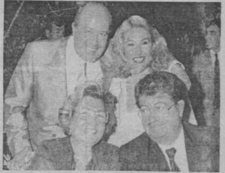
Edes ailesi ile Özal ailesinin mutluluk tablosu sanki, halkın gözüne baka baka ne yapalım bu işler böyle oluyor der gibiler.

Yine geçmişte olduğu gibi suçluların cezasını suçlular verecek, tabi bu ceza nasıl bir ceza olur artık siz