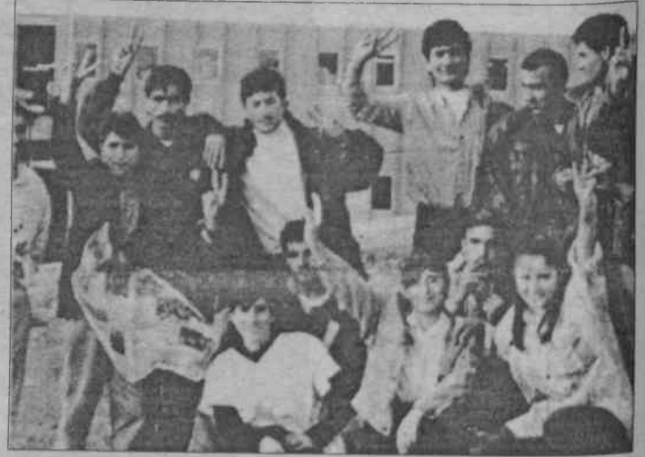
CEMTAŞ işçileri "Ya kazanacağız, ya kazanacağız" diyor

Yaklaşık bir haftadır jandarma ablukası altında direnişleri devam eden işçiler eylemin ilk günü eylem komitesini oluşturdu. Direnişin ilk gününde akşam üzeri fabrikanın