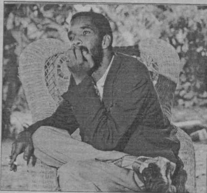
Toto Constant, Haiti'de polis örgütü FRAPH'yi kurdu. CIA ile ortak çalışarak birçok cinayet işledi. Kokainin olan Constant, amaçları uyuşturucu ticaretini önlemek gibi göste ilen FRAPH'nin kurucusu olarak CIA uyuşturucu ticaretini bastırması için kurulmuştu. Kimi tedende uyuşturucu ticaretini önlemek için işbirliği

FRAPH'la ilişkilerini derhal reddettiler. CIA yetkilileri şöyle diyor: "İğrenç insanlardan bilgi toplamak ile onların yaptığı veya desteklediği iğrenç şeyler arasındaki önemli farkı görmeyi istiyoruz." Yani CIA'nın açıklamasına göre, sadece bilgi almak için Constant'a para verilmişti, yoksa FRAPH'ın finanse edilmesi için değil. Ve CIA yetkilileri şöyle bir örnek de veriyordu: Soğuk savaşın ağırlığını hissettirdiği günlerde, CIA tarafından KGB bünyesinde çalışan, ancak çift taraflı bilgi satan ajanlara da para verilmişti. Eğer CIA-FRAPH bağlantısı kurma mantığı doğruysa, o zaman CIA'nın KGB'nin bankası rolünü oynadığını da kabul etmek gerekirdi.