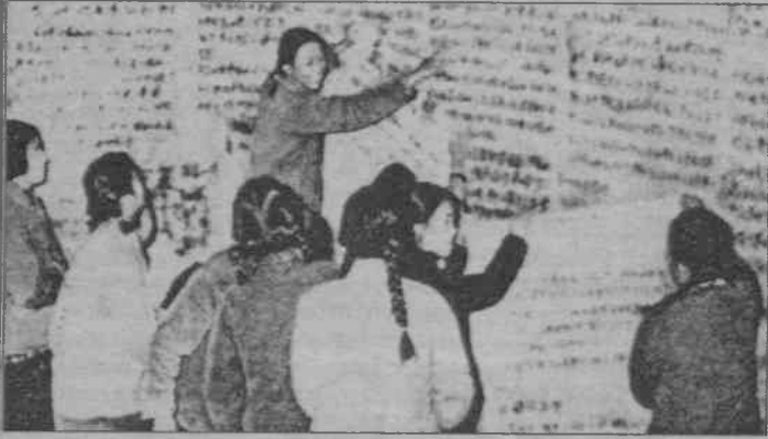
Dazubao'lar ve siyasette aktif kadınlar kültür devriminin iki simgesiydi (Dazubao: Çin Kültür Devrimi sırasında halkın kullandığı duvar gazetesi)

ÇKP içerisindeki kapitalist yolculara ve belli mevkilerde olan bütün bürokrat ve gizli burjuvalara karşı açılan Büyük Proleter Kültür Devrimi bütün heybetiyle Çin'i de aşarak bütün dünyaya yayıldı. Asya'nın yanı sıra Türkiye'de dahil olmak üzere Avrupa'da büyük kitle gösterilerine, öğrenci hareketlerinin kabarmasına neden oldu. BPKD, dünyanın birçok yerinde ezilen halklara esin kaynağı olurken, Türkiye kesitinde de proleterya partisinin doğuşu ve gelişiminde etken oldu. BPKD, devrimini yapmış ülkelerde sınıf mücadelesinin daha da keskinleşerek devam edeceğinin ve böylece kitle hareketleriyle devrimci ruhun canlı tutulması zorunluluğunun pratiğe yansımalarıdır.