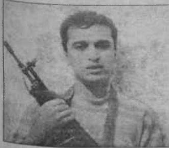
Otobüsü uçuran Hamas militanı

HAMAS, 10 gün önce bir İsrail askerini kaçırmış, daha sonra askerini cesedi bulunmuştu. Bu sırada Ürdün ve İsrail el altından anlaşmalar yapıyorlardı. Fakat anlaşmanın kutlaması