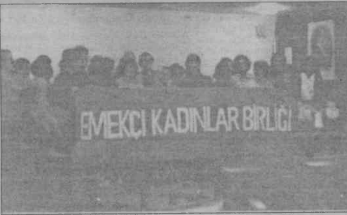
İstanbul Tabipler Odası'nda bir basın açıklaması yapan EKB'li kadınlar "sınıf mücadelesinde bizde varız dediler"

İstanbul/Özgür Gelecek-8 Mart Dünya emekçi kadınlar Günü için EKB'nin başlattığı "Hayır De! Örgütlen" kampanyası boyutlanarak devam ediyor.