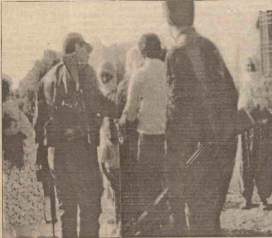
Son günlerde özellikle Dersim'de "Vietnam'laştırma" politikaları güden devlet güçleri, insanların evlerini bile boşaltmalarına izin vermeden her tarafı yakıyor. Köyler, evler, ormanlar, hayvanlar acımasızca yok ediliyor.

□ Devletin genelde T. Kürdistanı'na, özelde Dersim'e yönelik toplama kampları politikası sürüyor. Son günlerde, özellikle TKP(ML) TIKKO gerillalarının yoğun olarak faaliyet gösterdiği Ovacık ilçesine bağlı köyler boşaltıyor.