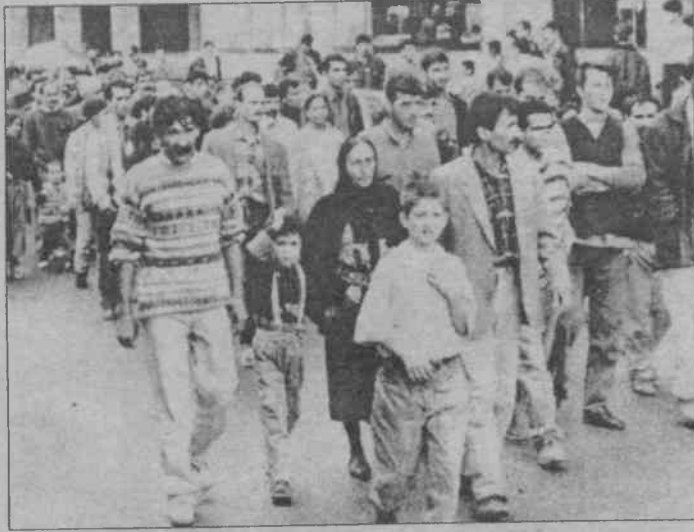
Gülsuyu halkı devletin özeld Dersim'deki zulüm politikasına yürüyerek protesto etti

"Kırlı savaşın giderlerini emekçi halkın alınterinden karşılayan, 5 Nisan kararlarıyla emekçiler üzerindeki sömürüyü iyice katmerleş-tiren devlet, böylelikle Türk halkını da bu kırlı savaşa ortak etmektedir" diyen Gülsuyu-Gülensu halkı, özelleştirmelerle bir çok işçinin işten atıldığını, eğitime, sağlığa bütçe-den ayrılan payın, memura verilen zammın komik denecek miktarda olduğunu belirterek, devrimcilere ve komünistlere yönelik yargısız infazlarını sürdürdüğünü, Kürt ulusu karşısındaki kırlı savaşa, Dersim'de yapılan katliama, işçi, me-