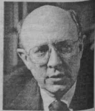
CIA şefi James Woolsey. Woolsey, amaçlarının insan haklarını korumak olduğunu savunuyor.

Oysa, CIA'nın Haiti'deki geçmişi de, faaliyette bulunduğu tüm yerlerdeki geçmişi kadar kirli. Haiti'de 1986'da Jean Claude Duvalier (nam-ı diğer "Baby Doc") diktatörlüğünün çöküşünden sonra, CIA, Haiti istihbarat servisi SIN'ı kurdu. Bu servis, görünüşte uyuşturucu ticareti ile mücadele için kurulmuştu. Kimi tedende uyuşturucu ticaretini önlemek için işbirliği