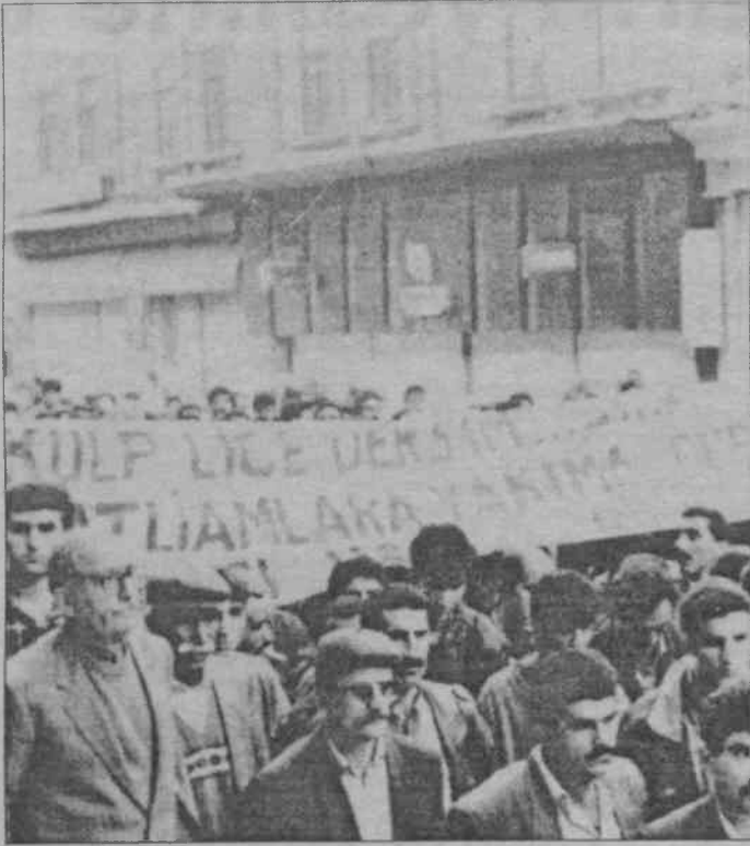
Sirkeci Postanesi'nin önünde toplanan bin beş yüz kişi "Dersim'in Faşizme Mezar Olacak!" sloganını attı

Ote yandan 29 ekim günü, saat 16.00'da Sirkeci Postanesi'nin önünde çeşitli ilericilik kurum ve kuruluşları tarafından bir basın açıklaması yapıldı. Yaklaşık bin beş yüz kişilerin katıldığı basın açıklamasına HADEP İstanbul İl Örgütü, Tunceli Kültür Ve Dayanışma Demneği, Pir Sultan Abdal Kültür Ve Tanıtım Demneği, Pir Sultan Canlar Demneği