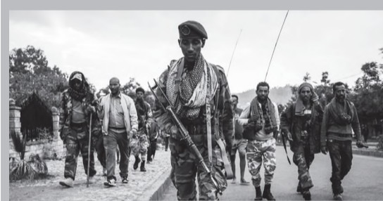
TİGRAY HALK KURTULUŞ CEPHESİ İLERLİYOR