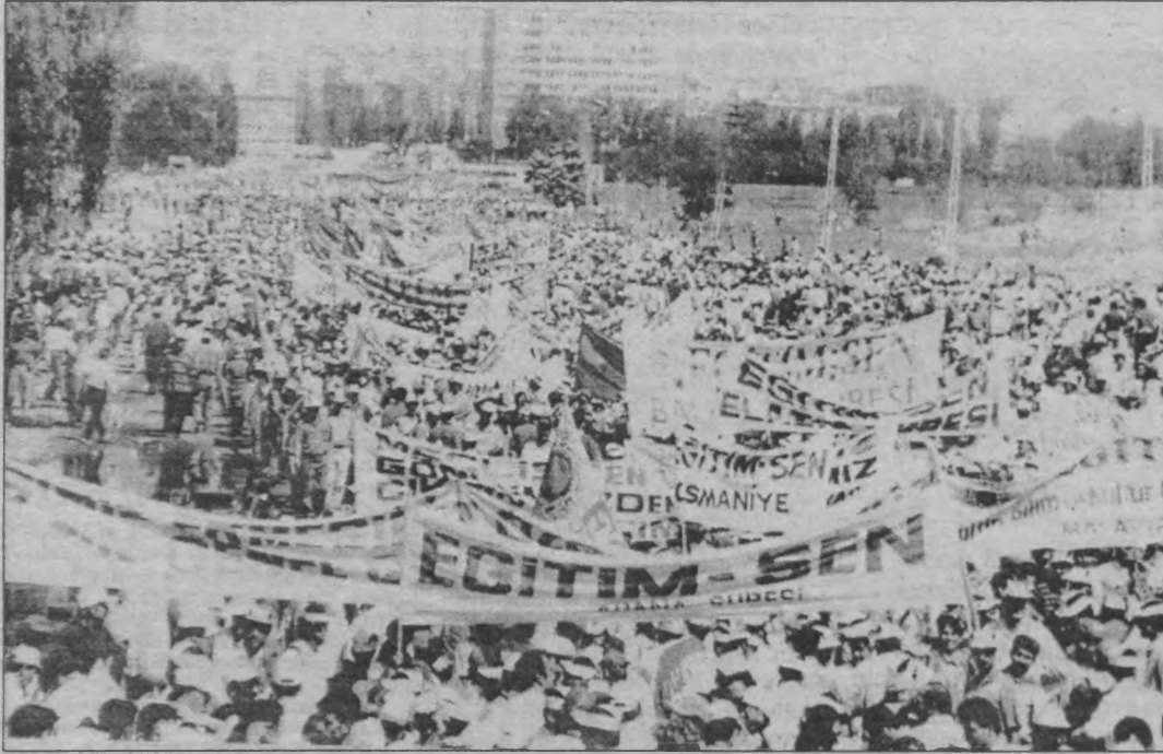
100 binleri aşkın kitleyle Ankara'yı dolduran kamu çalışanları "Gemileri Yaktık Geri Dönüş Yok!" sloganıyla düzene karşı kararlılığını dile getirirken, kaşarlanmış bürokrat sendikal önderliğin uzlaşması tavrı sonucu gemileri yakmalarına rağmen geri döndüler.

Tam bir dayanışma yaşayan emekçiler, o gece beton zemin üzerinde sabahladılar. Aralarında kaynaşmayı sağlamıştı emekçiler. Gece türküler, marşlar söylüyorlardı aralarında ve bir anons duyuldu. "Umut Yayıncılık adına; Partizan dergisi, Özgür Gelecek gazetesi ve Yeni Demokrat Gençlik Dergisi, kamu çalışanlarının haklı mücadelesini destekler" Ertesi gün, destek(!) vermeye gelen Türk-İş Genel Başkanı Bayram Meral'i kamu emekçileri yuhalayarak, konuşmasına