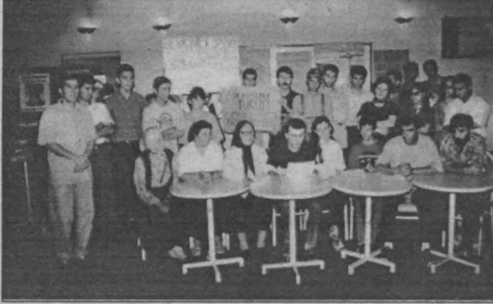
OKM emekçileri yapılan basın açıklamasında "Yılmadık, özgürce, korkmadan, halk için üretiyoruz" dediler.