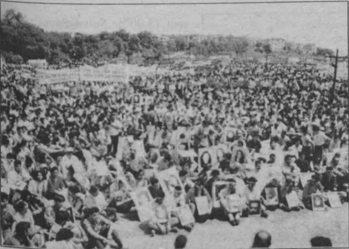
Sivas Katliamı, başta İstanbul ve Ankara olmak üzere ülkenin birçok yerinde yüzbinler tarafından lanetlendi.

laşmacı-opportünistler tarafından kitle salonlara hapsedildi.