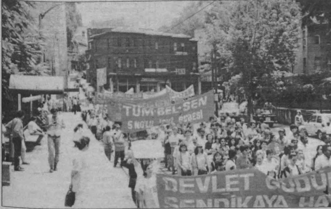
Ankara'daki eylemliliğe katılımın ve coşkunluğuna karşın İstanbul'da gerçekleştirilen eylem hem katılım, hem de coşku olarak sönük geçti.

Bursa'da 21 haziran günü saat 10.00'da Stadyum önünde toplanan 3 bin kamu çalışanı DYP il binasına yürüyüp oturma eylemi gerçekleştirdiler. Sloganlarını haykıran kamu