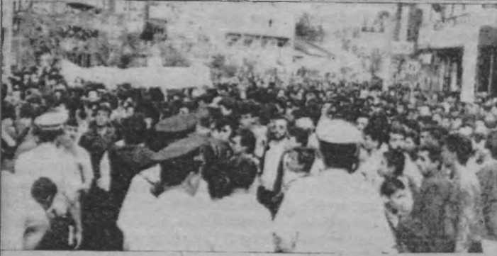
Yobazlar, 37 güzel insanı yakmaya hazırlanırken de, yakarken de, yaktıktan sonra da polis yalnızca ne kadar 'iyi' bir izleyici olduğunu gösterdi...

Faşist devlet toplumsal-ekonomik ve siyasi krizden kaynaklı olarak kendisine karşı yönelen muhalefeti bastırmak için emekçiler arasında milliyetçi-mezhepsel vb. çatışmalar yaratarak halkı birbirine kırdırmaya çalışır. İşte Sivas'ta 2 Temmuz 1993 günü 37 insanın faşist gerici bir grup tarafından yakılarak katledilmeside