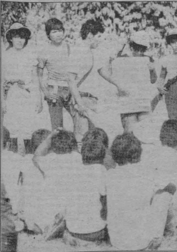
Bir gerilla üssünde, köylülerle gerillalar eğitim çalışması yapıyor.

■ Dış Haberler Servisi- Pakistan hükümeti, Karaçi ilinde yayınlanmakta olan 122 gazetenin yayın izinlerini iptal etti. Hitlervari bu kararın gerekçesi dahi bildirilmezken, olay, son yılların basına karşı girişilmiş en büyük saldırılardan biri olarak değerlendirildi. Hükümet, bir süre önce de "Karaçi'deki şiddet olaylarının abartıldığı" gerekçesiyle 6 gazetenin yayınlarını durdurmuştu