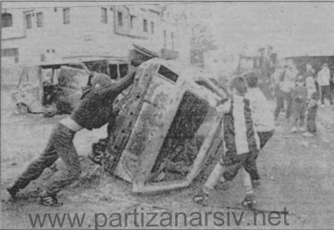
Katil askerın serbest bırakmasını protesto eden gençler arabaları parçaladılar.

Bu koşullarda "barış" hayali İrlanda devrimine ihanete hizmet edecektir. ■