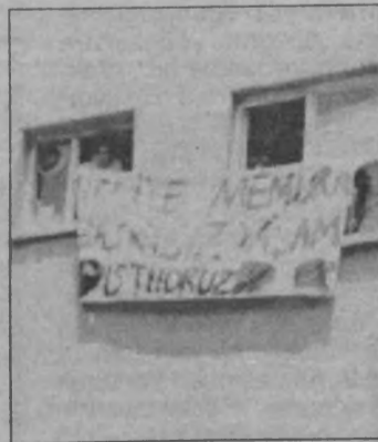
Konutlarından atılmaya çalışılan Tozkoparan Belediyesi memurları, pencerelerinden sarkıttıkları pankartlarla olayı protesto ettiler.

Binada kalan 19 memurun tamamının Tüm Bel-Sen'de örgütlü olmasından dolayı belediye'deki örgütlü olan işçileri boşaltma amacıyla gönderen