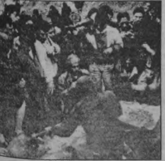
La Cantuta Üniversitesi'nden 9 öğrenci ve bir profesörün mezarları

Geçtiğimiz yıl, birkaç devlet görevlisi, başkent Lima'daki La Cantuta Üniversitesi'nden 9 öğrenci ve bir profesörü 1992 yılında katlettikleri için hüküm giymişlerdi. Katliam, tarihte La Cantuta Katliamı olarak geçti ve uluslararası kamuoyunda büyük tepkilerle karşılandı. Kurbanlar maskeli askerlerce öldürülmüş ve gömülmüşlerdi. Fujimori hemen Silahlı Kuvvetler'i aklamaya çalıştı ve üstüne üstlük olaydan PKP'nin sorumlu olduğunu açıkladı. Fakat, egemen sınıflar arası çelişkilerden dolayı ordu içerisinde üçüncü yüksek rütbeli subay General Robles, 1993 Ma-