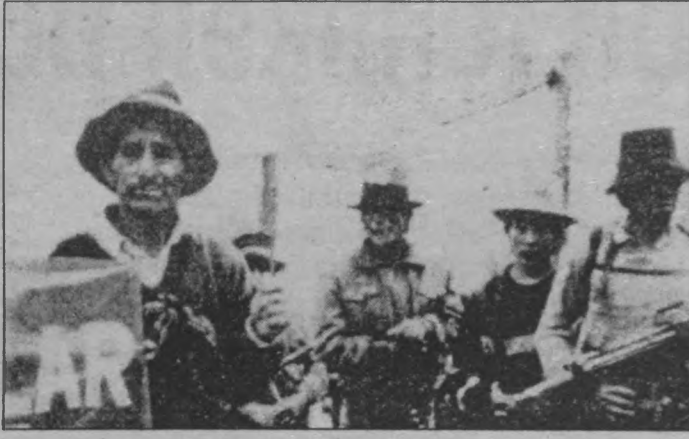
Peru Komünist Partisi önderliğindeki bir Açık Halk Komitesi