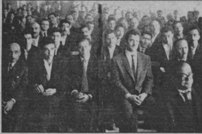
Türk-İş'in yeni kurulduğu dönemde yapılan bir toplantı.

Bu rolüne rağmen "... mutlaka yığınların olduğu yerde çalışmak gerekir. Asıl kurumlarda, derneklerde, örgütlerde, proleter ya da yarı proleter yığınların bulunduğu her yerde (bunlar, en gerici eğilimlerde olsalar bile) metodlu, azimli, inatçı ve sabırlı bir bilinçlendirme çabası ile bütün fedakarlıkları göze almak, en büyük engelleri göğüslemeyi bilmek gerekir" (Lenin) ■