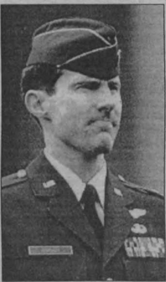
Amerikalı pilot O'Grady'nin "kahramanlığı" tam da Hollywoodvari bir senaryoydu

ABD ise, dünya kamuoyuna, Bosna için çok çalıştığını mutlaka göstermek istiyordu. Ve, Hollywoodvari bir senaryo yazıldı. Bosnalı Sırp tarafından uçağı düşürüldükten sonra günlerce saklanan, aç kaldığı için ot yiyen, canın dişine takarak yaşam savaşı veren bir kahraman lazımdı. Amerikalı pilot Scott O'Grady bunu gerçekleştirdi, daha doğrusu kobay olarak kullanıldı. Fakat kısa süre sonra, kahraman O'Grady'nin ve dolayısıyla ABD'nin gerçek yüzü açığa çıktı. "Sırp topçularının radarları O'Grady'nin F-16'sına kilitlemişti" diyordu aynı filodan bir başka pilot. "O'Grady'ye bölgeden çıkması için birkaç kez uyarıda bulundum, ama o bölgenin içinde dönüp duruyordu." O'Grady, yere iner inmez telsiz kullanması gerekir-