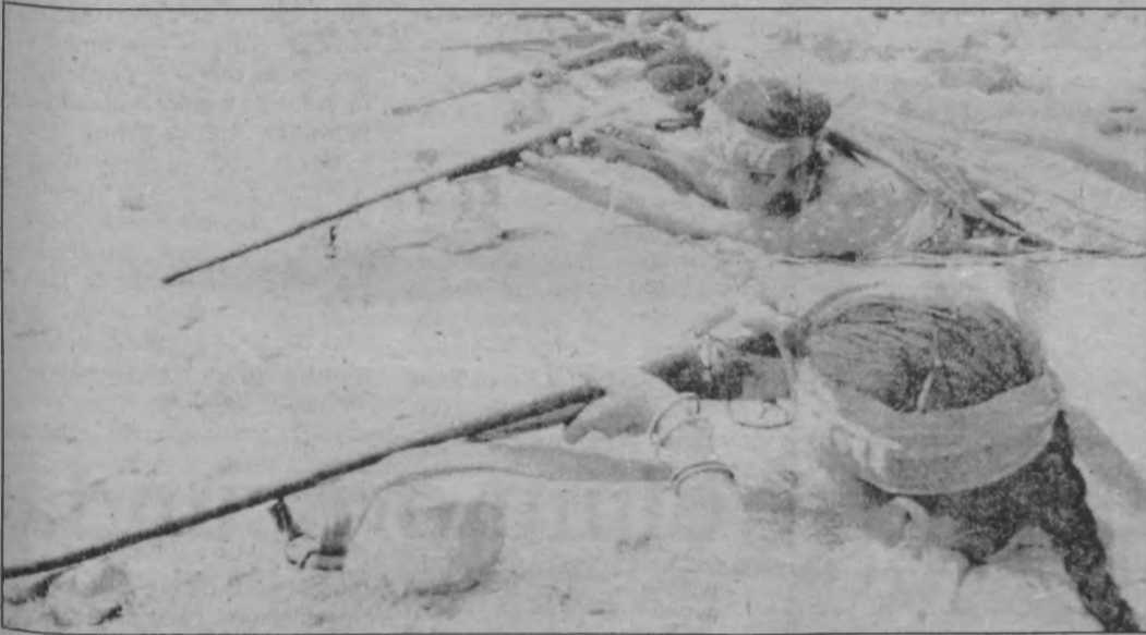
Hindistan'da 2500 yıldır süren kast sistemine karşı silahlanmış bir grup kadın gerilla eğitim yaparken

Devrimci kişilik, devrimcilere- rasi ilişki iste böyle bunalımcı, yozlaşmış ilişkilerin alternatifidir. Bazı eksiklikler, toplumdaki bu olumsuzluklardan etkilenmeler ve bunun müthiş derecedeki öne- mi olsa da, alternatif olarak öne çıkarılacak tek kişilik ve ilişki, devrimci kişilik ve ilişkidir. İste bu nedenledir ki devrimci- ler her alanda olduğu gibi evlilik- lerde de, var olan eksiklik ve za- falarını aşmaya ezami önemi gös- termek bu toplumdaki herşeyin alternatif olduklarını bilincineyle hareket etmek zorundadırlar. Gü- zel ilişkilerin yolu devrimçileş- mekten geçmektedir.