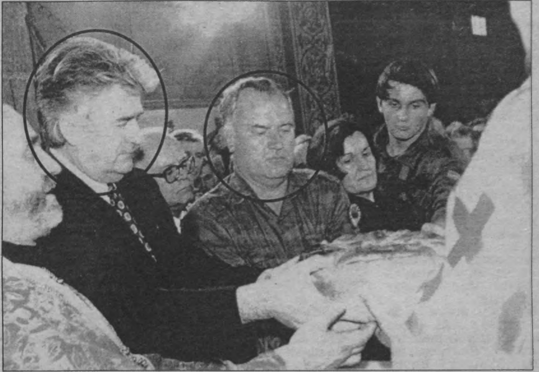
Bosnalı Sırp lider Radovan Karadžić (solda) ile kasap General Ratko Mladic'i genç zaferlerinden birini kutlarken.