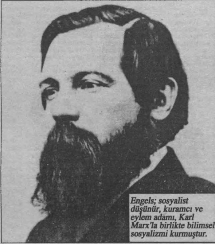
Engels; sosyalist düşünür, kuramcı ve eylem adamı, Karl Marx'la birlikte bilimsel sosyalizmi kurmuştur.

Engels 1842'de komünizmi benimsemesinde önemli rol oynayan inoses Hess ile tanıştı. Varlıklı bir Yahudi ailesinin oğlu olan Hess, radikal mücadeleye ve sosyalist yayınlara mali destek sağlıyordu. Ayrıca, Hegel felsefesinin ve diyalektiğin mantıksal sonucunun komünizm olduğunu ileri sürüyor ve ilerlemiş sanayisi, filizlenmekte olan proletaryası ve sınıf mücadelesinin belirtileriyle İngiltere'nin gelecekteki toplumsal dalgalanmalarda büyük bir rol