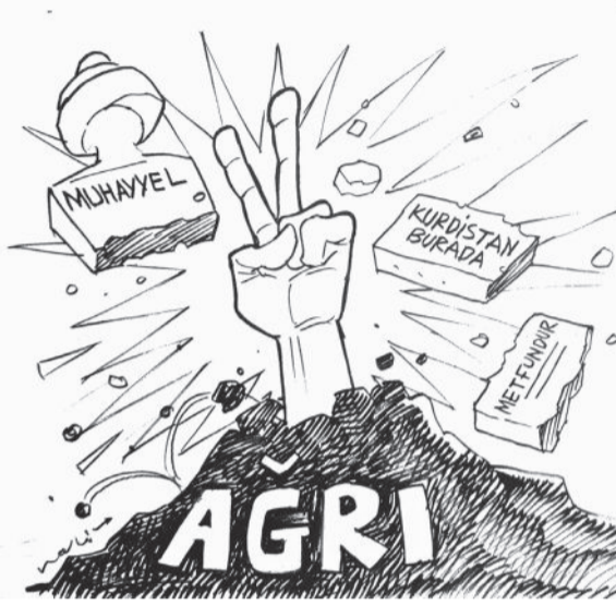
Şeyh Sait İsyani'nin yenilgiye uğrama-

(Agirî) arasında Zilan Harekâtı gerçekleştirilir ve Agirî eteklerindeki köyler tamamen yakılır. Zilan Katliamı'nda öldürülen insan sayısının en az 15 bin olduğu "tahmin" ediliyor.