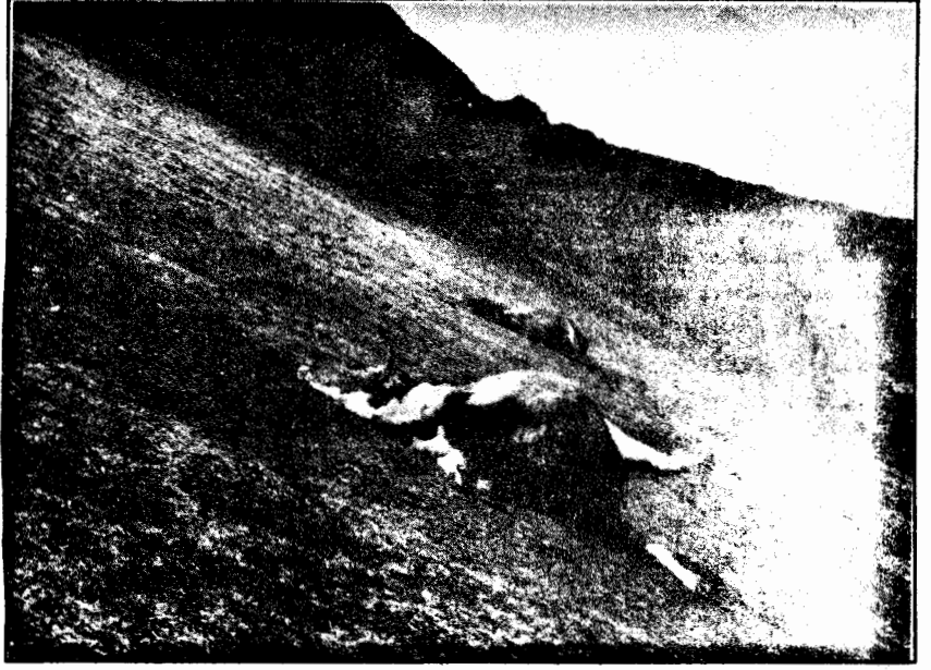
T.C'nın Kürdistan'da yürüttüğü kirli savaş, insanların yanısıra doğa ve hayvanları da yokediyor.

Egemenler, kaçınılmaz olan hesaplaşmanın bir üst evresini kendi güç ve hazırlıklarına göre en uygun zaman olarak belirledikleri dönemde yaşatmaya ve istedikleri koşul ve zamanda savuşturarak sonuç almaya çalışıyorlar. Bu hesaplaşma ile, gelişen ulusal hareketi geriletebilmenin yanında, uzun vadede kendi-