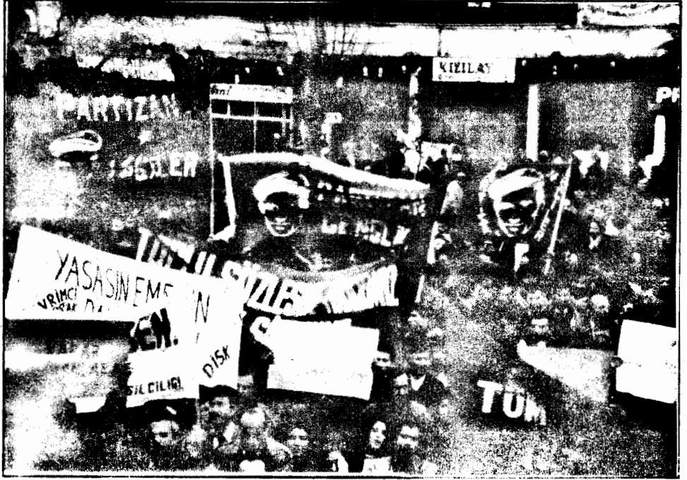
O her yerde bir meşaledir.

DEĞİŞTİRİYORLAR! Hem devletin onlara yönelik anlayış ve uygulamalarını hem de toplumdaki genel bakışı. Zira "devletin memuru" imajı emeğini satarak yaşayan bu kesimin yerinin emekçinin yanında olduğunu karartan bir imajdı. Devlet-işveren/patron böyle istiyor ve koşulluyordu. "Memurlar ve Halk da bunun etkisi altındaydı. Bugün işte bu ortam kırılıyor, "memur" emekçi olduğunun bilincine varıyor, örgütleniyor, haklarını alıyor, hatta diğer emekçilere ÖRNEK OLUYORLAR. Artık onlar devletin memuru değil emeğin memurudur$ emeğinin hakkını alması