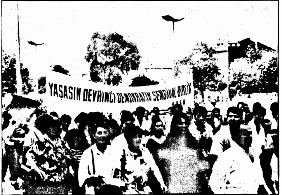
Devrimci-Demokrat işçiler sendika yönetimine!

"Oh!" işte bir toplusözleşme daha sağlanmış. "Komünistlerin bütün kışkırtmalarına rağmen olaylar fazla boyutlanmadan bastırılmıştır. Gerçi patron biraz insafsız bir herif, bizi de fazla kaale almıyor