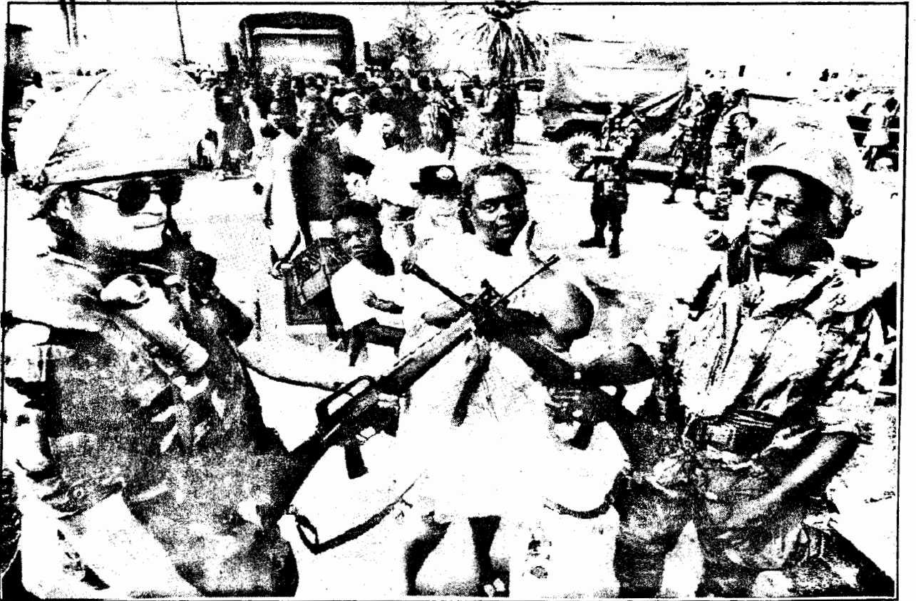
Somali'de insani yardım adı altında militarist terör.

Sonra, 1975'de Haile Selassie devrildi. Barre, Etyopya'daki bu kargaşadan yararlanmaya çalıştı. Ogaden sınır bölgesine tecavüz etti. O, RSE'ye güveniyodu. Ama Sovyet emperyalistleri çoktan sırtlarını dönmüşlerdi. RSE için Etyopya çok kıymetli bir mütte-