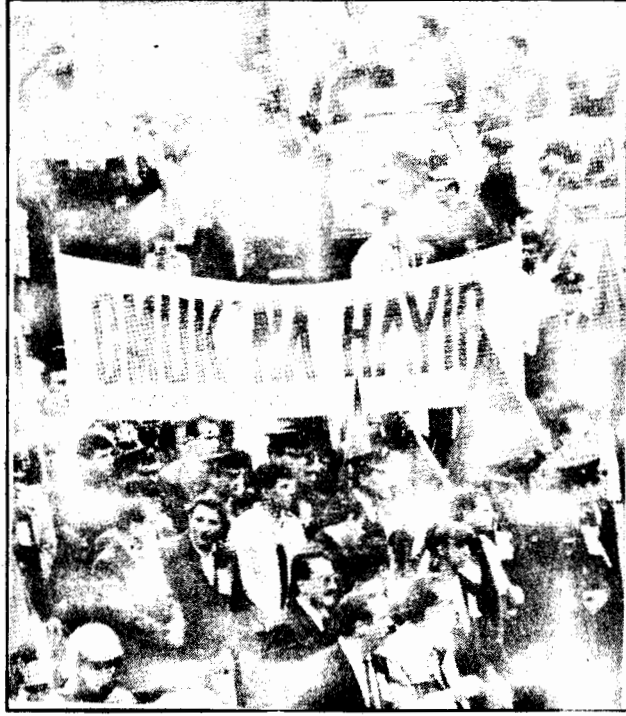
"Devlet memuru" polis, polis devletine yaradır şekilde kendi yasalarını kendi yapıyor.

Bu kadar kıyılan, aşağı-lanan bir ulusun isyanı son derece haklı ve kaçınılmaz değil midir? Her Türk emekçisi, insanı kendi kendisine sormalıdır. Aynı durum sana yapılırsa, katlanabilir miydin, isyan etmez miydin? Bütün üstün savaş gücüne karşın, savaşın kurallarına bile dürüstçe uymayan ve dünyanın belli başlı çirkin, iğrenç savaşlarından birine dönüşen bu savaşta mazlum, zayıf bir ulusun direnişini ezmeye gönderilirken ölenlerin gerçek "katilleri" faşist Türk hakim sınıf çeteleri değil midir? Bu katiller soyu, Kürt ulusunun kendi topraklarında egemence yaşama isteğine