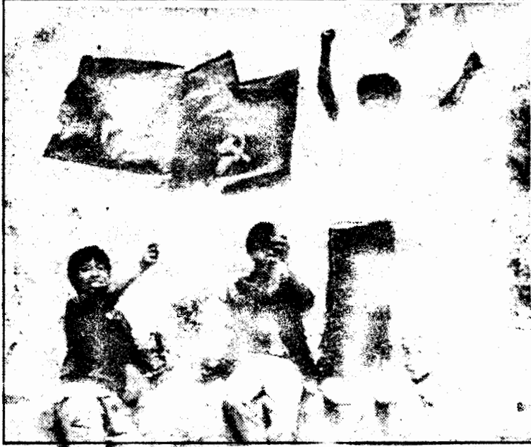
Huaycan gecekondularından, PKP'nin genç destekçileri.

Elbette ki, Başkan Gonzalo ve diğer bir kısım PKP önderlerinin yakalanmasıyla birlikte, emperyalizm ve Perulu uşakları, önce derin bir oh çektikten sonra zafer naraları atmaya başladılar. O'nu yakalamakla tövbe ettirip bilincini teslim alabileceklerini zanneden emperyalistler ve faşist Perulu uşakları, Başkan Gonzalo'nun halka, devrime ve Komünizm'e olan sarsılmaz inanç, azim ve kararlılığı ve granit kaya gibi vakur ve direngen tavrı karşısında hayal kırıklığına uğradılar. Başkan Gonzalo'yu ele geçirmekle umduğunu bulamayan faşist hakim sınıflar yeni senaryolar hazırlamaya başladılar. Deneimleri altındaki emperyalist medya araçlarını, modern teknolojinin ürünü olan ve dünyanın çevresini ağ gibi ören ideolojik terör yayma kaynağı uydularını derhal devreye sokarak tek yanlı bir