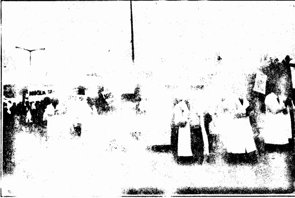
TTB'nin düzenlediği beyaz yürüyüşte sınıf bilinci zayıf.

Beyaz yürüyüş kuskusuz, pratik anlamda tabip odalarının bir kazanımıdır. Ancak, TTB'nin ekseninde kalması, kamu çalışanları sendikaları, işçi sendikaları ve demokratik kitle örgütlerinden yalıtık olması, sağlık sorunlarının diğer ucundaki kesimlerin katılımının sağlanmaması önemli bir eksikliktir. Taşınan bazı pankartlardaki arabesk, hedefi belli olmayan, anlamsız, üst sınıf vurgusu yapan sloganlarıyla da olumsuzluk içeriyordu. "Sağlık ocağında bir hekim, hem öksüz hem yetim", "Pratisyen hekim, pratisyen hekim sakin ol, sağlık ocağına sahip ol", "Yaşasın aile hekimliği, hoş geldin patronluk", "Bu maaşla geçinmiyoruz, hekimlik onurunu geri alacağız", "Emeğimiz nitelikli emektir, karşılığını istiyoruz", "Anneme hekim olduğumu söylemeyin, o benim belediye çalışanı olduğunu sanıyor", gibi. ■