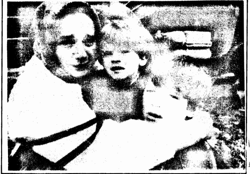
Jajca'dan kaçarak Travnik'e ulaşmaya çalışan Boşnak ve Hırvat siviller saldırlardan kurtuluyor.

Bugünlerde Bosna-Hersek'te yapılan ateşkesler ve ateşkes ihlalleri tartışılıyor. TBMM'nin Bosna-Hersek'e müdahale kararı