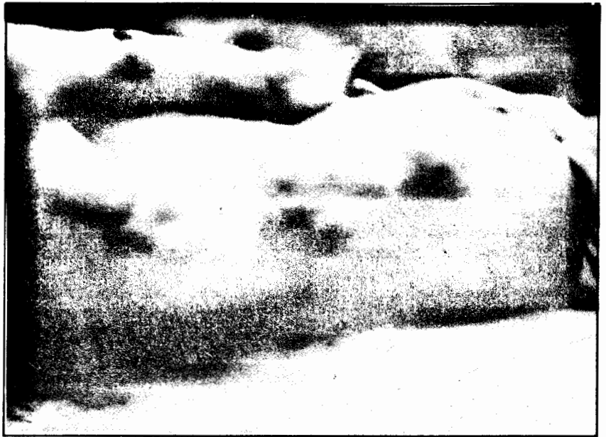
Dicle'de iç hareket tüm vahşetiyle devam ediyor...

Bölgesel anlamda düşündüğümüzde, Balkanlar, Kafkasya ve Orta-Doğu'nun içinde bulunduğu karışıklıklardan yararlan-