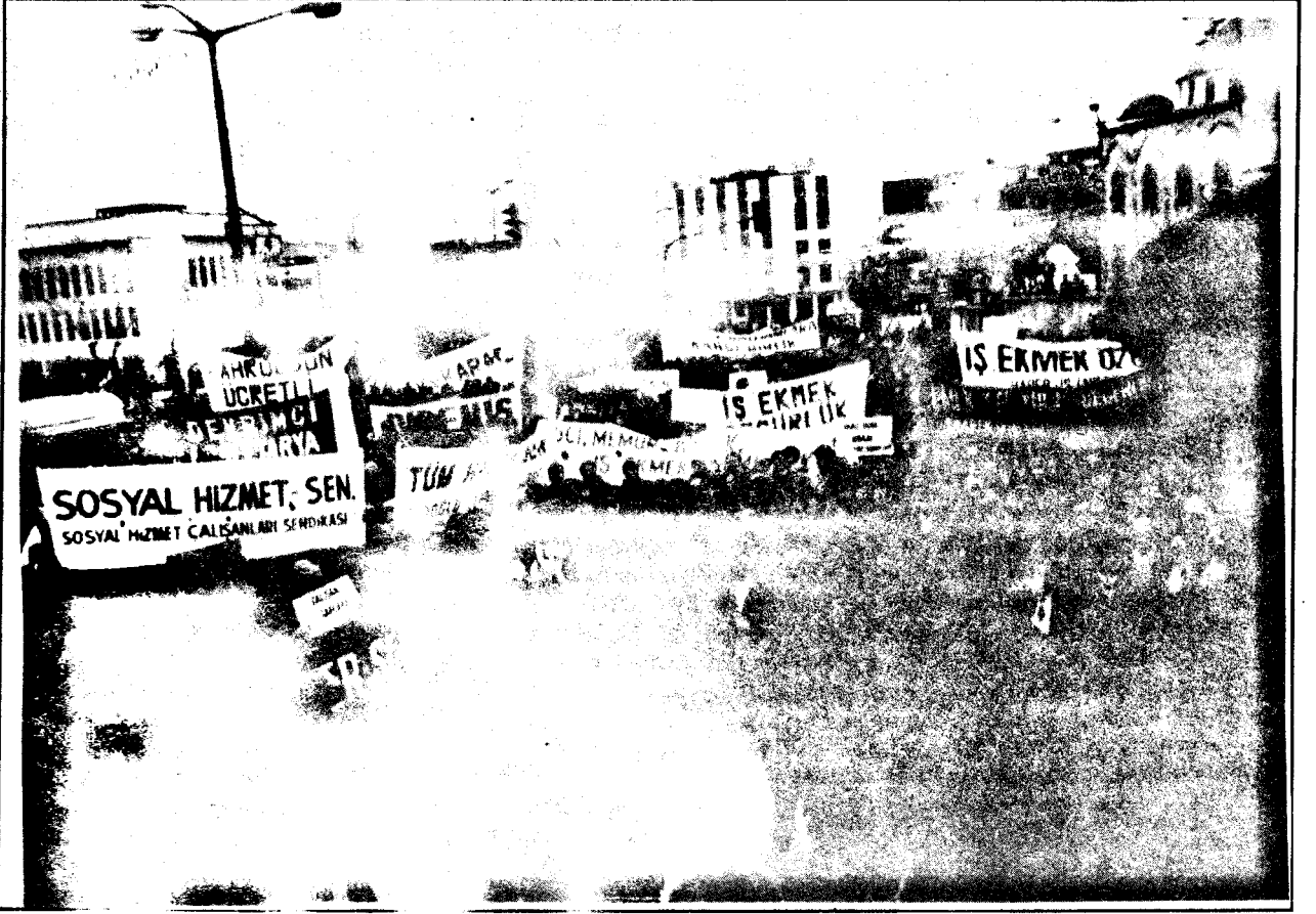
Artık kapıkulu olan memur yok. Meşruluğunu dayatan ve kabul ettiren kamu emekçileri var.

memlekete komünizm lazımsa onu da biz getiririz" diyen (Komünizmi bir başka devletin güdümüne girmek, onun uşaklığını yapmak olarak algılayan ve hatta bir dönem sahte Komünist Partisi kurturtan bu efendi tercihi, zihniyetin, gelişen mücadeleyi bölmek, yönünü şaşırtmak için "Türk Kamu-Sen" adı altında sendika oluşturma çabalarıdır. Zamanında Türk-İş sendikasını kurduran; İşçileri aldatan, oyalayan ve hala da "ağa değişimleriyle" umut tazeleten çabanın bir benzeri de kamu çalışanları üzerinde uygulanmak isteniyor.