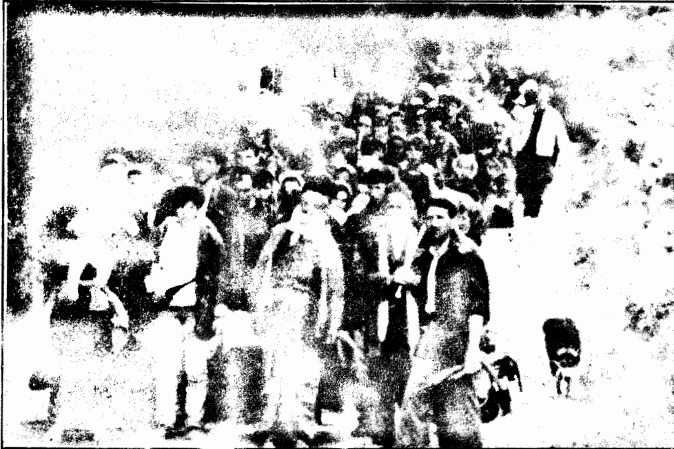
Emperyalistler tarafından kışkırtılan milliyetçilik insanları yurtlarından ediyor.

Fransa ve Almanya açıkça ABD ve onun liderlik ettiği UN (Birleşmiş Milletler-çn)'ye karşıdır-ABD aynı zamanda NATO demektir. Franko, (Yeni Dünya Düzeni savunucusu ABD'yi tehdit eden bildiriler yayınlayan Alman radyosu) bu rakiplerine meydan