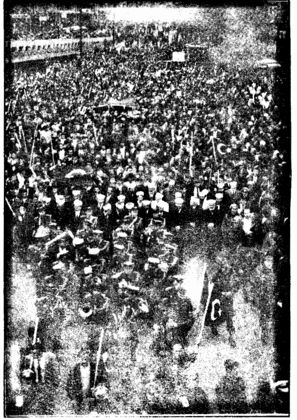
T.C. Valilerinin çağrılarıyla kışkırtılan ırkçılık, halkların kardeşliğini ve çıkar birliğini bozamaz.

Devletin inat ve ısrarla yürüttüğü bu kirli savaşta grup grup öldürdüğü Kürt gerillalar da