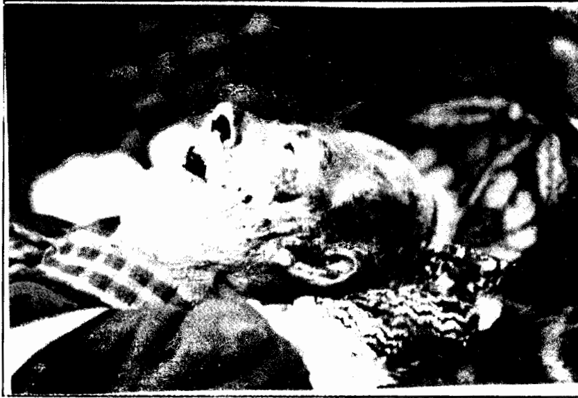
"Topyekün savaş": sadece yurtsever ve komünist gerillaları değil 70'lik dedeleri de hedefliyor.

Belirlemelerini, devletin uyguladığı terörün şiddetine göre yapanlar, kah burjuva demokrasisinden, kah Bonapartizmden bahsediyor ve devlet terörü azgınlığında "faşizm mi geliyor?" sorusunu kendi kendilerine sormaya başlıyorlar. Onlar, ML yerine oportünizmi klavuz edinip, diyalektik yerine idealist yöntemleri kullandıklarından belirlemelerini zalimin uyguladığı zulmün derecesine göre yapıyorlar. Terör'ün uygulanış biçimi ve dozunu belirleyen, egemenlerin sömürü ve talan düzenlerini sürdürebilmek için duydukları ihtiyacın sonucu olduğunu, bu düzeni daha uzun yaşatabilmek için ne kadar artırmaları gerektiğini düşünüyorlarsa, terörlerini o kadar arttırdıklarını bilmiyor gözüküyorlar.