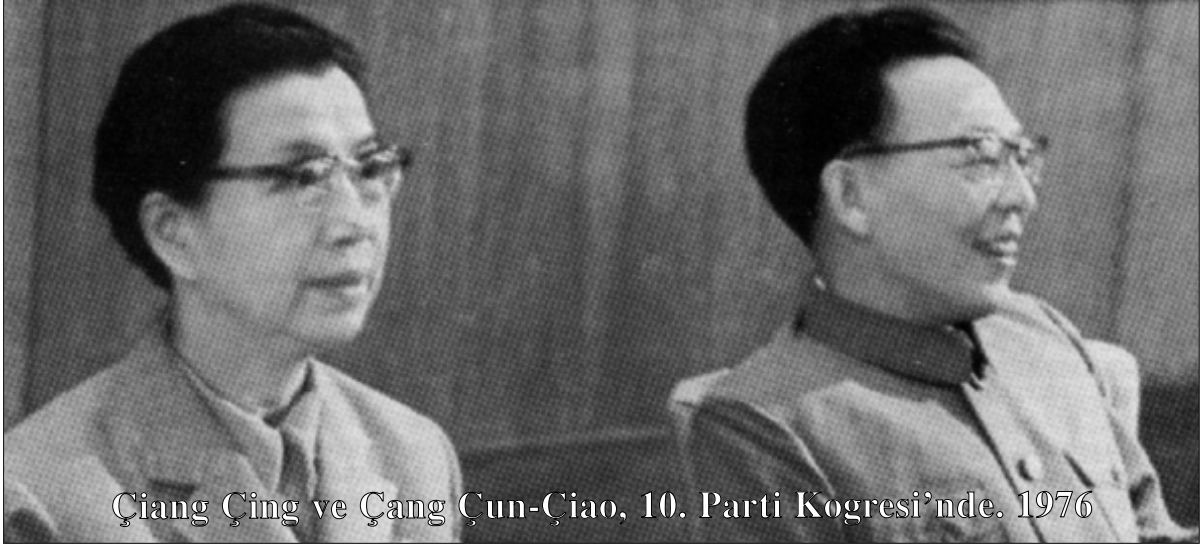
Çiang Çing ve Çang Çun-Çiao, 10. Parti Kogresi'nde. 1976

arasında popüler olan (Mao'nun toplumu daha da devrimcileştirme yönündeki girişimlerine karşı çıkararak modernleşme adına mevcut yuvalarını sağlamlaştırmanın propagandasını yapan) bir düşünce ekolünü savunup teşvik eden kişilerdi.