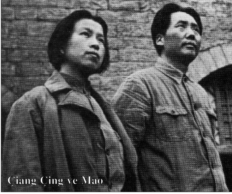
Çiang Çing ve Mao

disine tam saygı göstermeyi reddetmişlerdi. 1940'ın başlarında veremle mücadele etmekte olmasına rağmen, Çiang Çing, Lu Hsun Akademesinde tiyatro sanatı öğretti ve Japon saldırılarına karşı çıkmaları yönünde kitlelere çağrı yapan ve cephedeki yerel halka götürülen piyeslerin sahneye koyuluşuna önderlik etti.