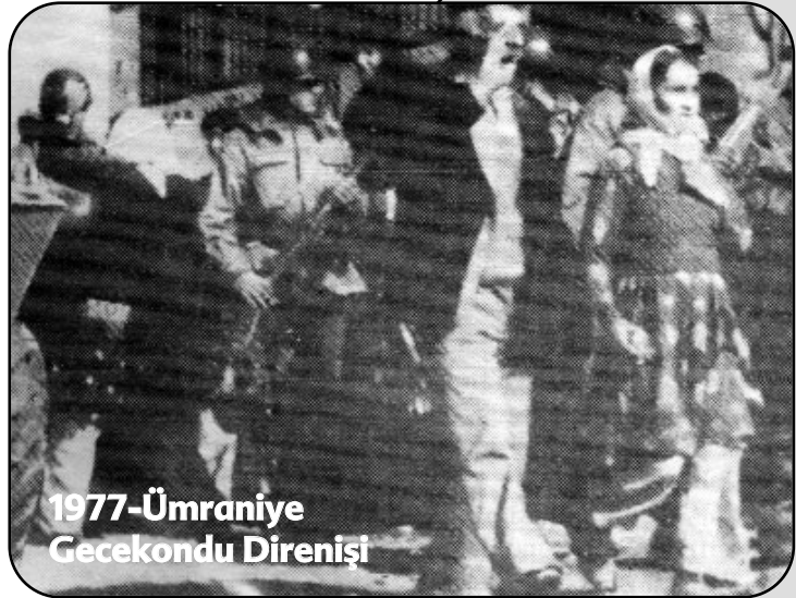
1977-Ümraniye Gecekondu Direnişi

ha aramaya çalışalım. Harekete geçmek, tanımak ve bilinçlendirebilmek için onların içinde olmak gerekir. Fakat içlerinde olmayı sadece olanaklardan yararlanmaya ve onlarla ahbap-çavuş ilişkisi kurmaya indirgememeliyiz. Sadece başımız sıkıştığında ve gidecek yerimiz olmadığında kitlelere gitme tarzına indirgememeliyiz. Kitlelerin içinde olmayı sadece onlarla ilişki kurma ve desteklerini alma şeklinde geçinmecî bir tarza sokmamalıyız. Onları tanımak, güçlü politik bağlar kurmak ve devrime seferber etmek için kitlelerin içinde olmalı-