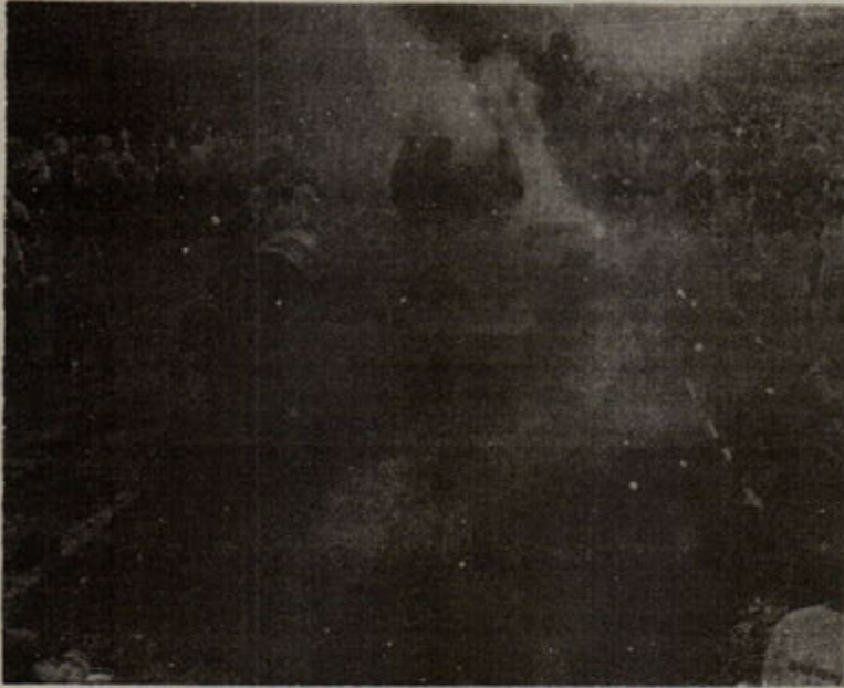
27. Ordu'ya bağlı birlikler Tienmen meydanında ölüm saçıyorlar. Direniş bütün şiddetiyle devam ediyor.

“demokrasi” ve “özgürlük” talepli gösterilerle yanıt bulması son derece normaldi, tarihin gelişen koşullarına da uygun düşüyordu.