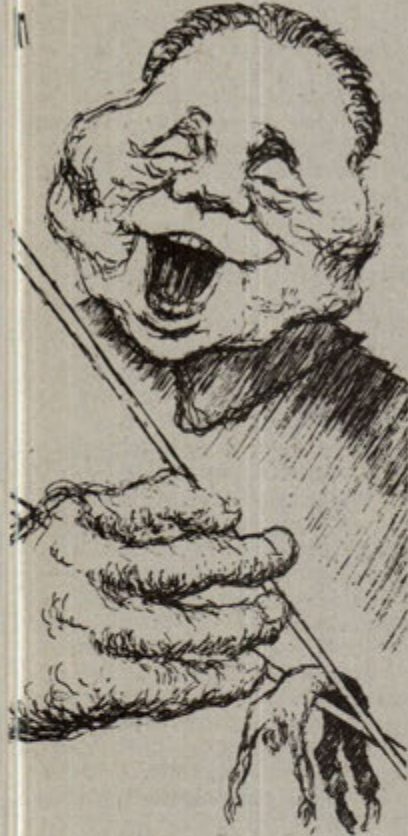
Deng ve Çetesi insan avında.

rara, hareketin ve çatışmanın turmanmasına yolaçmıştır.”