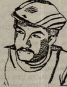
Hasan Kızılkaya 2 Eylül 1977