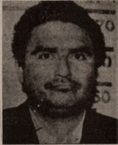
PKP Başkanı Gonzalo

Son derece acı, merhametsiz bir katliam sürdürülmekteydi. Biz bütün gücümüzle onlara direniyorduk. Gerçiklik ve özellikle silahlı kuvvetler 1984'de bizi yok edeceklerini hayal ediyorlardı. Ben onların belgelerine başvuracağım: Bu belgede bizim artık bir tehdit oluşturmadığımız, esas tehdiden MRTA'den geldiği