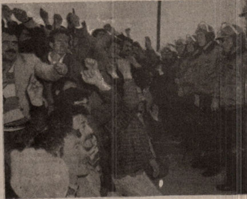
Tütün üreticisi hakkını ararken....

Bunlara destek olma amacıyla İzmir'den de iki kişi açlık grevine katıldı. Ayrıca bu açlık grevini Yol-İş, Seliş-İş, İHD ve büyük ölçüde işçiler destek ziyaretleriyle köylüler ise telgrafla desteklediler. Polis ve Ordu