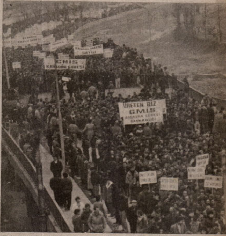
Zonguldak mitingi işçilerin bundan böyle maden ocaklarında diri diri ölmeye razı olmayacaklarını komprador patronlara haykırdığı bir lanetleme mitingiydi.

Dördüncüsü; Miting dönüşü 50 yaşında bir emekli işçinin haberleri dinlerken bültende mitinge yer verilmediğinin anlaşılması üzerine, soför mahalindeki mikrofonu kapıp "Arkadaşlar biliyoruz ki şu an 69 işçi kardeşimizin düpedüz diri diri maden ocağına gömülerek patronlar tarafından katledilişimi protesto mitinginden döntüyor. Bu Türkiye'de önemli bir olaydır. 30 bin kişiyle haykırdık, öfkemizi kustuk, birliğimizi ve gücümüzü pekiştirdik. İşçilerin katili patron ağa devletidir dedik. İşte ispatı. Radyo bu önemli olay