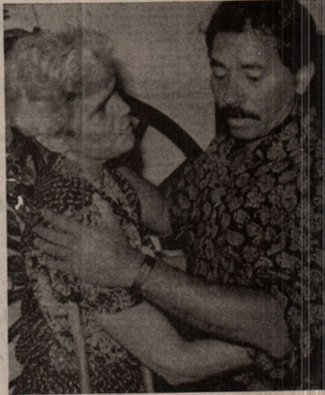
Nikaragua deneyi, küçük-burjuva ideolojisiyle yapılan devrimlerin, kazanılan iktidarların ne kadar sallantılı olduğunu bir kez daha ispatladı.

panyaları, hem de seçim günü oy kullanma ve sayım işlemlerini denetlemesine müsaade etmiş; "Siz kim oluyorsunuz da bizim seçimlerimize karışıyor, sandık başına adam dikmeye kalkıyorsunuz? Bu vesayet hakkını nereden aldınız? Burası sömürge mi? Müfettiş istemiyoyuz. Defolun gidin" diyememiştir.