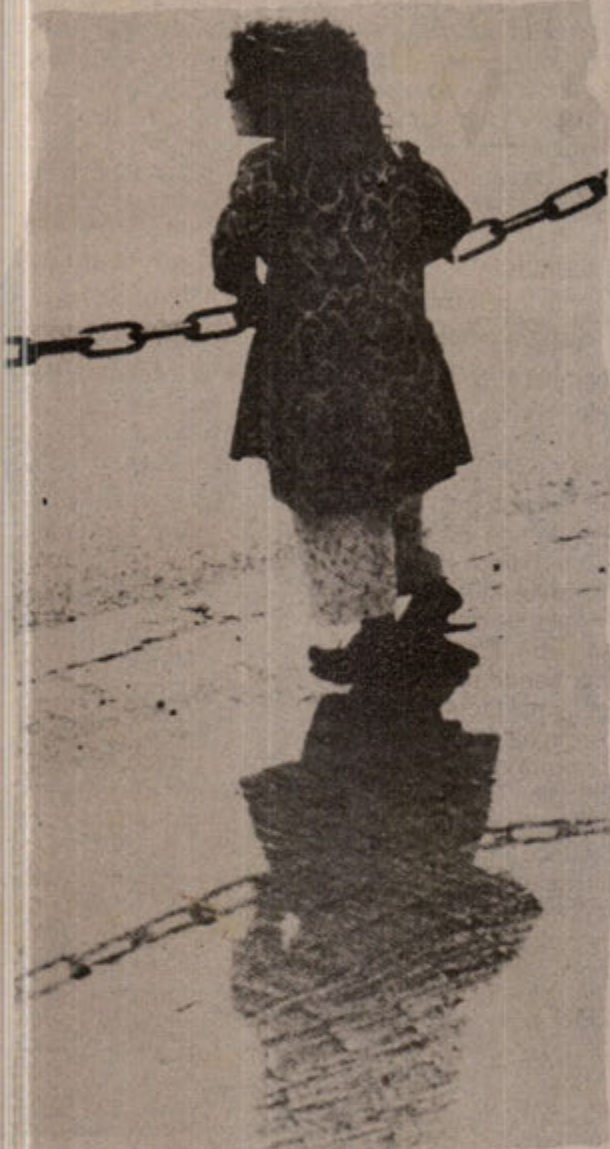
Kadın sorunu sosyalizmde bile kavgası verilmesi gereken bir olgudur.

rayan devrimci hareket 74'ten itibaren tekrar ivme kazanmaya başladı ve bu ivme 80 yılına kadar devam etti. Gelişen sınıf mücadelesi hakim sınıfların içine düştükleri ekonomik ve siyasi kriz 12 Eylül askeri faşist cuntasını zorunlu hale getirdi. Ve ülkemiz 12 Eylül 1980 askeri faşist darbesiyle zulmün, zorbalığın karanlığına gömülmek istendi. Zira ömürlerini biraz daha uzatmak için başka alternatifleri yoktu. Faşist darbeler can simidi gibi sarılırlar ve çareyi çaresizlikte bulmaya çalışırlar. Nitekim 80'li yılların ilk döneminde belli bir başarı da sağladılar. Devrimci örgütlenmeler ağır bir darbe yedi, halkın en temel ekonomik demokratik ve akademik hakları gaspedildi, depolitizasyon ortamı yaratılmaya çalışıldı. Kendilerince dikensiz gül bahçesi istediler. Oysa gülün olduğu yerde