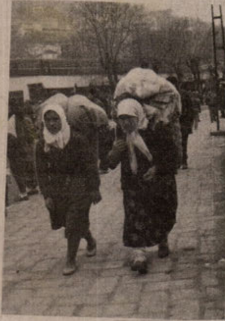
Kadınlar katılmadan devrim olmaz, devrim olmadan kadınlar kurtulmaz

Aynı şey erkekler içinde geçerlidir. Kadına layık olduğu değeri vermeyen onu hor gören, cinselliğini emeğini sömüren özünde kendi kişiliğinin hiçleşmesini ve mutsuz olmayı beraberinde getirmektedir. Düzenin, erkek olmasından dolayı tanıdığı bazı "ayrıcılık"ları kullanırken üstün ya da mutlu olduğunu sanan erkeğin, özünde o küçük "rahat"lığa karşı yitirdiği şeylerin değeri çok daha büyüktür. Zira cahil, boynu bükük kaderine boyun eğen, edilgen bir kadının kocasına vereceği mutlulukta pek kayda değer birşey olmayacaktır. Hele de erkek belli ölçüde gerçeklerin