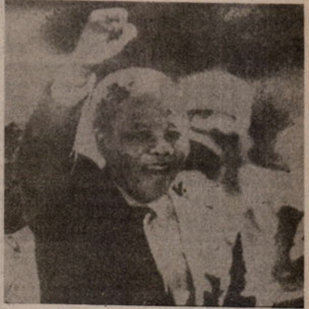
Sıkılmış yumruğunu "silahlı mücadeleye devam" diyor Mandela

Ve içerden de önderlik ettiği ihareketi yine silahlı mücadeleye sevkeder. 1976'da Afrikaner dilinde öğretim yapılması için Soweto'da düzenlenen gösterilerin şiddetle bastırılması üzerine okullarda boykot ve gösteriler yayılır. 1983'ten itibaren yaklaşık üç yıl boyunca sürekli çatışmalar olur. 1.500 siyah ya-