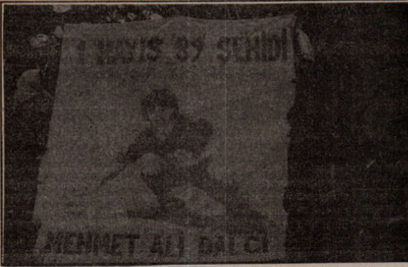
1 Mayıs enternasyonalist ruhun büyük simgesidir. Bu simgeye şehitler verilir.

rununun her zamankinden yakıcı duruma getirdiği. Hakim ulus şovenizmini kavuran, faşizmin resmi politikasına can çektiiren, siyasi krizine daha bir derinlik kazandıran, onu hem daha çok kudurtup hem de çok daha ciddi düşünmeye zorlayan bir gelişme oldu. Devlet kurumları toplantı üstüne toplantı yapıp yeni taktikler saptamaya çalışırken olayların yoğunlaştığı Mardin ili ve yaygınlaşma eğilimi gösterdiği Botan bölgesinde olağanüstü hali çok aşan bir uygulama, adı konmamış sıkıyönetim, asker-polis özel timlerin İsrail ordusuna taş çıkartan vahşeti, Nusaybin-Cizre katliamının dehşeti, yüzler ve binlerce gözaltı, buna karşılık halkın çeşitli biçimlerde direniş sürdürüyor.