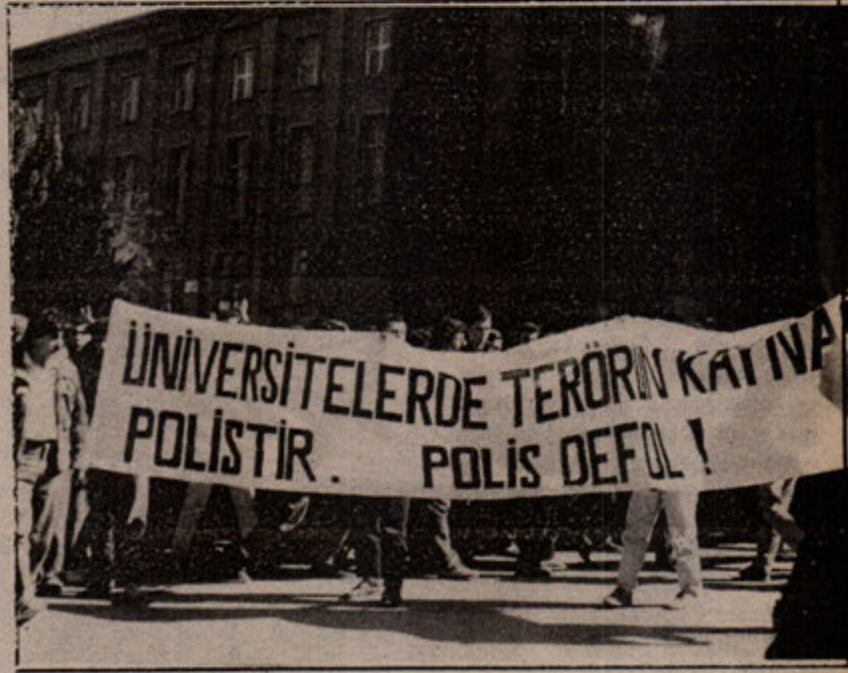
Ankara'daki öğrenci gençlik, üniversitelerdeki terörün odağının polis olduğunu vurguluyor

Daha sonra arkadaşları eleştirip de özelleştirdiğimizde, "yavuz hürsüz, ev sahibini bastırır" misali bir özelleştiri (!) aldık. "Hatalıydık ama haklıyız" biçiminde