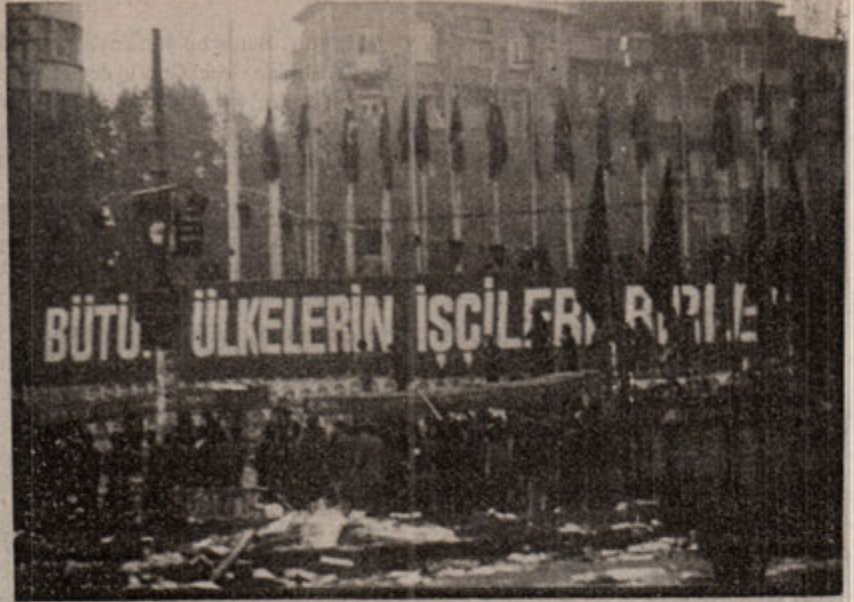
"Protestolar, mitingler, yürüyüşler Genel Greve hizmet eder"

Genel grev; 12 Eylül'den sonra kanunla yasak olması ve daha önceden de öz deneyimlerin yaşanmamış olması nedeniyle ülkemizde çok büyük bir olay şeklinde olmaktadır. Bu bir yerde doğaldır. Ayrıca kendi koşulları içinde olmadığı da doğrudur. Genel grev, sınıf mücadelesinde işçilerin önemli bir silahı olarak görülüp devrimci ciddiyet ve sorumlulukla yaklaşılması gereken, siyasi muhtevası, örgütlülüğü, disiplin içinde uygulanma ve saldırılara göğüs germe koşulları bakımından önemsenmesi şart olan bir eylem çeşididir. Bütün bunlara karşın, adı üstünde, grevin bir işyeri veya işkolu yerine genelde uygulanmasından başka bir şey de değildir. Devrimin zafere ilerlediği dönemlerde en ileri siyasal içerik ve en radikal mücadele yöntemleriyle bir ayaklanma provası olarak hayata geçirilmesi, yoğun sokak çatışmaları, fabrika işgalleri ve barikat savaşlarıyla birlikte yürütülmesi de sözkonusudur. Ancak hiç bir zaman ayaklanmanın kendisi değildir genel grev. Devrimin toplu ayaklanma stratejisine izlediği ülkelerde olsun, halk savaşıyla geliştirildiği ülkelerde olsun, zafer saati yaklaşmadan önce yapılan genel grevler ne kadar güçlü bir siyasal içeriğe sahip olsalar