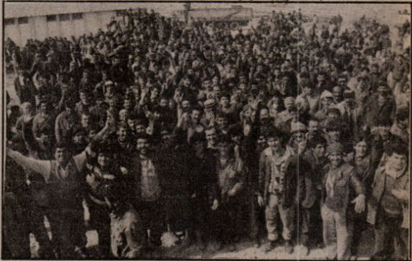
"Ambarlı Kutlutaş işçileri: Yol-İş Sendikasının sarı yüzünü görünce İşçi Komitesi oluşturdu. Onlar haklarını işçi komitesi ile alma mücadelesine eriyorlar."