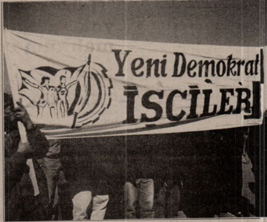
Meydanlara taşan sınıfın mücadelesi faşist düzeni ürkütüyor.

tık sınıf içinde yavaş yavaş tecrit oluyor. Yol-İş yönetiminin Kutlutaş işçileri arasındaki prestiji artık sifıra düşmüş, işçi arasına çıkamaz olmuşlardır. Bu sevindirici bir gelişme. Bir işçi bir sendika genel başkanından daha çok bir prestije ve iyi bir intibaya sahipse ve bir işçi konuştuğunda alkış tufanı, bir sendikacı konuştuğunda yuh sesleri yükseliyorsa o sendika yönetiminin işlevi bitmiş demektir. Evet Kutlutaş işçileri için Yol-İş yönetiminin işlevi kalmamıştır.