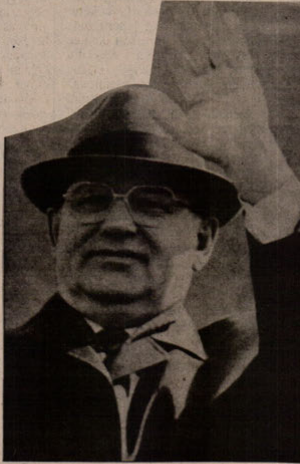
Glasnost ve Prestroyka ile birlikte emekliye ayrıldı.

B.Almanya tarafından yutulması, ekonomik olarak güçlü Alman emperyalist burjuvazisini daha da güçlendirdi. Varşova blokunun en güçlü ülkesi konumundaki D.Almanyanın gücüyle Avrupa'da lider konuma yükselen Almanya, ABD ile boy ölçüşecek durumu gelince çelişmelerini ön plana