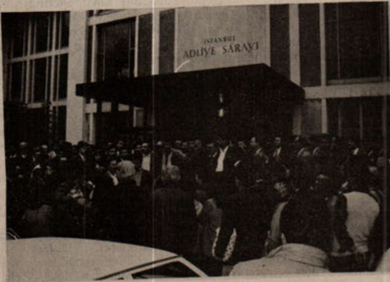
Avukatlar basın açıklamasında.

Önce bu tabutlukları alayıp-pullayıp reklamlarda "lüks odalar" olarak lanse ettiler. Cezaevi uygulama-