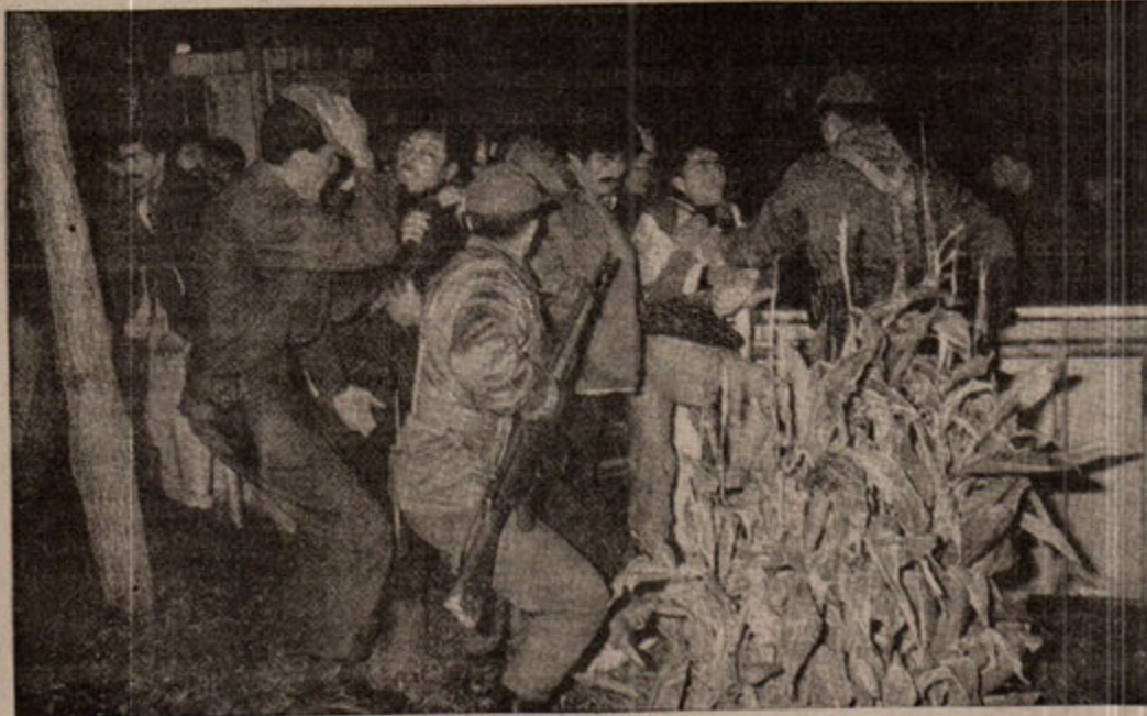
Ne de olsa demokratik devlet(!) Hakkı için mücadele edene jandarma dipçigi.