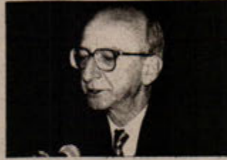
"Aslan Sosyal Demokrat." İrkçi Kemalist yüzünü gizleyemiyor.

HEP, Kürt ulusal burjuva çizgide bir parti olarak kuruldu. Devlete tepkisi olan ve devletten umudunu kesen kitlelerin desteğini almak için kuruldu. Aynı zamanda Kürt burjuvazisi örgütlü hareket etmek için kuruldu. HEP, PKK ve Kürt silahlı hareketini reformizme çekmek için iyi bir araç olacağı düşüncesiyle devlet de belli ölçüde teşvik etti. HEP geliştiği oranda silahlı kürt ulusal hareketlerinin reformizm isteğini artıracakur gözüyle de