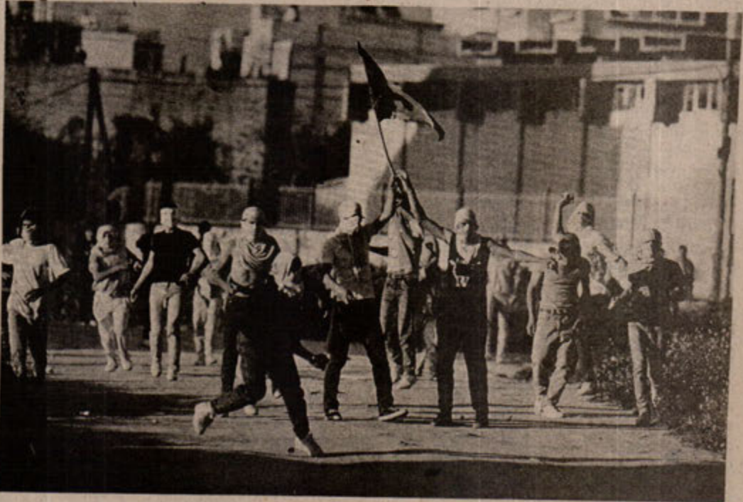
Intifada; Silahlı mücadeleye ulaşmalı! Kurşunlara karşı taşlarla yürekli savaşlarla sürüyor.

Yıllardır İsrail devletini besleyen, teşvik eden, ayakta tutan ABD emperyalizmini hiç bir insani yaklaşım bile aklayamaz. Bu desteğe güvenererek Lübnan'ı kana bulayan, Batı Şeria ve Gazze Şeridi'ni işgal eden, Golan Tepeleri'ni ele geçiren, işgal alanlarında bu "barış" görüşmeleri sürecinde bile yerleşim bölgeleri kuran İsrail'ide hiç bir yaklaşım paklayamaz. Bir dönemler S. Birliği'ne güvenererek bölgede kendisine çıkar sağlamaya çalışan ve hatta uzun zaman FKÖ'ye kem gözle bakan Suriye de te-