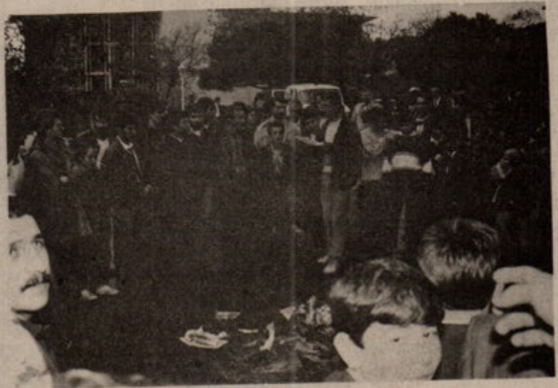
Devrimci-demokrat basın emekçileri, "tabut" maketi yakarak "Eskişehir"i protesto ettiler.

ve yanlarında bulunan avukatları polis tarafından kıyasıya dövülerek gözaltına alındı. Aileler kararlılıkla direnmelerine rağmen, yaklaşık 20 dakika süren, polislerin gözünü dönmüşçesine saldırıları sonucunda, birçok avukat ve tutuklu yakını gözaltına alınırken, olayı görüntülemek isteyen gazeteciler de yine aynı