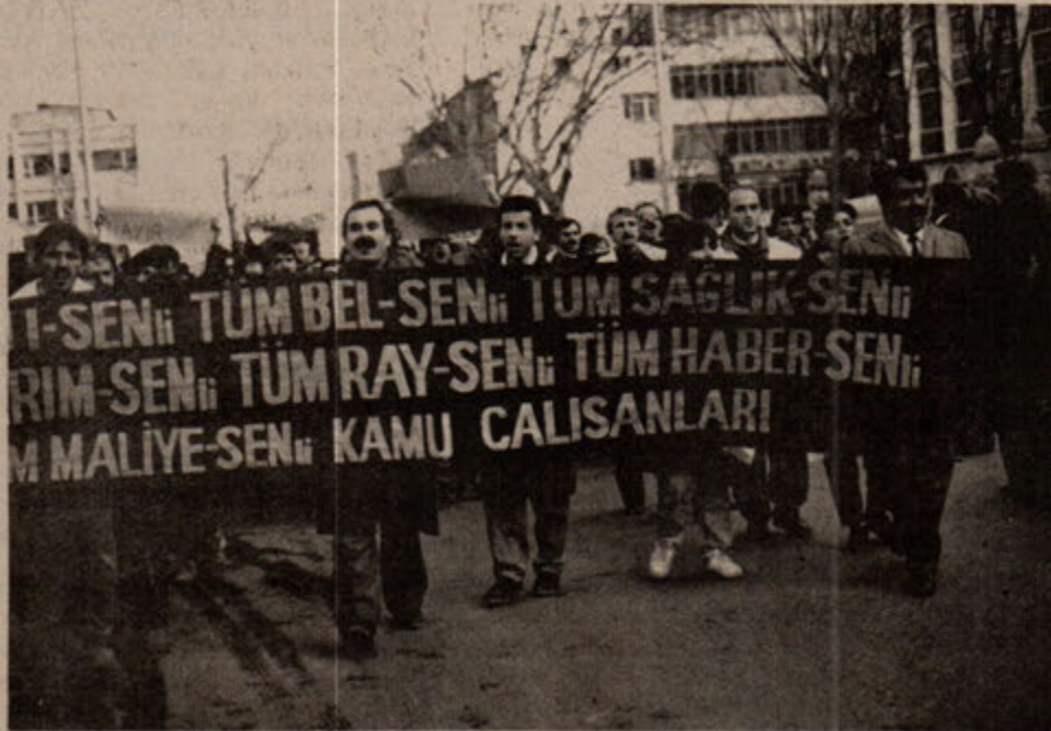
Sağlıkçı'sı, Eğitimci'si, Belediyeci'si, Maliyecisi Ziraatçı'sı, Demiryolcu'su, ve Basın Memurları Sendikal haklara doğru adım adım ilerliyorlar.

Dağıldıktan sonra, biri Tüm Sağlık-Sen'li iki bayan gözaltına alındı. Yürüyüş esnasında polislin müdahale etmeyerek, yürüyüşçülerin yanlarında yürüdüğü gözlemlendi.