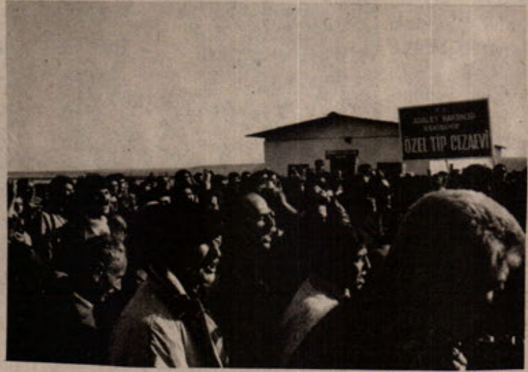
Kitle gösterileri Eskişehir Cezaevi'nin kapatılması sürecinde etkili oldu.

Tutuklu ailelerinin en büyük eylemliliği ise, 20-21 Kasım günleri Eskişehir Cezaevi önünde ve Ankara'da TBMM önünde oldu. 20 Kasım Çarşamba günü İstanbul, Bursa, Ankara, Diyarbakır, ve Aydın'dan gelen aileler, İHD,