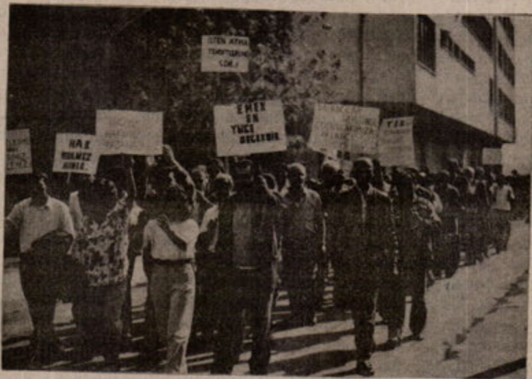
Küçük çekmece Belediyesi İşçileri; Kurtuluşun mücadelesinde olduğu bilinciyle yürüyorlar.

K. Çekmece belediye işçileri, ekonomik mücadelelerinde genel işçi düzeyinin biraz üstünde bir düzeye sahiptir diyebiliriz. Maaş sorunundan dolayı