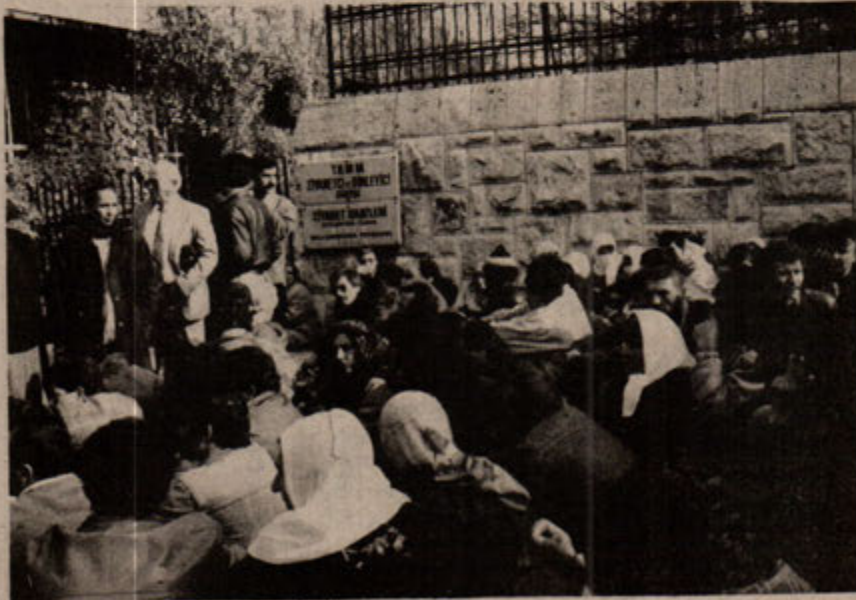
Halk TBMM'yi kuşattı.