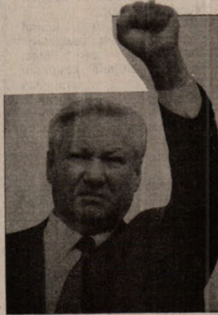
Yeltsin: Amerika'nın koltuk değneği.

İçte de, Stalin döneminde gönüllü bir temelde bir araya gelen cumhuriyetlere de baskılar uyguluyordu. Özellikle 60'lı yıllardan başlanarak bütün önemli sanayi kuruluşları ve nükleer tesisler Rusya Federasyonu ve Ukrayna'da toplandı. Rusya Federasyonu