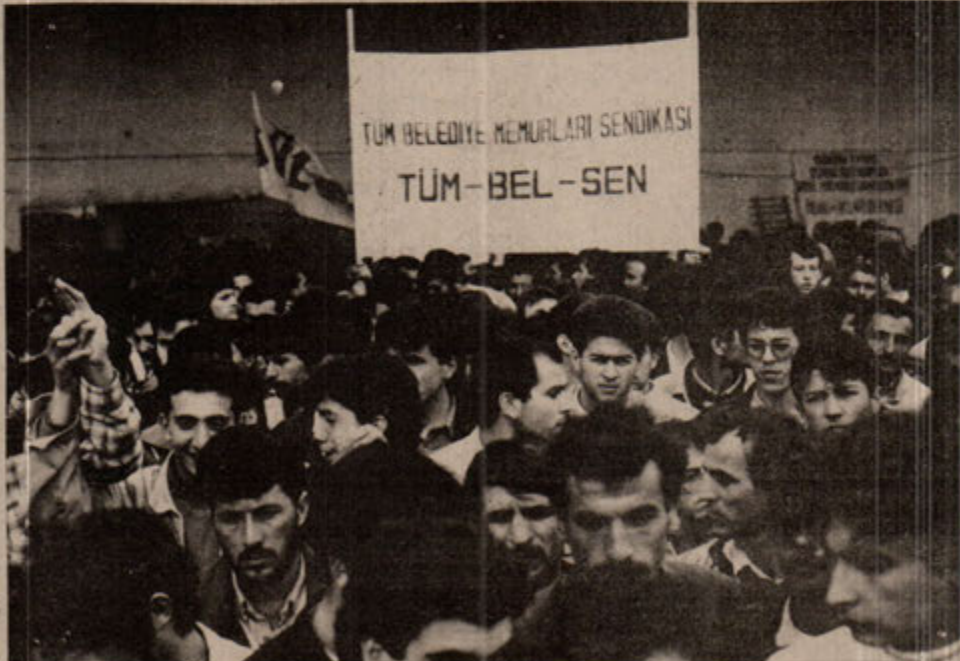
Belediye Memurları sokaklarda: Kaşları zulme çatılmış.

önemli bir kazanımdı. Dolayısıyla Kongredeki coşkunluğun bu öneme yakışır bir düzeyde olması gerekir. Bunu sağlayacak olan da Kongre Divanıdır. Böyle kongrelerde divanın seçimi çok önemlidir. Çünkü kongreye yön verecek onun nabzını elinde tutacak organ divandır. Bu bağlamda divan seçimi için iki ayrı liste sunuldu. Birinci liste Geçici Merkez Yönetim Kurulu tarafından üzerinde anlaşma sağlanan liste 2. liste ise Devrimci Demokratlar tarafından verilen liste idi. Yapılan ilk oyla-