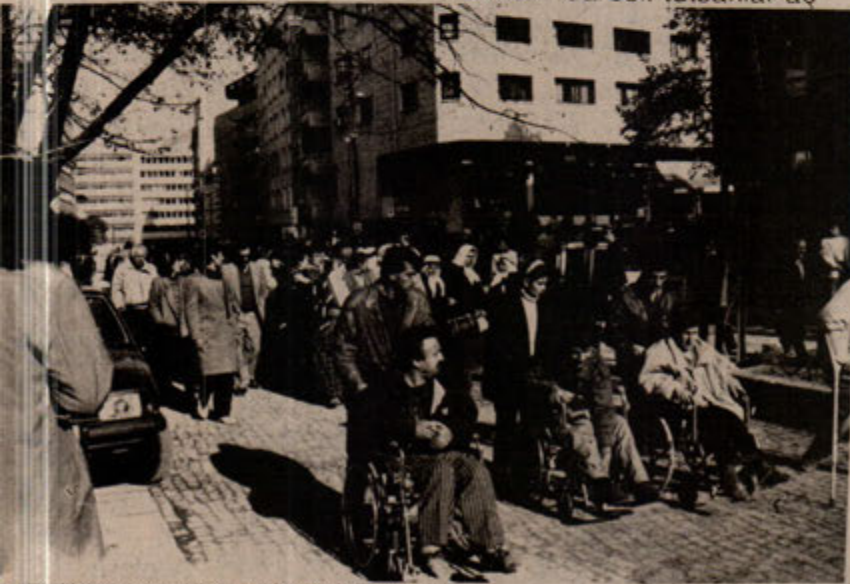
Ayaklarından yoksundular. Ama yürekleriyle direnenlerin yanındaydılar.

k grevine gittikleri için, yönetmeliğe göre onları cezalandırıyor ve zaten 15 dakika ile sınırlı olan görüşü de yasaklıyordu. Protesto boyunca "İnsanlık Onuru İşkenceyi Yenecek!", "tutsaklara özgürlük!", "İşkencecilerden Hesap Soracağız!", "125'e Hayır!", "Devlet Terörüne Hayır!", sloganları atıldı. İstanbul Sakatlar Derneği'nden gelen destekçiler de bir konuşma yaparak "Cezaevlerinde sakatlık nedeni olan uygulamaların son bulmasını, insan haklarına saygılı olunmasını ve bunun için mücadele edilmesini istediklerini" belirttiler. Ziyaretçilerin slogan ve marş seslerini duyan hücrelerdeki tutuklular da aynı şekilde sloganla, marşla ve hücre kapılarına vurarak yanıt vermeye, iletişim kurmaya çalışıyorlardı.