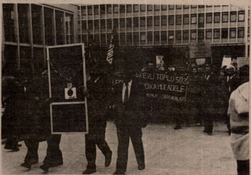
Belediye Memurlarının mücadelesine Devletin vurduğu mühür engel olamadı.