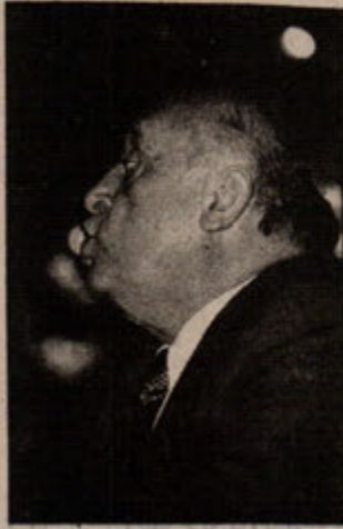
Baba bu kez, demokrasi havarisi...

Egemenler sınıflar her zamanki yalan ve demogojisiyle bu seçim yarışını; büyük bir demokrasi yarışı, görülmemiş demokratik ortam olduğunu iddia ettiler. Burjuva demokrasisini bile yaşayamamış ve böylece demokrasinin nasıl