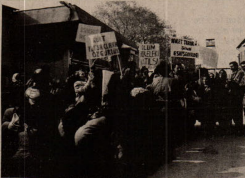
Bir avuç tutsağın haykırışıyla başlayan direniş zindanları aşip kitleleri ateşledi.

21 Kasım günü, sabah erkenden, 150 kişi kadar olan tutuklu ve hükümlü aileleri, Karanfil Sokak'tan kortejler halinde TBMM'ye yürüyüşe geçtiler. Ancak daha yürüyüşün