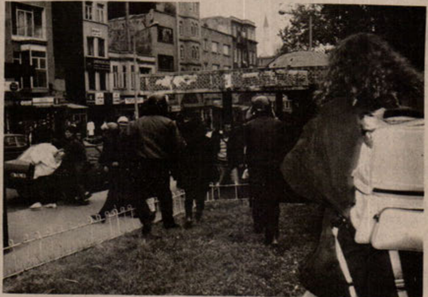
Hukuk devletinin polisi, basın açıklaması sonrası avukatları ve diğer protestocuları topluyor.

13 Kasım Çarşamba günü İHD'li avukatlar İstanbul Adliyesi önünde bir basın açıklaması yaptılar. Basın