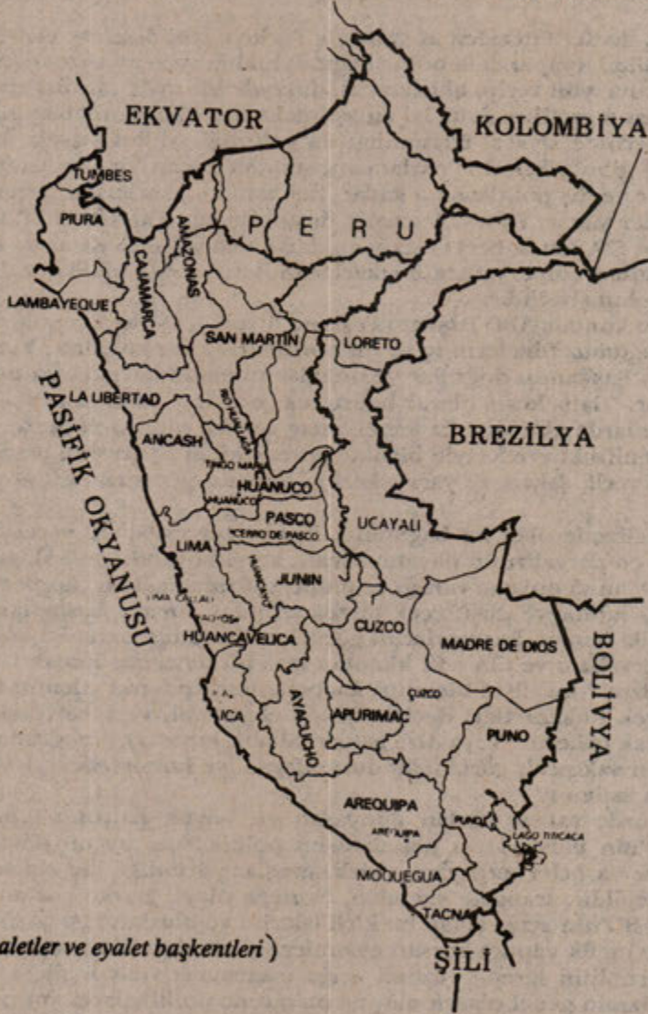
Peru (eyaletler ve eyalet başkentleri)

getirilmesi sorumluluğu verilmiş olan bu ordu savaşçıları ve komutanlarının büyük bir yüzdesini kadınlar oluşturmaktadır. Ataerkil bir yapıya egemen sınıflar bu durumu kendileri için gayet tehdit edici bulmaktadırlar. Gerçekten de, Peru'lu gericileri ve onların yabancı patronlarını hepsinden çok paniğe boğan şey, Halk Gerilla Ordusu'nun halk kitlelerinin, özellikle yoksul köylülerin, siyasi bilinçlenişi, örgütlenişini ve kendilerini silahlandırışını temsil etmesidir.