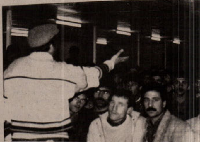
Bahçeşehir inşaat işçileri, işverenin Kürt-Türk ayrımı yapmasına karşı çıkıyorlar. İşverenin "İşletme" uygulamalarında komando alayının da işverenin yanında olması, Bahçeşehir'in yığıt işçilerini yıldırmıyor, mücadele devam ediyor.

Sosyalist basının Bahçeşehir'e, işçilere yapılan saldırıları, baskıları ve insanlık dışı çalışma koşullarını görüştürmek için gitmeleri işçileri çok sevindirdi. Bundan sonra sosyalist basının Bahçeşehir'deki uygulamalara daha duyarlı olmasını istediler.