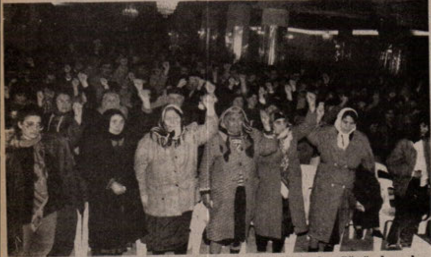
Yeni Demokrat Kadının 8 Mart Dünya Emekçi Kadınlar Gününde, gelecek güzel günler için kendini feda edenlerin anılarına saygı duruşunda bulunuldu.

Kitlelere dayanıyoruz, diyorsak kitleler bunun bilincinde olmak zorundadır.