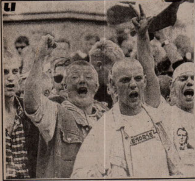
"Yabancılar Dışarı" diye bağırarak faşizmin bu uşakları acaba ekonomik bunalıma çare olabilecekler mi?

İktidarı verdiği zemin üzerinden rahatça hareket serbestisine sahip olan faşist parti ve örgütler son seçimlerde oylarını dört misli artırarak güçlenen Vlaams Blok Partisi meclise 12 milletvekili sokmayı başardı. Gelecekte iktidara doğru yürüyen faşist partinin önünde önemli bir engel yoktur. Aksine destek ve onay görmektedirler. Belçika'da da yabancıları yönelik ırkçı saldırılar yoğun bir şekilde sürdürülmektedir. Buna karşılık bazen yürüyüş ve mitingler tertiplenmektedir.