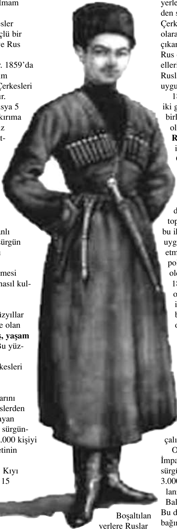
Boşaltılan yerlere Ruslar ve Kazaklar

Karadeniz kıyılarını kesin olarak Çerkeslerden arındırmayı amaçlayan Rusya soykırım ve sürgünden sonra kalan 85.000 kişiyi Adıgey Cumhuriyetinin olduğu bölgeye sürmüştür. Kıyı bölgelerinde kalan 15 civarında Şapsığ köylerine ise kıyıya 20 km'den fazla yaklaşmaları yasaklanmıştır.