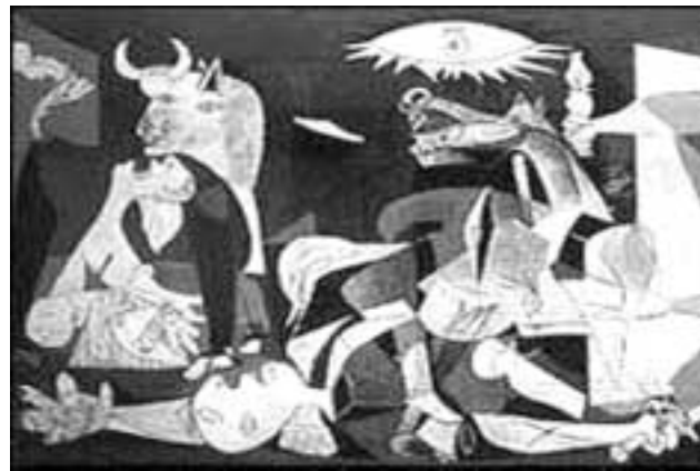
Pablo Picasso'nun Faşizmi anlatan Guernica adlı tablosu.

ABD Dışişleri Bakanı George Marshall tarafından ortaya atılan program, 2. Emperyalist Paylaşım Savaşı sonrasında yaşanan işsizlik, yoksulluk ve kargaşanın, Batı Avrupalı halkları komünist partilere yöneltmesinden çekinen ABD yönetimi, bu ülkelerin ekonomik durumlarının biran önce düzeltilmesi için bir program hazırladı. 5 Haziran 1947'de hazırlanan Marshall Planı, 3 Nisan 1948 'de ABD kongresi tarafından onaylanarak yürürlüğe girdi.