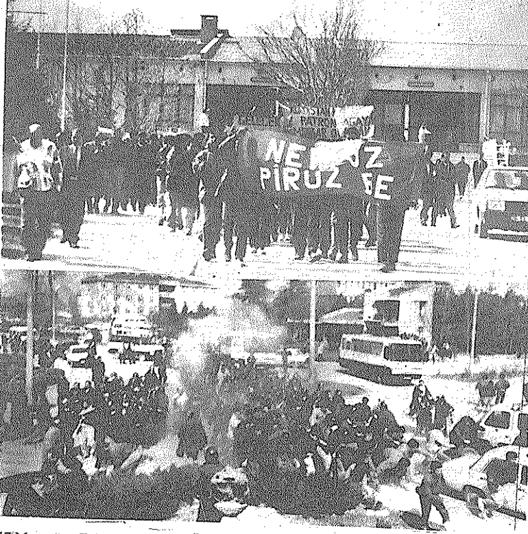
17 Mart günü Eskişehir Anadolu Üniversitesi'nde yapılan Newroz kutlamasına poliş saldırmış, birçok öğrenciyi gözaltına almıştı.

Biz aşağıda imzası olanlar, bu disiplin yönetmeliğini protesto ediyor ve kaldırılmasını istiyo-