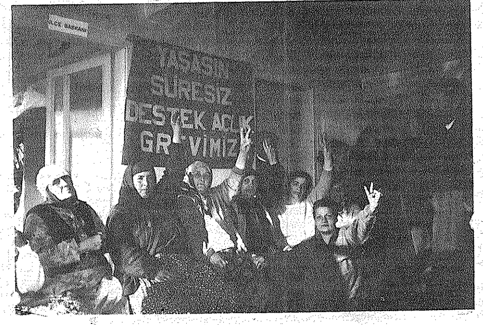
Bir gün sonra 21/3/ '93 tari- Malatya SHP'de aileler açlık grevcileriyle dayanıştı.

Ancak bilindiği üzre açlık grevi kamuoyunu duyarlı hale getirmek için yapılan bir eylemdir ve içerdeki açlık grevleri tek başına kaldığı zaman dışardan bir biçimde desteklenmediği sürece kamuoyunun duyarli hale getirilmesi pek olası değildir. Bu yanıyla bizler yurtseverlerdevrimci-demokrat-komunistler içerde ölümüne insanlık onuruna sahip çıkan bu yiğit insanlara mümkün olan her türlü desteği sunmayı zorunlu bir görev saymalıyız. Unutmayalım ki onlar bütün insanlığın onuru için savaştılar ve savaşıyorlar. 🏻