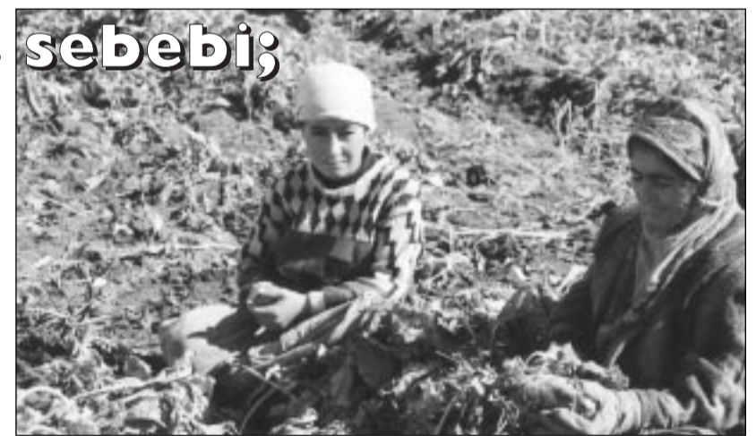
kaliyor" şeklinde konuştu.

nedeniyle iflasyonun eşliğine geldiğini söyledi. Devletin kota uygulamasının tek nedeninin kendi köylüsünü öldürmek olduğunu dile getiren Günbay, "her yıl gübre ve mazot fiyatı yüzde yüz artarken, buğday, şeker pancarı ve patates yarı yarıya düşmektedir. Düşüşle birlikte geliştirilen kota uygulaması ise bizi tamamen iflasyonun eşliğine getirdi. 3 yıl önce 270 YTL olan şeker pancarını, bu yıl aynı fiyata bile zor satıyoruz. Devletin koyduğu bu kota çiftçinin belini kırdı. Pazar olmadı için ürettiğimiz ürünleri satamıyoruz. Ürünlerimiz elimizde