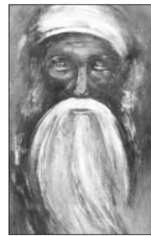
Yazarın Adı: Radi FİŞ Yön Yayınları Çeviri; Moskova 1986 Yapıtın Özgün Adı: "Spyaşçie Probydyatsya"

Yürüdük Yürüdük, Hiç durmadan Bıkmadan, usanmadan Yılmadan Sonu zafere varana dek yürüdük... Vurulduk, Kalleşin sattığı Korkağın kaçtığı Haince pusularda vurulduk... Yurdumuzun bereketli topraklarında... Haykırdık, Sloganlarla Türkü ve marşlarımızla Umuda tohum ektik Halkımızın yüreğine akıp haykırdık... Tutsak düştük, İşkenceler gördük "Parça parça edildik Bilinmez yerlere gömüldük" "Ser verdik seve seve" Sırrımızı vermedik ölesiye Böyle gördük biz PARTİZAN'lar Yığıtçe direnmeyi hapishanelerinde İşkencehanelerinde Tandık, Düşmanı tanıdık Zulmü ile nasıl sömürüldüğümüzü Çekilen çileleri Göç ettığımız köyleri Susturulmak için Durdurulmak için Yıldırılmak için Kayıp edilmeyi, yok edilmeyi Tandık... Biz PARTİZAN'lar durmadık-durmayacağız Bıkmadık-yılmadık Tükenmedik-tükenmeyeceğiz Umut ile sevdalı yüreklerimizle Tohum olduk inancımızla Düştük yurdumuzun bereketli topraklarına Halkımızın yüreklerine-bilincine Altıncağ'a yürüyen bedenimizle Direnenlerin sesi Dağların dili İşçi-Köylünün umudu ile Yurdumuzun kızıl güneşi olduk Doğduk doruklardan Sevdik Tandık Bağlandı kavgamıza... (Bir İK okuru)