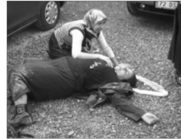
15 Şubat gösterilerine katılan herkesin evleri basılarak terör estiriliyor...

çaplarında "önlemler" almıştı. Buna rağmen çocukların derslere girmeyerek eylemlerde yerini alması Çevik Kuvveti oldukça kızdırmış olacak ki hırslarını yaşları 11-17 arasında değişen onlarca çocuğu ceplerinde misket, ellerinde çamur olduğu için balyıncaya kadar döverek gözaltına aldılar. Sokakta baş-