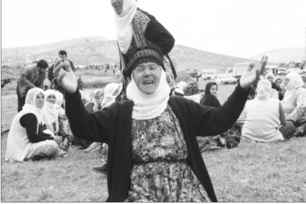
Devletin desteği ile bölgede terör estiren korucular, bu defa büyük bir katliam gerçekleştirdi.

Kürt Ulusal Hareketi'ni bastırmak için toplumun en geri yanlarına tutunarak buraya yüklenen devlet tam da sözü edilen orta-