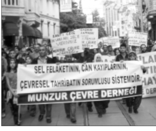
Dersim'de yeni bir baraj daha faaliyete geçti ve 16 Ağustos'tan itibaren su tutmaya