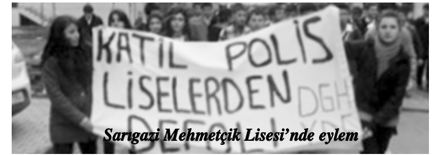
Sarıgazi Mehmetçik Lisesi'nde eylem

Hrant Dink'i neden öldürdünüz? (Ben, kardeşiniz, Ermeni Ulusuna mensup Hrant Dink) (İzmir'den bir İK Okuru)