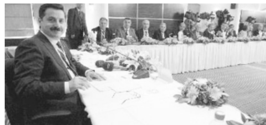
Yaklaşık 400 gazeteci, yazar, akademisyen ve çeşitli kurum temsilcisinin katıldığı büyük bir panayır havasında ve önemli bir iş yapıyormuş edasında gerçekleştirilen çalıştaylarda “küçük” bir ayrıntı unutulmuştu: Alevi çalıştayında Aleviler yoktu.

leri’nin varlığı devletin laikliğini tartışılabilir hale getirirken yeni düzenlemelerle bu söylem daha da çarpık bir hale gelecektir. AKP hükümetinin Alevilere ikinci sürprizi “zorunlu din derslerinin” kaldırılması veya seçmeli ders haline getirilmesi konusunda yaşandı. Çalıştayda yürütülen “engin” tartışmalarla katılımcılar bu sorunu da çözdüler: Zorunlu din derslerine ek olarak isteğe bağlı din dersleri verilecek!