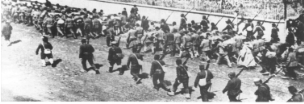
MASS DEPORTATION OF ARMENIANS ACCOMPANIED BY TURK SOLDIERS LA DEPORTATION EN MASSE DES ARMÉNIENS BARRAGÉES PAR LES SOLDATS TURCS

(Yazıda Tessa Hoffman’ın Osmanlı İmparatorluğu dönemine ilişkin, tehcir vd. uygulamalara dair iddiaları içeren kitabından yararlanılmıştır.)