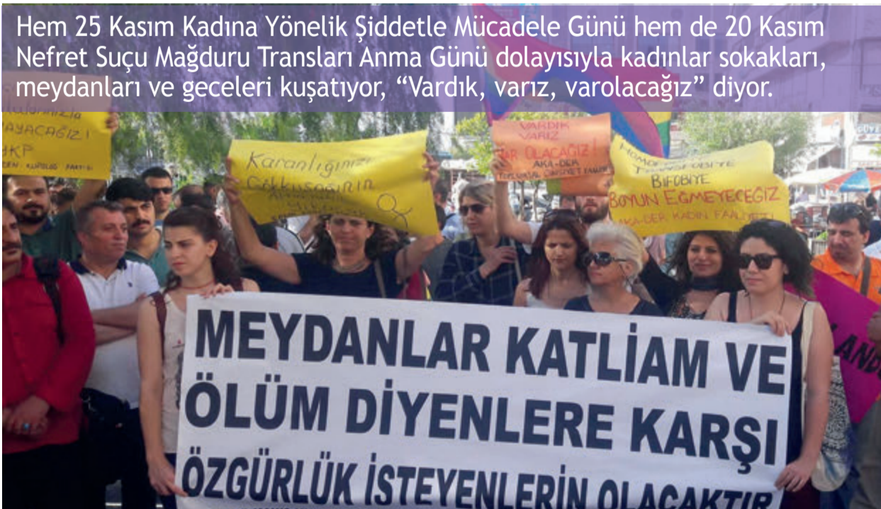
Hem 25 Kasım Kadına Yönelik Şiddetle Mücadele Günü hem de 20 Kasım Nefret Suçu Mağduru Transları Anma Günü dolayısıyla kadınlar sokakları, meydanları ve geceleri kuşatıyor, "Vardık, varız, varolacağız" diyor.