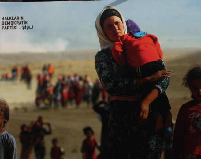
HALKLARIN DEMOKRATİK PARTİSİ - ŞİŞLİ