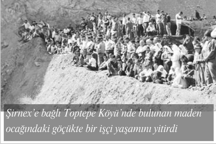
Şirnex'e bağlı Toptepe Köyü'nde bulunan maden ocağındaki göçükte bir işçi yaşamını yitirdi

H. Merkezi: Manisa Soma'da yüzlerce maden işçisi TC'nin taşeronlaştırma sisteminde katledilirken Soma dışında da birçok yerde karaelmas tabut olmaya devam ediyor.